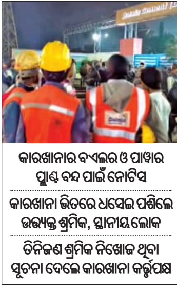
କାରଖାନାର ବ୍ୟବହାର ଓ ପାଖର ପ୍ଲାଷ୍ଟିକ ବନ୍ଦ ପାଇଁ ନୋଟିସ କାରଖାନା ଭିତରେ ଧସିଲେ ଉତ୍ତମ ଶ୍ରମିକ, ସ୍ଥାନୀୟ ଲୋକ ତିନିଜଣ ଶ୍ରମିକ ନିଖୋଜ ଥିବା ସୂଚନା ଦେଲେ କାରଖାନା କର୍ତ୍ତୃପକ୍ଷ

■ ରାଉରକେଲା, ୧୭୧୧ (ସମିସ): ଗତକାଳ ରାଜଗଙ୍ଗାପୁରସ୍ଥିତ ଡାଲମିଆ ସିମେଣ୍ଟ କାରଖାନାର କୋଇଲା ବଙ୍କର ଧସିବା ଘଟଣାର ୩୦ ଘଣ୍ଟା ବିତିଛି । ମାତ୍ର ଏହି ଘଟଣାରେ ବାସ୍ତବରେ କେତେ ଲୋକ ମୃତ୍ୟୁ ହୋଇଛନ୍ତି, ତାହା ବିସ୍ତୃତ ତଥ୍ୟ ମିଳିନାହିଁ । କାରଖାନା କର୍ତ୍ତୃପକ୍ଷ କୋଇଲା ହତୁଣ୍ଡାକୁ ଉତ୍ତମ ଘଟଣାରେ ୩ ଜଣ ନିଖୋଜ ଥିବା ସୂଚନା ଦେଇଥିବାବେଳେ ବାସ୍ତବରେ କେତେଜଣ ନିଖୋଜ ହୋଇଛନ୍ତି, ତାହାର ପୂର୍ଣ୍ଣାଙ୍ଗ ତଥ୍ୟ ମିଳିପାରିନାହିଁ । ଅନ୍ୟପକ୍ଷରେ ଦୁର୍ଘଟଣା ବେଳେ ଅନେକ ଶ୍ରମିକ କାମ କରୁଥିଲେ ଓ ସେମାନଙ୍କ ପରା ମିଳୁନାହିଁ ବୋଲି ଶ୍ରମିକ ସଙ୍ଗଠନ ଓ ସ୍ଥାନୀୟ ଲୋକମାନେ ଅଭିଯୋଗ କରିଛନ୍ତି । ଇତିମଧ୍ୟରେ ସ୍ଥାନୀୟ ପ୍ରଶାସନ କାରଖାନାର ବ୍ୟବହାର ଓ ପାଖର ପ୍ଲାଷ୍ଟିକ ବନ୍ଦ କରିବାକୁ ନୋଟିସ ଜାରି କରିଛନ୍ତି । ଏହା ସତ୍ତ୍ୱେ କାରଖାନା ବିରୋଧରେ ଲୋକଙ୍କ ରୋଷ କମିନାହିଁ । ଉତ୍ତମ ଲୋକମାନେ କାରଖାନା ଭିତରକୁ ଧସିଲେ ପଶି ନିଜ ସମ୍ପର୍କୀୟ ଓ ସାଥୀ ଶ୍ରମିକମାନଙ୍କୁ ଖୋଜିବାକୁ ଉଦ୍ୟମ କରିଛନ୍ତି । ସୁରକ୍ଷା ଡାଲମିଆ ସିମେଣ୍ଟ କାରଖାନାର ଲାଭନ-୨ ପାଖର ପ୍ଲାଷ୍ଟିକ ବନ୍ଦ କୋଇଲା ବଙ୍କର ଧସିବା ଘଟଣାର ଇତିମଧ୍ୟରେ ୩୦ ଘଣ୍ଟା ଅତିକ୍ରମ ହୋଇଯାଇଛି । ୫-୬ ଜଣ ବ୍ୟକ୍ତିଙ୍କୁ କୋଇଲା ଗଦାକୁ ।