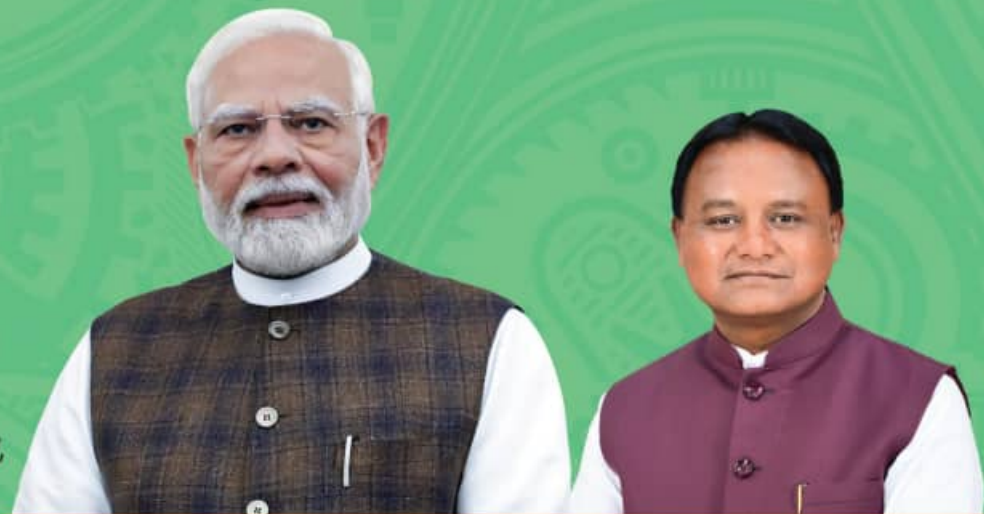
Shri Narendra Modi Prime Minister