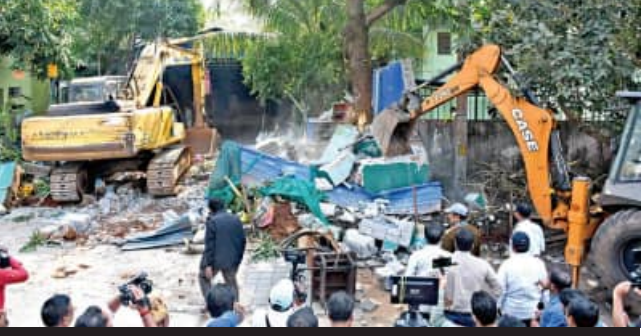
ଅବଶିଷ୍ଟ ଜମିରୁ ଉଦ୍ଧୃତ ଆଜି

■ ଭୁବନେଶ୍ୱର, ୧୭୧୧ (ସମିସ): ମାଟିରେ ମିଶିଛି ଖଣ୍ଡିରିବାରିସ୍ଥିତ ବୈକୁଣ୍ଠଧାମ ଆଶ୍ରମ । ହାଇକୋର୍ଟଙ୍କ ରହିତାଦେଶ ଉଠିବା ପରେ ଆଶ୍ରମ ଭଙ୍ଗାଯିବ ବୋଲି ଗତକାଳି ବିଦି-୧ ପକ୍ଷରୁ ମାଲିକ ଯୋଗେ ପ୍ରଚାର କରାଯାଇଥିଲା । ଆଜି ଦିନ ୧୨ଟା ସୁଦ୍ଧା ଆଶ୍ରମରେ ଥିବା ଜିନିଷପତ୍ର ଖାଲିକରିବାକୁ ବିଦି-୧ ନିର୍ଦ୍ଦେଶ ଦେଇଥିଲା । ବିଦି-୧ର ଚେତାବନା ପରେ ଆଶ୍ରମ କର୍ତ୍ତୃପକ୍ଷ ଗତକାଳି ଆଶ୍ରମରୁ ଜିନିଷପତ୍ର ବାହାରିବା ଆରମ୍ଭ କରିଥିଲେ । ଗତକାଳି ରାତିଠାରୁ ଆଜି ସକାଳ ମଧ୍ୟରେ ୧୦ ଟ୍ରକ୍ ଜିନିଷପତ୍ର ସ୍ଥାନାନ୍ତର କରିଥିଲେ । ଆଶ୍ରମରୁ ଜିନିଷପତ୍ର ଖାଲି କରାଯିବା ପରେ ବିଦି-୧ ପକ୍ଷରୁ ଆଶ୍ରମ ଭଙ୍ଗା ଯାଇଥିଲା । ୨ଟି କେସିବି ଭଙ୍ଗା