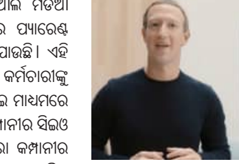
୨୦୨୩ରେ ୧୦ ହଜାର କର୍ମଚାରୀଙ୍କୁ ହଟାଇ ଥିଲା ମେଟା