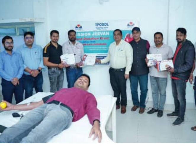
କରିଥିଲା। ଏହା ଫଳରେ ପ୍ରତିଦାନ ଏବଂ କର୍ମଚାରୀମାନଙ୍କୁ ପ୍ରଭାବିତ କରିବା ପ୍ରତି ସମର୍ଥନକୁ ପୁନଃନିର୍ଦ୍ଦେଶିତ ଏକ ସକାରାତ୍ମକ ସାମାଜିକ ପ୍ରଭାବ ସୃଷ୍ଟି କରେ।

ଭୁବନେଶ୍ୱର, ୧୫୧ (ସମ୍ବାଦ): ଟିପିସିଓଡିଏଲ୍ ଏହାର 'ମିଶନ ଜାବଦ' କାର୍ଯ୍ୟକ୍ରମ ଅଧୀନରେ ଡେଜାମାଲରେ ଏକ ରକ୍ତଦାନ ଶିବିର ସମ୍ପର୍କରେ ସହ ଆୟୋଜନ କରିଛି। ଜିଲ୍ଲା ରକ୍ତଖଣ୍ଡାର, ଜିଲ୍ଲା ମୁଖ୍ୟ ଚିକିତ୍ସାଳୟ ଡେଜାମାଲ ସହିତ ମିଳିତ ସହଯୋଗରେ ଏହାକୁ ଆୟୋଜନ କରାଯାଇଛି। ଏହି ଶିବିରରୁ ପ୍ରାୟ ଶହେ ଯୁନିଟ୍ ରକ୍ତ ସଂଗୃହୀତ ହୋଇଛି। ନୂତନ ବର୍ଷର ଆରମ୍ଭରେ ଏହି କାର୍ଯ୍ୟକ୍ରମ କମ୍ପାନୀର ଏକ ମହାନ ଉଦ୍ଦେଶ୍ୟ ପ୍ରତି ଅଚଳ ପ୍ରତିବଦ୍ଧତାକୁ ଦର୍ଶାଇଛି। କର୍ମଚାରୀମାନେ ଉତ୍ସାହ ସହିତ ଏଥିରେ ଅଂଶଗ୍ରହଣ କରି ସମାଜ କଲ୍ୟାଣରେ ଯୋଗଦାନ ଦେଇଥିଲେ। ଏହି ପଦକ୍ଷେପ ସମାଜ ସହ ଟିପିସିଓଡିଏଲ୍ ସମ୍ପର୍କକୁ ସୁଦୃଢ଼ କରିବା ସହିତ ଦଳଗତ କାର୍ଯ୍ୟ ଏବଂ ନେତୃତ୍ୱ ଶକ୍ତିକୁ ଆଲୋଚିତ କରିବା ପ୍ରତି ସମର୍ଥନକୁ ପୁନଃନିର୍ଦ୍ଦେଶିତ ଏକ ସକାରାତ୍ମକ ସାମାଜିକ ପ୍ରଭାବ ସୃଷ୍ଟି କରେ।