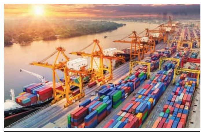
ଏପ୍ରିଲରୁ ଡିସେମ୍ବର ମଧ୍ୟରେ ୨୧୦.୭୭ ବିଲିୟନ ଡଲାରର ବାଣିଜ୍ୟିକ କ୍ଷତି

ନୂଆଦିଲ୍ଲୀ, ୧୫୧ (ଏକେଡି): ଅନ୍ତର୍ଜାତୀୟ ସ୍ତରରେ ଟଙ୍କା ମୂଲ୍ୟ ହ୍ରାସ ପାଇବାର ଲାଭିଛି। ଏହା ଦିନକୁ ଦିନ ହ୍ରାସରେ ରେକର୍ଡ କରି ଚାଲିଛି। ଏପରି ସମୟରେ ଭାରତୀୟ ଅର୍ଥନୀତିକୁ ନେଇ ଖରାପ ଖବର ଆସିଛି। ଦେଶରେ ଡିସେମ୍ବରରେ ରସ୍ତା ନିର୍ମାଣ ହ୍ରାସ ପାଇଥିବାବେଳେ ଆମଦାନୀ ବୃଦ୍ଧି ପାଇଛି। ବାଣିଜ୍ୟ କ୍ଷତି ମଧ୍ୟ ବଢ଼ିବାରେ ଲାଗିଛି। ସରକାରଙ୍କ ପକ୍ଷରୁ ଏହି ସୂଚନା ଦିଆଯାଇଛି। ଏହି ତଥ୍ୟ ଅର୍ଥନୀତି ଉପରେ ମଧ୍ୟ ଗଭୀର ପ୍ରଭାବ ପକାଇପାରେ। ସେୟାର ବଜାର ମଧ୍ୟ ହ୍ରାସ ପାଇପାରେ। ସରକାରୀ ତଥ୍ୟ ଅନୁଯାୟୀ ସମାଜିକ୍ସ ଅବଧିରେ ଦେଶର ରସ୍ତା ନିର୍ମାଣ ଏକ ପ୍ରତିଶତ ଅଧିକ ହ୍ରାସ ପାଇଛି। ଆମଦାନୀ ୫ ପ୍ରତିଶତ ଅଧିକ ବୃଦ୍ଧି ପାଇଛି। ଏହା ଦ୍ୱାରା ବାଣିଜ୍ୟ କ୍ଷତି ଆହୁରି ଅଧିକ ବୃଦ୍ଧି ପାଇଛି। ତେବେ ନଭେମ୍ବର ତୁଳନାରେ ଦେଶରେ ରସ୍ତା ନିର୍ମାଣ ହ୍ରାସ ପାଇଛି।