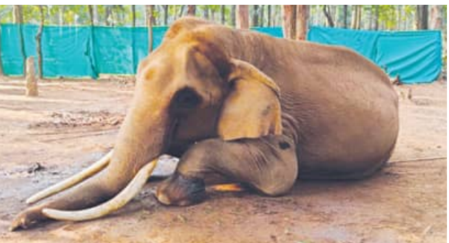
ପୋଷା ପୁଅକୁ ହରାଇ ଝୁରୁଛି ଶିମିଳିପାଳ