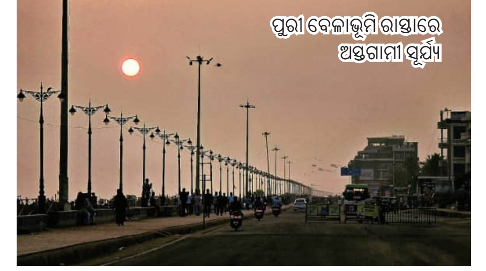
ପୁରୀ ବେଳାଭୂମି ରାସ୍ତାରେ ଅସ୍ତଗାମୀ ସୂର୍ଯ୍ୟ