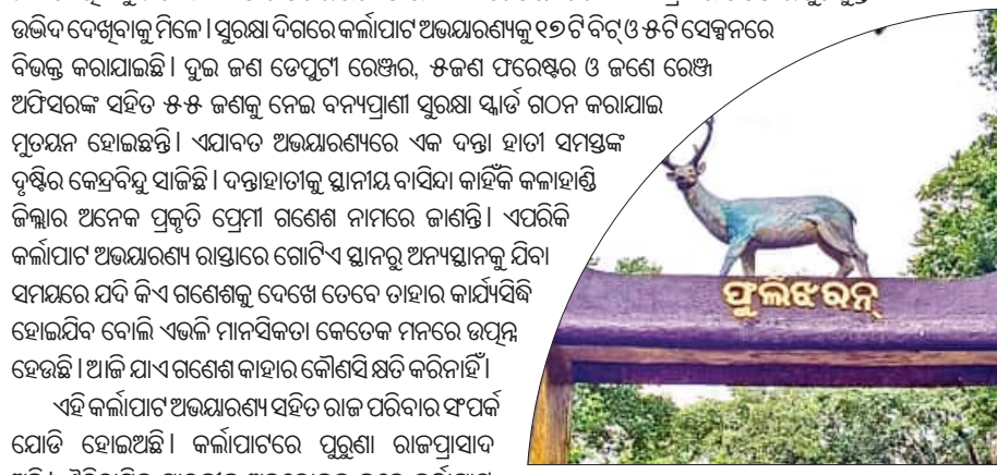
ଏହି କର୍ଲାପାଟ ଅଭୟାରଣ୍ୟ ସହିତ ରାଜ ପରିବାର ସଂପର୍କ ଯୋଡ଼ି ହୋଇଅଛି । କର୍ଲାପାଟରେ ପୁରୁଣା ରାଜପ୍ରସାଦ ଅଛି ।

ଏହି କର୍ଲାପାଟ ଅଭୟାରଣ୍ୟ ସହିତ ରାଜ ପରିବାର ସଂପର୍କ ଯୋଡ଼ି ହୋଇଅଛି । କର୍ଲାପାଟରେ ପୁରୁଣା ରାଜପ୍ରସାଦ ଅଛି । ଏତିହାସିକ ସ୍ମାରକକୁ ଅବଲୋକନ କଲେ କର୍ଲାପାଟ ଅତ୍ୟନ୍ତ ମହତ୍ତ୍ୱପୂର୍ଣ୍ଣ ଓ ଅନେକ ଉତ୍ତମ ପତନର ପୂର୍ବସାକ୍ଷୀ ରୂପେ ଏବେ ଗତିକରୁଛି । କର୍ଲାପାଟ ଅଭୟାରଣ୍ୟରେ ଜାକମ ନେତର ବ୍ୟାଞ୍ଜର ସୁବିଧା ଅଛି । ଜାକମ କାଠ ନିର୍ମିତ ବଙ୍ଗଳା ବ୍ୟତୀତ ବର୍ତ୍ତମାନ ୬ଟି କଟେଜ ନିର୍ମାଣ କରାଯାଇଛି । ଗୋଟିଏ କଟେଜରେ ୩ଜଣ ରହିପାରିବେ । ଏବଂ ୨୪ଘଣ୍ଟା ପାଇଁ ଚିପିନ ଠାରୁ ଖାଦ୍ୟପେୟ ମାଗଣାରେ ଯୋଗାଇଦିଆଯାଉଛି । ବନ ବିଭାଗ ଦାୟିତ୍ୱରେ ଥିବା କଟେଜ ଗୁଡ଼ିକ ପାଇଁ ଏକ 'ପି' ନିୟମ ରହିଛି । ଯେଉଁ ବ୍ୟକ୍ତି କଟେଜ କିଲେବେ ସେ ମାନେ କଟେଜ ପିଛା ୪୯x୫୨ ଟଙ୍କା ଦେବା ପଡ଼େ । ସମସ୍ତଙ୍କୁ ସେବାଭିତ୍ତିକ ସୁବିଧା ଉପଲବ୍ଧ ହେଲେ ଜାକମର ଗୁଣାଚଳ ମାନ ବୃଦ୍ଧି ହେବା ନିଶ୍ଚିତ । ଆଶା କର୍ଲାପାଟ ଅଭୟାରଣ୍ୟ ପର୍ଯ୍ୟଟକ ଓ ପ୍ରକୃତିପ୍ରେମୀଙ୍କୁ ପାଇଁ ପର୍ଯ୍ୟଟନ ଭିତ୍ତିକ ସ୍ତେତ୍ରରେ ଜିଲ୍ଲା କାହିଁକି ସମଗ୍ର ରାଜ୍ୟରେ ବିଶେଷ ସମ୍ପାଦନା ବହନ କରିବ ।