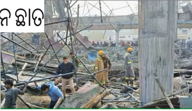
ପକ୍ଷରୁ ମଧ୍ୟ ପ୍ରତିକ୍ରିୟା ପ୍ରକାଶ ପାଇଛି। ବିଜେପି ସରକାର ଏବଂ ତତ୍କାଳୀନ କନୌଜ ସାମ୍ବନ୍ଧ ସୁଗୁଡ଼ ପାଠକ ଦାବି କରିଥିଲେ ଯେ କନୌଜର କେଳ ଷ୍ଟେସନ ଅତ୍ୟାଧୁନିକ ହେବ ଏବଂ କୋଟି କୋଟି ଟଙ୍କା ବ୍ୟୟରେ ଏହାର ଆଧୁନିକୀକରଣ କରାଯିବ। କିନ୍ତୁ ବିଜେପିର କାର୍ଯ୍ୟ ଯାହା ରହିଛି ତାହା ସମସ୍ତଙ୍କୁ ଜଣାପଡ଼ିଗଲା ବୋଲି ଦଳ ସୋସିଆଲ ମିଡିଆରେ ପୋଷ୍ଟ କରିଛି।

ଷ୍ଟେସନର ଲିଫ୍ଟିଂ ନିର୍ମାଣ କାର୍ଯ୍ୟ ଚାଲିଥିବା ସମୟରେ ଭୁସ୍କି ପଡ଼ିଥିଲା। ଏହି ସମୟରେ ବହୁ ଫାଷ୍ଟରେ ଶ୍ରମିକମାନେ ଲିଫ୍ଟିଂ ବିଛାଉଣାରେ ବ୍ୟସ୍ତ ଥିଲେ। ଫଳରେ ଅନେକ ଶ୍ରମିକ ଭଗ୍ନାଂଶ ତଳେ ଚାପି ହୋଇଯାଇଥିଲେ। ଶନିବାର ଅପରାହ୍ନ ପ୍ରାୟ ୩ଟା ବେଳେ ଏହି ଦୁର୍ଘଟଣା ଘଟିଥିଲା ବେଳେ ଭୁଗୁଣ୍ଡ ଚଳିଥିବା ଟିଏମ୍ ଦ୍ଵାରା ଉଦ୍ଧାର କାର୍ଯ୍ୟ ଆରମ୍ଭ କରାଯାଇଥିଲା। ଏହି ଘଟଣାକୁ ନେଇ ତାତ୍ପ୍ର ଉତ୍ତରଜନା ପ୍ରକାଶ ପାଇବା ପରେ ସମାଜବାଦୀ ପାର୍ଟି