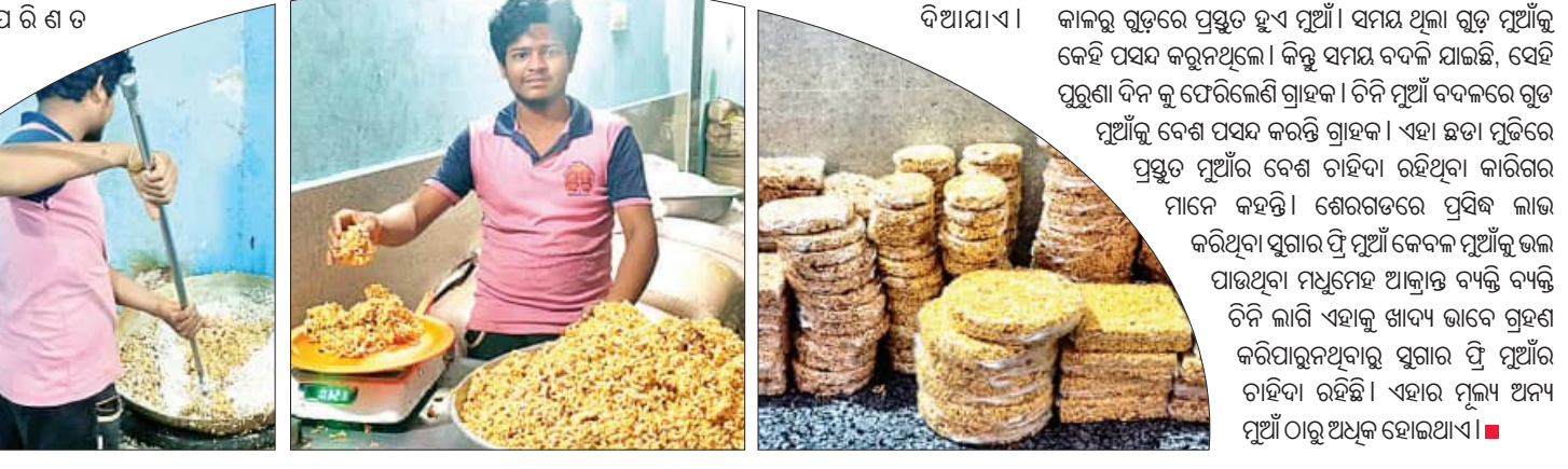
ଏହାକୁ ଧନୁରୁ ମକର : ମୁଆଁର ଆସର ହୋଇପାରିଛି । ମୁଆଁ ପ୍ରସ୍ତୁତିରେ ଲିଆ ତିନି ଘିଅ ନଡ଼ିଆ କାଳୁ ପିଠା କୁ ସକାଳ ଦିଆଯାଏ ।