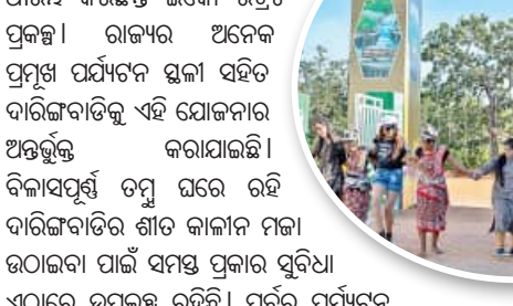
ପର୍ଯ୍ୟଟକ ଆସିଥିବା ବେଳେ ବିଦେଶୀ ପର୍ଯ୍ୟଟକଙ୍କ ସଂଖ୍ୟା ୪୯ ଥିଲା । ଚଳିତ ବର୍ଷ ପର୍ଯ୍ୟଟକଙ୍କ ସଂଖ୍ୟା ୪୯ ଥିଲା ।

ଦେଇଥାଏ ଏହି ପର୍ବତ ଶିଖର । ରାଜ୍ୟ ସରକାରଙ୍କ ପର୍ଯ୍ୟଟନ ବିଭାଗ ପକ୍ଷରୁ ମାନ୍ୟତା ମିଳିବା ପରେ ଏହି ସ୍ଥାନର ବିକାଶ ପାଇଁ ଉଦ୍ୟମ ଆରମ୍ଭ ହୋଇଛି । ପର୍ଯ୍ୟଟକଙ୍କ ପାଇଁ ନୂଆ ଠିକଣା-ଦାରିଙ୍ଗବାଡ଼ି ଇକୋ ରିଜିଟ୍ ପର୍ଯ୍ୟଟକଙ୍କୁ ଆକର୍ଷିତ କରିବା ପାଇଁ ରାଜ୍ୟ ସରକାରଙ୍କ ପର୍ଯ୍ୟଟନ ବିଭାଗ ଗତ ୪ ବର୍ଷ ହେଲା ଆରମ୍ଭ କରିଛନ୍ତି ଇକୋ ରିଜିଟ୍ ପ୍ରକଳ୍ପ । ରାଜ୍ୟର ଅନେକ ପ୍ରମୁଖ ପର୍ଯ୍ୟଟନ ସ୍ଥଳୀ ସହିତ ଦାରିଙ୍ଗବାଡ଼ିକୁ ଏହି ଯୋଜନାର ଅନ୍ତର୍ଭୁକ୍ତ କରାଯାଇଛି । ବିକାସପୂର୍ଣ୍ଣ ଚମ୍ପୁ ଘରେ ରହି ଦାରିଙ୍ଗବାଡ଼ିର ଶୀତ କାଳୀନ ମଜା ଉଠାଇବା ପାଇଁ ସମସ୍ତ ପ୍ରକାର ସୁବିଧା ଏଠାରେ ଉପଲବ୍ଧ ରହିଛି । ପୂର୍ବରୁ ପର୍ଯ୍ୟଟନ ବିଭାଗର ଜମିରେ ଅସ୍ଥାୟୀ ଚମ୍ପୁ ନିର୍ମାଣ କରି ଇକୋ ରିଜିଟ୍ ପ୍ରସ୍ତୁତ କରାଯାଉଥିବା ବେଳେ ଚଳିତ ଥର ହିଲ ଭିୟୁଛକଠାରେ ସମ୍ପୂର୍ଣ୍ଣ ନୂତନ ଶୈଳୀରେ ଏହାକୁ ନିର୍ମାଣ କରାଯାଇଛି । ତାରି