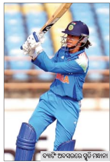
ବ୍ୟାଟି ଅବସରରେ ସୁପ୍ରିମାନ୍

ରାଜକୋଟ, ୧୦।୧ (ଏକେଡ଼ି): ଦୀର୍ଘ ୧୯ ବର୍ଷର ବ୍ୟବଧାନ ପରେ ଭାରତ ଓ ଆୟର୍ଲାଣ୍ଡ ମହିଳା କ୍ରିକେଟ୍ ଦଳ ମଧ୍ୟରେ ଆୟର୍ଲାଣ୍ଡ ଏକଦିବସୀୟ ସିରିଜ ଆରମ୍ଭ ହୋଇଛି। ଶୁକ୍ରବାର ଏଠାରେ ଖେଳାଯାଇଥିବା ପ୍ରଥମ ଏକଦିବସୀୟ ମ୍ୟାଚ୍ରେ ଘରୋଇ ଭାରତୀୟ ମହିଳା କ୍ରିକେଟ୍ ଦଳ ୬ ଓଭରରେ ଆୟର୍ଲାଣ୍ଡକୁ ପରାସ୍ତ କରିଛି। ପଞ୍ଚମେ ଶା ମ୍ୟାଚ୍ ବିଶିଷ୍ଟ ସିରିଜରେ ଭାରତ ୧-୦ରେ ଅଗ୍ରଣୀ ହାସଲ କରିଛି। ସିରିଜର ଶେଷ ଦୁଇ ମ୍ୟାଚ୍ ଜାନୁଆରୀ ୧୨ ଓ ୧୫ ଏଠାରେ ଖେଳାଯିବ।