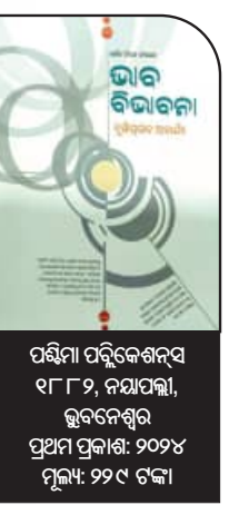
ପଞ୍ଜିନୀ ପରିକେଶନସ୍ ୧୮୮୨, ନୟାପଲ୍ଲୀ, ଭୁବନେଶ୍ଵର ପ୍ରଥମ ପ୍ରକାଶ: ୨୦୨୪ ମୂଲ୍ୟ: ୨୨୯ ଟଙ୍କା