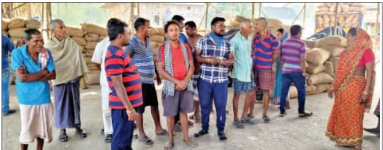
ଧାନ ବସ୍ତା ଓଜନ ପାଇଁ ଦେବାକୁ ପଡ଼ୁଛି ଚାରି ଟଙ୍କା

■ ଭଦ୍ରକ/ବାସୁଦେବପୁର, ୧୮।୧ (ସମ୍ପାଦକ): ଭଦ୍ରକ ଜିଲ୍ଲାର ବିଭିନ୍ନ ମଣ୍ଡିରେ ଧାନବିକ୍ରିକୁ ନେଇ ଅସନ୍ତୋଷ ଦେଖାଦେଇଛି। ମଣ୍ଡିରେ ଧାନ ବସ୍ତା ଓଜନ ପାଇଁ ୪ ଟଙ୍କା ଦେବାକୁ ପଡ଼ୁଥିବା ବେଳେ ସାଡ଼େ ୮ ରୁ ୧୦ ପର୍ଯ୍ୟନ୍ତ କର୍ମଚାରୀଙ୍କୁ ନେଇ ଉତ୍ତେଜନା ପ୍ରକାଶ ପାଇଛି। ପକ୍ଷରେ କେଉଁଠି ଚାଷୀ ଧାନ ବିକ୍ରି ବନ୍ଦ କରିଦେଇଥିବା ବେଳେ ଆଉ କେଉଁଠି ସୋସାଇଟି ଧାନ ନ କିଣି ଚାଷୀଙ୍କୁ ହଇରାଣ କରୁଥିବା ଅଭିଯୋଗ ହୋଇଛି।