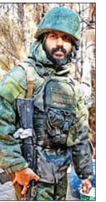
ଏମାନଙ୍କ ମଧ୍ୟରୁ ୯୨ ଜଣ ଭାରତ ଫେରି ଆସିଲେଣି । ଆଉ ୧୮ ଜଣ ରୁଷ୍ରେ ପଶି ରହିଛନ୍ତି । ଏମାନଙ୍କ ମଧ୍ୟରୁ ୧୨ ଜଣ ନିଖୋଜ ଅଛନ୍ତି । ତାଙ୍କର କୌଣସି ଖୋଜଖବର ମିଳିପାରି ନାହିଁ । ଏହି ନାଗରିକଙ୍କୁ ଫେରାଇ ଆଣିବା ଲାଗି ପ୍ରୟାସ କରାଯାଇଛି । ୨୦୨୨ ଫେବୃଆରୀ ୨୪ରୁ ରୁଷ୍-ୟୁକ୍ଲେନ ଯୁଦ୍ଧ ଜାରି ରହିଛି । ଯୁକ୍ଲେନ ଆକ୍ରମଣରେ ରୁଷ୍ ସେନାରେ ସାମିଲ ହୋଇଥିବା ସୂଚନା ମିଳିଛି ।

ନୂଆଦିଲ୍ଲୀ, ୧୭୧୧ (ଏକେନ୍ଦ୍ର): ଯୁକ୍ଲେନରେ ରୁଷ୍ ଆକ୍ରମଣକୁ ଏ ପର୍ଯ୍ୟନ୍ତ ଭାରତ ବିରୋଧ କରିନାହିଁ । ଏଥିପାଇଁ ଆମେରିକା ଭଳି ଯୁଦ୍ଧୋପାୟ ରାଷ୍ଟ୍ର ଭାରତ ଉପରେ ତାପ ପକାଇ ଚାଲିଛନ୍ତି । ଏହା ସତ୍ତ୍ୱେ ଭାରତ ରୁଷ୍ଟକୁ ସମର୍ଥନ ଦେଇଚାଲିଛି । ଆମେରିକା କଟକଣା ଲଗାଇଥିବାବେଳେ ଭାରତ ରୁଷ୍ଟରୁ ଅଶୋଧିତ ଟିକ ଆଣୁଛି । ମାତ୍ର ବହୁ ରାଷ୍ଟ୍ର ରୁଷ୍ ଭାରତକୁ ଧୋକା ଦେଇ ଭାରତୀୟଙ୍କୁ ଯୁଦ୍ଧରେ ସାମିଲ କରୁଛି । ବିଭିନ୍ନ କମ୍ପାନୀ ମାଧ୍ୟମରେ ଅଧିକ ଦରମାର ଲୋଭ ଦେଖାଇ ଭାରତୀୟଙ୍କୁ ରୁଷ୍ ସେନାରେ ସାମିଲ କରାଯାଇଛି । ଭାରତର ପ୍ରତିବାଦ ସତ୍ତ୍ୱେ ଏ ପର୍ଯ୍ୟନ୍ତ ରୁଷ୍ ସମସ୍ତ ଭାରତୀୟ ନାଗରିକଙ୍କୁ ଛାଡ଼ି ନାହିଁ । ନିଜ ସେନାରେ ସାମିଲ ଭାରତୀୟଙ୍କୁ ଯୁକ୍ଲେନ ସହ ସମ୍ମୁଖ ଯୁଦ୍ଧରେ ଲଢ଼ିବା ପାଇଁ ବାଧ୍ୟ କରାଯାଇଛି । ଏ ପର୍ଯ୍ୟନ୍ତ ରୁଷ୍ ପାଇଁ ଲଢ଼ି ୧୨ ଭାରତୀୟ ନାଗରିକ ଯୁକ୍ଲେନରେ ପ୍ରାଣ ହରାଇଲେଣି ବୋଲି ବୈଦେଶିକ ମନ୍ତ୍ରାଳୟ ପକ୍ଷରୁ କୁହାଯାଇଛି ।