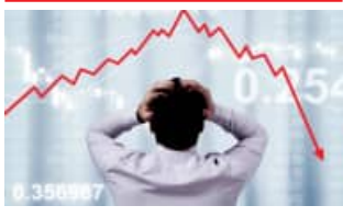
ଦିନକରେ ୧୦୪୮ ପଏଣ୍ଟ ଖସିଲା ସେକ୍ସେକ୍ସ ୪ ଦିନରେ ନିବେଶକଙ୍କ ୨୫ ଲକ୍ଷ କୋଟି କ୍ଷତି

■ ପୁରୀ, ୧୩ (ସମ୍ବାଦ): ଅସ୍ଥିର ଘରୋଇ ସେୟାର ବଜାର। କୁମ୍ଭାଗତ ଭାବେ ୪ ଦିନ ଧରି ଚଳୁଥିବା ହେବାରେ ଲାଗିଛି ଭାରତୀୟ ପୁଞ୍ଜି ବଜାର। ସୋମବାର ଏଥିରେ ପୁଣିଥରେ ବଡ଼ଧରଣର ହ୍ରାସ ଘଟିଛି। ଆଜିର କାରବାରରେ ବମ୍ବେ ସ୍ୱଚ୍ଛ ଏକ୍ସଚେଞ୍ଜ (ବିଏସ୍‌ଏକ୍ସ) ସେନସେକ୍ସରେ ୧୦୪୮ ପଏଣ୍ଟ ଏବଂ ନ୍ୟାସନାଲ୍ ସ୍ୱଚ୍ଛ ଏକ୍ସଚେଞ୍ଜ (ନିପ୍ସି)ରେ ୩୪୫ ପଏଣ୍ଟ ହ୍ରାସ ଘଟି ୨୪,୧୮୮.୬୫ ପଏଣ୍ଟ ସ୍ତରରେ ବନ୍ଦ ହୋଇଛି। ସେୟାର ବଜାରରେ ଏଭଳି ୪ ଦିନର ଲଗାତାର ହ୍ରାସ ଯୋଗୁଁ