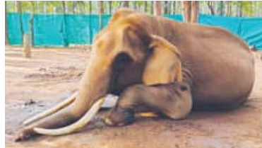
ଯୋଷା ପୁଅକୁ ହରାଇ ଝୁରୁଛି ଶିମିଳିପାଳ

■ ବାରିପଦା, ୧୩ (ସମ୍ବାଦ): ଶିମିଳିପାଳର ଯୋଷା ହାତୀ ମହେନ୍ଦ୍ରର ରବିବାର ରାତି ସାଙ୍ଗେ ୧୦ ଟାରେ ଚହଲାଇବାରେ ମୃତ୍ୟୁ ଘଟିଛି। ତାକୁ ୬୬ ବର୍ଷ ହୋଇଥିଲା। ବୟସାଧିକ୍ୟ କାରଣରୁ ନିକଟରେ ମହେନ୍ଦ୍ର ଅସୁସ୍ଥ ହୋଇ ପଡ଼ିଥିଲା। ଦୁଇଦିନ ଧରି ସେ ଖାଦ୍ୟ ଗ୍ରହଣ କରୁନଥିଲା। ତାକୁ ଶିମିଳିପାଳ ଉତ୍ତର ବନଖଣ୍ଡର ଚହଲାଇବାରେ ରଖି ଚିକିତ୍ସା କରାଯାଉଥିଲା। ଗତରାତିରେ ସେଠାରେ ତା'ର ମୃତ୍ୟୁ ଘଟିଛି। ଶିମିଳିପାଳ ବ୍ୟାଘ୍ର ଅଞ୍ଚଳର ପ୍ରକଳ୍ପର ଭାରପ୍ରାପ୍ତ କ୍ଷେତ୍ର ନିର୍ଦ୍ଦେଶକ ତଥା ବାରିପଦା ମଣ୍ଡଳର ଆଞ୍ଚଳିକ ମୁଖ୍ୟ ବନଅଞ୍ଚଳକ ତଃ ।►ପୃଷ୍ଠା-୭