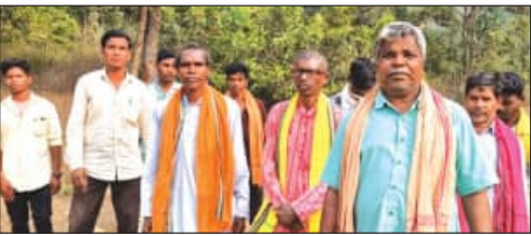
ଭୋଜିଭାତ ଦେଲେ ସମାଜରେ ମିଶିବେ

ଏହାସହ, ସମାଜକୁ ଭୋଜିଭାତ ଦେଇ ମୁଣ୍ଡନ ହେଲେ ଯାଇ ସେମାନଙ୍କୁ ପୁଣିଥରେ ସାମିଲ କରାଯିବ ବୋଲି କୁହାଯାଇଛି।