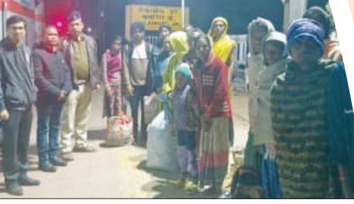
ଘରେ ଛାଡ଼ିଲା ଜିଲ୍ଲା ଶ୍ରମ ବିଭାଗ

ଶରଣା, ୧୯ ଡିସେମ୍ବର: ଡେଲଟାନାର ଏକ ଲଟାଭାରି ନିୟୋଜିତ ଶ୍ରମିକଙ୍କୁ ଉଦ୍ଧାର କରାଯାଇଛି । କଣ୍ଠାମାଳ ବ୍ଲକ୍ ବ୍ଲକ୍ ମହଲ ପଞ୍ଚାୟତ ଶ୍ରମିଆ ଗ୍ରାମରୁ ଡେଲଟାନାରେ କାମ କରୁଥିବା ୧୫ ଜଣ ଶ୍ରମିକଙ୍କୁ ଉଦ୍ଧାର କରାଯାଇଛି । ବୌଦ୍ଧ ଜିଲ୍ଲା ଶ୍ରମ ବିଭାଗ ସେମାନଙ୍କୁ ଉଦ୍ଧାର ପରେ ନିଜ ଘରେ ହାତରି । ବକାଳଗର ୩ ଜଣ ଶ୍ରମିକ ଦଳାଳଙ୍କ କଣ୍ଠାରେ ଏମାନେ ସେଠାକୁ ଯାଇଥିଲେ । ଲଟା ଭାଟି ମାଲିକ ନିର୍ଯାତନା ଦେଉଥିବା ଅଭିଯୋଗ ପରେ ଜିଲ୍ଲା ଶ୍ରମ କାର୍ଯ୍ୟାଳୟ ଓ ଜିଲ୍ଲା ପ୍ରଶାସନର ମିଳିତ ଉଦ୍ୟମରେ ଉଦ୍ଧାର କରାଯାଇଛି । ପ୍ରାଥମିକ ଉଦ୍ୟମ କ୍ରମେ ସେମାନଙ୍କୁ ଚୋରା ଯୋଗେ ଅଣାଯାଇଥିଲା । ସମସ୍ତେ ବକାଳଗର ରେଳ ଷ୍ଟେସନରେ ପହଞ୍ଚି ଥିଲେ । ଏହାପରେ ଜିଲ୍ଲା ଶ୍ରମ ବିଭାଗ ସେଠାରୁ ସେମାନଙ୍କୁ ଶୁଳ୍କିଆ ଗ୍ରାମରେ ନେଇ ହାତରି ।