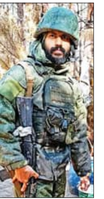
ଏମାନଙ୍କ ମଧ୍ୟରୁ ୯୨ ଜଣ ଭାରତ ଫେରି ଆସିଲେଣି । ଆଉ ୧୮ ଜଣ ରୁଷ୍ରେ ପଶି ରହିଛନ୍ତି । ଏମାନଙ୍କ ମଧ୍ୟରୁ ୧୨ ଜଣ ନିଖୋଜ ଅଛନ୍ତି । ତାଙ୍କର କୌଣସି ଖୋଜଖବର ମିଳିପାରି ନାହିଁ । ଏହି ନାଗରିକଙ୍କୁ ଫେରାଇ ଆଣିବା ଲାଗି ପ୍ରୟାସ କରାଯାଇଛି । ୨୦୨୨ ଫେବୃଆରୀ ୨୪ରୁ ରୁଷ୍-ୟୁକ୍ଲେନ ଯୁଦ୍ଧ ଜାରି ରହିଛି । ଯୁକ୍ଲେନ ଆକ୍ରମଣରେ ରୁଷ୍ ଅନେକ ଯବାନ ପ୍ରାଣ ହରାଇଛନ୍ତି । ତେଣୁ ଏହି କ୍ଷତି

ନୂଆଦିଲ୍ଲୀ, ୧୨୧୧ (ଏକେନ୍ଦ୍ର): ଯୁକ୍ଲେନରେ ରୁଷ୍ ଆକ୍ରମଣକୁ ଏ ପର୍ଯ୍ୟନ୍ତ ଭାରତ ବିରୋଧ କରିନାହିଁ । ଏଥିପାଇଁ ଆମେରିକା ଭଳି ଯୁଦ୍ଧୋପାୟ ରାଷ୍ଟ୍ର ଭାରତ ଉପରେ ତାପ ପକାଇ ଚାଲିଛନ୍ତି । ଏହା ସତ୍ତ୍ଵେ ଭାରତ ରୁଷ୍ଟକୁ ସମର୍ଥନ ଦେଇଚାଲିଛି । ଆମେରିକା କଟକଣା ଲଗାଇଥିବାବେଳେ ଭାରତ ରୁଷ୍ଟରୁ ଅଣୋଧିକ ଟିକି ଆଣୁଛି । ମାତ୍ର ବହୁ ରାଷ୍ଟ୍ର ରୁଷ୍ ଭାରତକୁ ଧୋକା ଦେଇ ଭାରତୀୟଙ୍କୁ ଯୁଦ୍ଧରେ ସାମିଲ କରୁଛି । ବିଭିନ୍ନ କମ୍ପାନୀ ମାଧ୍ୟମରେ ଅଧିକ ଦରମାର ଲୋଭ ଦେଖାଇ ଭାରତୀୟଙ୍କୁ ରୁଷ୍ ସେନାରେ ସାମିଲ କରାଯାଇଛି । ଭାରତର ପ୍ରତିବାଦ ସତ୍ତ୍ଵେ ଏ ପର୍ଯ୍ୟନ୍ତ ରୁଷ୍ ସମସ୍ତ ଭାରତୀୟ ନାଗରିକଙ୍କୁ ଛାଡ଼ି ନାହିଁ । ନିଜ ସେନାରେ ସାମିଲ ଭାରତୀୟଙ୍କୁ ଯୁକ୍ଲେନ ସହ ସମ୍ମୁଖ ଯୁଦ୍ଧରେ ଲଢ଼ିବା ପାଇଁ ବାଧ୍ୟ କରାଯାଇଛି । ଏ ପର୍ଯ୍ୟନ୍ତ ରୁଷ୍ ପାଇଁ ଲଢ଼ି ୧୨ ଭାରତୀୟ ନାଗରିକ ଯୁକ୍ଲେନରେ ପ୍ରାଣ ହରାଇଲେଣି ବୋଲି ବୈଦେଶିକ ମନ୍ତ୍ରାଳୟ ପକ୍ଷରୁ କୁହାଯାଇଛି ।