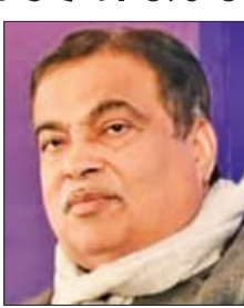
ଦୁର୍ଘଟଣା ପାଇଁ ଠିକାଦାର, ଇଞ୍ଜିନିୟରଙ୍କୁ ଦାୟା କରି ଜେଲ୍ ପଠାଇବା ଆବଶ୍ୟକ

ନୂଆଦିଲ୍ଲୀ, ୧୨୧୧ (ଏକେନ୍ଦ୍ର): ଖରାପ ରାସ୍ତା ନିର୍ମାଣକୁ ଜାମିନ ବିହୀନ ଅପରାଧ ଶ୍ରେଣୀଭୁକ୍ତ କରାଯିବାର ଉଚିତ । ସଡ଼କ ଦୁର୍ଘଟଣା ପାଇଁ ରାସ୍ତାର ଠିକାଦାର ଏବଂ ଇଞ୍ଜିନିୟରଙ୍କୁ ଦାୟା କରାଯିବା ଆବଶ୍ୟକ । ଏମାନଙ୍କୁ ଜେଲ୍ ପଠାଯିବାର ଉଚିତ ବୋଲି କେନ୍ଦ୍ର ସଡ଼କ ପରିବହନମନ୍ତ୍ରୀ ନିତିନ ଗଡ଼କରା କହିଛନ୍ତି । ସେ ଗୁରୁବାର ସିଆଇଆଇ ପକ୍ଷରୁ ଆୟୋଜିତ ଏକ କାର୍ଯ୍ୟକ୍ରମରେ ଏହି ମନ୍ତବ୍ୟ ଦେଇଥିଲେ । ଗତକରାଜ କହିଥିଲେ ଯେ ସଡ଼କ ଦୁର୍ଘଟଣାରେ ଭାରତ ବିଶ୍ଵରେ ଏକ ନମୁନା ସ୍ଥାନରେ ରହିଛି । ୨୦୩୦ ବୁଝା ସଡ଼କ ଦୁର୍ଘଟଣାରେ ପ୍ରାଣ ହରାଇଥିବା ଲୋକଙ୍କ ସଂଖ୍ୟା ଅଧା କରିବାକୁ ସରକାର ଲକ୍ଷ୍ୟ ରଖିଛନ୍ତି । ମହାଲକ୍ଷ୍ମର ତଥ୍ୟ ଅନୁଯାୟୀ ୨୦୨୩ରେ ୫ ଲକ୍ଷ ସଡ଼କ ଦୁର୍ଘଟଣା ହୋଇଥିଲା । ଏଥିରେ ୧.୨୬ ଲକ୍ଷ ଲୋକଙ୍କ ଜୀବନ ଯାଇଥିଲା । ଏଥିରୁ ୬୪ ପ୍ରତିଶତ ଅର୍ଥାତ୍ ୧୧୫ ଲକ୍ଷ ଲୋକ ୧୮ ରୁ ୪୫ ବର୍ଷର ଥିଲେ । ୧୦ ହଜାର ଶିଶୁ ମଧ୍ୟ ସାମିଲ ରହିଥିଲେ । ହେଲମେଟ୍ ନ ପିନ୍ଧିବା କାରଣରୁ ୫୫ ହଜାର ଏବଂ ସିଟ୍ ବେଲ୍ଟ ନ ଲଗାଇ ଥିବାରୁ ୩୦ ହଜାର ପ୍ରାଣ ହରାଇ ଥିଲେ । ଗତକରାଜ କହିଛନ୍ତି ଯେ ହାଇବେରେ ଥିବା ହ୍ଵାକ୍ ସ୍ପଟ୍ (ଦୁର୍ଘଟଣା ପ୍ରବଣ ଅଞ୍ଚଳ) ହରାଇବାକୁ ୪୦ ହଜାର କୋଟି ଟଙ୍କା ଖର୍ଚ୍ଚ କରୁଛି । ସରକାରଙ୍କ ସହ ମିଶି ଡ୍ରାଇଭର ପ୍ରଶିକ୍ଷଣ ଏବଂ ଫିଟ୍ନେସ୍ ସେକ୍ଟର ନିର୍ମାଣ କରିବାକୁ ସେ ଏହି କ୍ଷେତ୍ର ଅନ୍ୟ ଅଂଶଧାରକମାନଙ୍କୁ ନିବେଦନ କରିଛନ୍ତି । ଏହା ଦ୍ଵାରା ଡ୍ରାଇଭର ଅଭାବକୁ ହ୍ରାସ କରାଯାଇପାରିବ ।