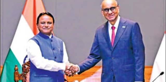
ବିକଶିତ ଓଡ଼ିଶା ପାଇଁ ମାର୍ଗ ପ୍ରଶସ୍ତ ହେବ: ମୁଖ୍ୟମନ୍ତ୍ରୀ ଶ୍ରୀ ଶନ୍ ମୁଗରତ୍ନ ଉଲ୍ଲେଖ କରି ଏକ ସୁଦକ୍ଷ ଓଡ଼ିଶା ଗଠନ ପାଇଁ ଏହା ବଳ ଯୋଗାଇବ ବୋଲି କହିଛନ୍ତି। ଆମେ ଯୋଗାଣ ବୋଲି କହିଛନ୍ତି। ମୁଖ୍ୟମନ୍ତ୍ରୀ ଦାୟିତ୍ୱ ଧରି ଏହି ରାଜ୍ୟ ସହିତ କାର୍ଯ୍ୟ କରି ଆସୁଛୁ ଓ ଏହି ସମ୍ପର୍କକୁ ଆହୁରି ଆଗକୁ ବଢ଼ାଇବା ଆମ ପାଇଁ ଗୌରବର ବିଷୟ ବୋଲି ସେ କହିଛନ୍ତି। ମୁଖ୍ୟମନ୍ତ୍ରୀ ମୋହନ ଚରଣ ମାଘା

■ ଭୁବନେଶ୍ୱର, ୧୭୧ (ସମିସ): ଓଡ଼ିଶାରେ ଦକ୍ଷତା ବିକାଶ କ୍ଷେତ୍ରରେ ୬ ବର୍ଷ ଧରି ସହଯୋଗ କରି ଆସୁଥିବା ସିଙ୍ଗାପୁର ଏହି ଧାରାକୁ ବଜାୟ ରଖିବାର ପ୍ରତିଶ୍ରୁତିକୁ ପୂର୍ଣ୍ଣ ବୋଧହୋଇଛି। ଏକ ସମ୍ପୂର୍ଣ୍ଣ ଓଡ଼ିଶା ଗଠନରେ ପୂର୍ଣ୍ଣ ସ୍ଥିରାକୃତ ଲକ୍ଷ୍ୟ ହାସଲ ଦିଗରେ ସିଙ୍ଗାପୁର ସରକାରଙ୍କ ଯୋଗଦାନକୁ ସ୍ୱୀକୃତି ମିଳିଛି। ଏହିକ୍ରମରେ ଶୁକ୍ରବାର ବିଶ୍ୱ ଦକ୍ଷତା କେନ୍ଦ୍ର ପରିସରରେ ସିଙ୍ଗାପୁର ରାଷ୍ଟ୍ରପତି ଅର୍ପିନ୍ ଶର୍ମାଙ୍କୁ ଉପସ୍ଥିତରେ ଓଡ଼ିଶା ଓ ସିଙ୍ଗାପୁର ସରକାରଙ୍କ ମଧ୍ୟରେ ୮ଟି ଗୁରୁତ୍ୱପୂର୍ଣ୍ଣ ସ୍ମୃତି ସ୍ୱାକ୍ଷର ହୋଇଛି। ଓଡ଼ିଶାରେ ସ୍ଥାପନ ହୋଇଥିବା ବିଶ୍ୱସ୍ତରାୟ ଭିତ୍ତିଭୂମି ବାସ୍ତବରେ ଅତ୍ୟୁତ୍ତମ ବୋଲି