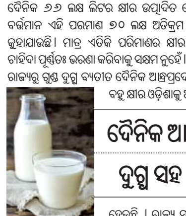
ଦୈନିକ ଆବଶ୍ୟକ ହେବ ୧୦.୪ ଲକ୍ଷ ଲିଟର ଦୁଗ୍ଧ ଦୁଗ୍ଧ ସହ ଅଣ୍ଡା ମିଳିବ କି ନାହିଁ ହୋଇନି ନିଷ୍ପତ୍ତି