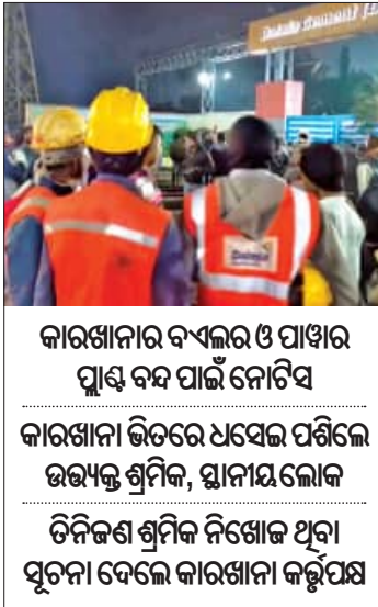
କାରଖାନାର ବ୍ୟବହାର ଓ ପାଖର ପୁଣି ବନ୍ଦ ପାଇଁ ନୋଟିସ କାରଖାନା ଭିତରେ ଧସେଇ ପଶିଲେ ଉତ୍ତମ ଶ୍ରମିକ, ସ୍ଥାନୀୟ ଲୋକ ତିନିଜଣ ଶ୍ରମିକ ନିଖୋଜ ଥିବା ସୂଚନା ଦେଲେ କାରଖାନା କର୍ତ୍ତୃପକ୍ଷ

■ ରାଉରକେଲା, ୧୭୧ (ସମିସ): ଗତକାଳି ରାଜଗାଙ୍ଗପୁରସ୍ଥିତ ଡାଲମିଆ ସିମେଣ୍ଟ କାରଖାନାର କୋଇଲା ବନ୍ଦର ଧସିବା ଘଟଣାର ୩୦ ଘଣ୍ଟା ବିତିଛି। ମାତ୍ର ଏହି ଘଟଣାରେ ବାସ୍ତବରେ କେତେ ଲୋକ ମୃତ୍ୟୁ ହୋଇଛନ୍ତି, ତାହା ବିସ୍ତୃତ ତଥ୍ୟ ମିଳିନାହିଁ। କାରଖାନା କର୍ତ୍ତୃପକ୍ଷ କୋଇଲା ହପର ଭୁଣ୍ଡାଡ଼ିବା ଘଟଣାରେ ୩ ଜଣ ନିଖୋଜ ଥିବା ସୂଚନା ଦେଉଥିବାବେଳେ ବାସ୍ତବରେ କେତେଜଣ ନିଖୋଜ ହୋଇଛନ୍ତି, ତାହାର ପୂର୍ଣ୍ଣାଙ୍ଗ ତଥ୍ୟ ମିଳିପାରିନାହିଁ। ଅନ୍ୟପକ୍ଷରେ ଦୁର୍ଘଟଣା ବେଳେ ଅନେକ ଶ୍ରମିକ କାମ କରୁଥିଲେ ଓ ସେମାନଙ୍କ ପତ୍ନୀ ମିଳୁନାହିଁ ବୋଲି ଶ୍ରମିକ ସଙ୍ଗଠନ ଓ ସ୍ଥାନୀୟ ଲୋକମାନେ ଅଭିଯୋଗ କରିଛନ୍ତି। ଇତିମଧ୍ୟରେ ସ୍ଥାନୀୟ ପ୍ରଶାସନ କାରଖାନାର ବ୍ୟବହାର ଓ ପାଖର ପୁଣି ବନ୍ଦ କରିବାକୁ ନୋଟିସ ଜାରି କରିଛନ୍ତି। ଏହା ସତ୍ତ୍ୱେ କାରଖାନା ବିରୋଧରେ ଲୋକଙ୍କ ରୋଷ କମିନାହିଁ। ଉତ୍ତମ ଲୋକମାନେ କାରଖାନା ଭିତରକୁ ଧସେଇ ପଶି ନିଜ ସମ୍ପର୍କୀୟ ଓ ସାଥୀ ଶ୍ରମିକମାନଙ୍କୁ ଖୋଜିବାକୁ ଉଦ୍ୟମ କରିଛନ୍ତି।