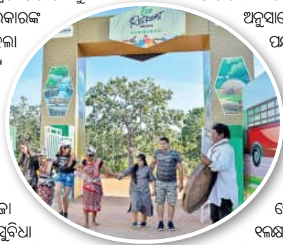
ପର୍ଯ୍ୟଟନ ବିଭାଗ ଗତ ୪ ବର୍ଷ ହେଲା ଆରମ୍ଭ କରିଛନ୍ତି ଇକୋ ରିଜିଟ୍ ପ୍ରକଳ୍ପ । ରାଜ୍ୟର ଅନେକ ପ୍ରମୁଖ ପର୍ଯ୍ୟଟନ ସ୍ଥଳୀ ସହିତ ଦାରିଙ୍ଗବାଡ଼ିକୁ ଏହି ଯୋଜନାର ଅନ୍ତର୍ଭୁକ୍ତ କରାଯାଇଛି । ବିକାସପୂର୍ଣ୍ଣ ତମ୍ପୁରରେ ରହି ଦାରିଙ୍ଗବାଡ଼ିର ଶୀତ କାଳୀନ ମଜା ଉଠାଇବା ପାଇଁ ସମସ୍ତ ପ୍ରକାର ସୁବିଧା ଏଠାରେ ଉପଲବ୍ଧ ରହିଛି । ପୂର୍ବରୁ ପର୍ଯ୍ୟଟନ ବିଭାଗର ଜମିରେ ଅସ୍ଥାୟୀ ତମ୍ପୁ ନିର୍ମାଣ କରି ଇକୋ ରିଜିଟ୍ ପ୍ରସ୍ତୁତ କରାଯାଉଥିବା ବେଳେ ଚଳିତ ଥର ହିଲ ଭିଲ୍ଡିଂ କଠାରେ ସମ୍ପୂର୍ଣ୍ଣ ନୂତନ ଶୈଳୀରେ ଏହାକୁ ନିର୍ମାଣ କରାଯାଇଛି । ତାରି

ଏସବୁ ସର୍ବୋତ୍ତମ କନ୍ଧମାଳ ଜିଲ୍ଲା ପର୍ଯ୍ୟଟକଙ୍କ ଆଗମନ ଆଶାଜନକ ହେଉନାହିଁ । ପର୍ଯ୍ୟଟନ ବିଭାଗ ତଥ୍ୟ ଅନୁସାରେ, କନ୍ଧମାଳକୁ ୨୦୨୧ ରେ ଘରୋଇ ପର୍ଯ୍ୟଟନ ୬୦୫୬୮୦ ଟଙ୍କା ଶହ ୫୯ ଲକ୍ଷ ଆସିଥିବା ବେଳେ କେହି ବି ବିଦେଶୀ ପର୍ଯ୍ୟଟକ ଆସିନାହାନ୍ତି । ୨୦୨୨ ପର୍ଯ୍ୟଟନ ଋତୁରେ ମାତ୍ର ୫୫୫୬୮୦ ଟଙ୍କା ଶହ ୧୭ ଲକ୍ଷ ୧୦ ଲକ୍ଷ ଘରୋଇ ପର୍ଯ୍ୟଟକ ଆସିଥିବା ବେଳେ ବିଦେଶୀ ପର୍ଯ୍ୟଟକଙ୍କ ସଂଖ୍ୟା ଶୂନ୍ୟ ଥିଲା । ସେହିପରି ୨୦୨୩ ପର୍ଯ୍ୟଟନ ଋତୁରେ ୧୯୯୯୯୯୯୯ ଟଙ୍କା ଶହ ୯୯ ଲକ୍ଷ ଘରୋଇ ପର୍ଯ୍ୟଟକ ଆସିଥିବା ବେଳେ ବିଦେଶୀ ପର୍ଯ୍ୟଟକଙ୍କ ସଂଖ୍ୟା ୪୯ ଥିଲା । ଚଳିତ ବର୍ଷ ପର୍ଯ୍ୟଟକଙ୍କ ସଂଖ୍ୟା ୪୯ ଥିଲା । ଚଳିତ ବର୍ଷ ପର୍ଯ୍ୟଟକଙ୍କ ସଂଖ୍ୟା ବଢ଼ିବ ବୋଲି ଅନୁମାନ କରାଯାଇଛି । ଶୀତର ପ୍ରକାଶ ବର୍ତ୍ତମାନ ସହ ପର୍ଯ୍ୟଟକଙ୍କ ଆଗମନ ମଧ୍ୟ ବଢ଼ିବ ବୋଲି କୁହାଯାଉଛି ।