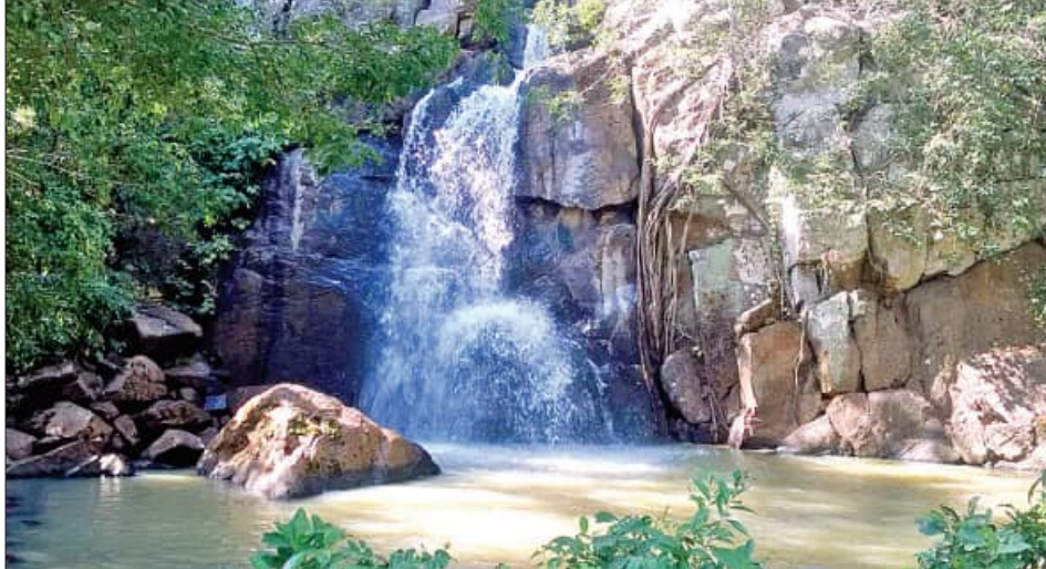
ପୁଲବାଣୀ ସହରଠାରୁ ୨୦ କିଲୋମିଟର ଦୂରରେ ପୁରୁଡ଼ି ଜଳପ୍ରପାତ ଓ ୨୫ କିଲୋମିଟର ଦୂରରେ ରହିଛି ପକଡ଼ାଝର ଜଳ ପ୍ରପାତ । ପୁଲବାଣୀ ବୁଲର ଉର୍ଦ୍ଧାଗତ ଓ କାନ୍ଥାମାଳା ଜଳପ୍ରପାତ, କୋଟଗଡ଼ ବୁକର କୁହୁ ଜଳପ୍ରପାତ, ରାଜକିଆର ଜୈବ ବିବିଧ ଅଞ୍ଚଳ ମଣ୍ଡାସରୁ କୁଟି ଭଳି ରହିଛି ଅନେକ ପର୍ଯ୍ୟଟନ ସ୍ଥଳୀ ରହିଛି । ଏବେ କନ୍ଧମାଳ ଜିଲ୍ଲା ପର୍ଯ୍ୟଟନ ମାନଚିତ୍ରରେ ନୂଆ କରି ଯୋଡ଼ି ହୋଇଛି ଜି.ଉପରଗିରିର କାଲିଗାଡ଼ ହିଲ୍‌ଟପ । ପ୍ରକୃତିର ନୈସର୍ଗିକ ସୌନ୍ଦର୍ଯ୍ୟ ଉପଭୋଗ କରିବାର ଏକ ଅନନ୍ୟ ଅନୁଭୂତି

କନ୍ଧମାଳ ଜିଲ୍ଲାର ପର୍ଯ୍ୟଟନ ସ୍ଥଳୀ ସ୍ତୃତିକ ମଧ୍ୟରେ ସର୍ବାଗ୍ରେ ଆସେ ଓଡ଼ିଶାର କାଶ୍ମୀର ଭାବେ ପରିଚିତ ଦାରିଙ୍ଗବାଡ଼ି । ଏଠାକୁ ବର୍ଷ ତମାମ ଦେଶ ଓ ବିଦେଶରୁ ପର୍ଯ୍ୟଟକ ଆସୁଥିଲେ ବି ଶୀତଋତୁରେ ଏହାର ସଂଖ୍ୟା ବହୁଗୁଣିତ ହୋଇଥାଏ । ଦାରିଙ୍ଗବାଡ଼ିରେ କଠି ଗାଡ଼େନ, ହିଲ ପଏଣ୍ଟ, ପାଲନ ପରେଷ୍ଟ ଓ ଗ୍ରୀନ୍‌ବାଡ଼ି ସରସେଟ୍ ପଏଣ୍ଟ, ମିଡ଼ିୟୁମ୍‌ସାଇଜ୍ ଜଳପ୍ରପାତ ଭଳି ରହିଛି ବହୁ ପର୍ଯ୍ୟଟନ ସ୍ଥଳୀ । ହିଲଭିୟୁ ପଏଣ୍ଟରୁ ଉତ୍ତାରପାତ ଅନୁଭବ କରିବା ଓ ପାଲନ ପରେଷ୍ଟରେ ଶାଫୁଆ ସକାଳରେ କୁହୁଡ଼ିରେ ଭିଜିଭିଜି ଗୁଲିବା ବେଶ ରୋମାଞ୍ଚକ । ଦାରିଙ୍ଗବାଡ଼ିରୁ ଲର୍ଭସ ପଏଣ୍ଟ ଏବଂ କିଲୋମିଟର ଓ ମିଡ଼ିୟୁମ୍‌ସାଇଜ୍ ଜଳପ୍ରପାତ ୧୭ କିମି । ଲଭରସ ପଏଣ୍ଟରେ ଏବେ ପ୍ରେମୀ ଯୁଗଳଙ୍କ ପାଇଁ ନୂଆ ଠିକଣା । ବଣ ଭୋଳି ସାଙ୍ଗକୁ ସେକ୍ସପିର ମଜା ବେଶ ନିଆରା । ସେହିପରି ମିଡ଼ିୟୁମ୍‌ସାଇଜ୍ ଜଳପ୍ରପାତରେ ବଣଭୋଳିର ବେଶ ମଜା ଉଠାଇଛନ୍ତି ପର୍ଯ୍ୟଟକ । ସେହିପରି ବେଳଘରରେ ଥିବା କାଠ ବଙ୍ଗଳା ଜିଲ୍ଲାର ଅନ୍ୟ ଏକ ପରିଚୟ । ଜିଲ୍ଲା ସଦର ମହକୁମା ଠାରୁ ୧୨୫ କିଲୋମିଟର ଦୂରରେ ଅବସ୍ଥିତ ବେଳଘରର ଏହି ପ୍ରକୃତି ନିବାସକୁ ଉପଭୋଗ କରିବାକୁ ଦେଶବିଦେଶରୁ ବହୁ ପର୍ଯ୍ୟଟକ ଛୁଟି ଆସିଥାନ୍ତି । ଏହି କାଠ ନିର୍ମିତ ବଙ୍ଗଳା ସହ ବହୁ ଇତିହାସ ଛଡ଼ିତ ହୋଇ ରହିଛି । ଏହି ବଙ୍ଗଳାର ଚଟାଣଠାରୁ ଆରମ୍ଭ କରି କାଢ଼ ଓ ଛାତ ସବୁଠି କାଠର ବ୍ୟବହାର ହୋଇଛି । ଏଥିରେ ଅନେକ କୋଠି ଥିଲେ ବି ୨ ଟି କୋଠିରେ ପର୍ଯ୍ୟଟକ ରହିବା ପାଇଁ ବ୍ୟବସ୍ଥା କରାଯାଇଛି । ଏହାକୁ ବାଦ ଦେଇ ପୁଲବାଣୀ ସହରଠାରୁ ୨୦ କିଲୋମିଟର ଦୂରରେ ପୁରୁଡ଼ି ଜଳପ୍ରପାତ ଓ ୨୫ କିଲୋମିଟର ଦୂରରେ ରହିଛି ପକଡ଼ାଝର ଜଳ ପ୍ରପାତ । ପୁଲବାଣୀ ବୁଲର ଉର୍ଦ୍ଧାଗତ ଓ କାନ୍ଥାମାଳା ଜଳପ୍ରପାତ, କୋଟଗଡ଼ ବୁକର କୁହୁ ଜଳପ୍ରପାତ, ରାଜକିଆର ଜୈବ ବିବିଧ ଅଞ୍ଚଳ ମଣ୍ଡାସରୁ କୁଟି ଭଳି ରହିଛି ଅନେକ ପର୍ଯ୍ୟଟନ ସ୍ଥଳୀ ରହିଛି । ଏବେ କନ୍ଧମାଳ ଜିଲ୍ଲା ପର୍ଯ୍ୟଟନ ମାନଚିତ୍ରରେ ନୂଆ କରି ଯୋଡ଼ି ହୋଇଛି ଜି.ଉପରଗିରିର କାଲିଗାଡ଼ ହିଲ୍‌ଟପ । ପ୍ରକୃତିର ନୈସର୍ଗିକ ସୌନ୍ଦର୍ଯ୍ୟ ଉପଭୋଗ କରିବାର ଏକ ଅନନ୍ୟ ଅନୁଭୂତି