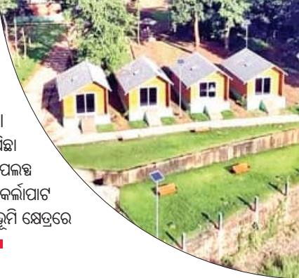
କର୍ଳାପାଟ ଅଭୟାରଣ୍ୟ ପର୍ଯ୍ୟଟକ ଓ ପ୍ରକୃତିପ୍ରେମୀଙ୍କୁ ପାଇଁ ପର୍ଯ୍ୟଟନ ଭିତ୍ତିକୁ ମିଶ୍ଟ୍ରରେ ଜିଲ୍ଲା କାହିଁକି ସମସ୍ତ ରାଜ୍ୟରେ ବିଶେଷ ସମ୍ପାଦନା ବହନ କରିବ ।

ପରମ୍ପରା ଓ ପର୍ବର ସମୃଦ୍ଧି ମାଟି ଗଞ୍ଜାମ । ଏଠାକାର ପର୍ବପର୍ବାଣିରେ ସ୍ୱତନ୍ତ୍ର ଖାଦ୍ୟପେୟ ଦେଖିବାକୁ ମିଳେ । ଏହି ଖାଦ୍ୟପେୟ ନୂଆ ସମ୍ପର୍କ ମଧ୍ୟ ତିଆରି କରେ । ତନ୍ମଧ୍ୟରୁ ମୁଆଁ ଅନ୍ୟତମ । ସାଧାରଣତଃ ଶେରଗଡ଼ ମୁଆଁ ସଭିକାର ପ୍ରିୟ । ଲୋକଙ୍କ ପସନ୍ଦ ମଧ୍ୟ । ଯଦିଓ ମୁଆଁର ଆରମ୍ଭକୁ ନେଇ କୌଣସି ନିର୍ଦ୍ଦିଷ୍ଟ ସୂଚନା ନାହିଁ । କିନ୍ତୁ ଧାନକଟା ହୋଇ ଖାଳକୁ ଆସିବା ପରେ ଧାନ ଗଦା ନିକଟରେ ଲକ୍ଷ୍ମୀ ନାରାୟଣଙ୍କୁ ମୁଆଁ ପୂଜା ହେବାର ପରମ୍ପରା କେଉଁ ଆବାହମାନ କାଳରୁ ରହିଛି ବୋଲି କୁହାଯାଏ । ତେଣୁ ଗଞ୍ଜାମରେ ଏବେ ନୁହେଁ, ଦୀର୍ଘ ସମୟ ଧରି ଏହି ସ୍ୱତନ୍ତ୍ର ମୁଆଁ ପ୍ରସ୍ତୁତ କରାଯାଉଛି ।