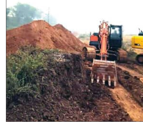
ସେମାନଙ୍କ ବିରୁଦ୍ଧରେ କାର୍ଯ୍ୟାନୁଷ୍ଠାନ ଗ୍ରହଣ କରାଯିବ ନା ସାଧ୍ୟତା ଦେବ, ତାହା ଏବେ ସମୟ କହିବ। ଖଣି ବିଭାଗ ଖାତସ୍ତରରେ ଏଭଳି ଲୁଚେଇ କରାଯାଉଛି।

ଦାନଗଡ଼ି ତହସିଲ ଅଧୀନସ୍ଥ ମାନବିକା ରାଜସ୍ୱ ସର୍ବକାରୀ ବିଭିନ୍ନ ସ୍ଥାନରୁ ମୋରମ ଲୁଚେଇ କରାଯାଇ ରେଳପଥ ଦୋହରାକରଣ କାର୍ଯ୍ୟରେ ଆରମ୍ଭ କରି ଧାରଣା, ପଶିମବଙ୍ଗକୁ ତୋରା ଚାଲାଇବା ଚେଷ୍ଟା କରାଯାଇଛି।