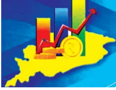
ଆଗାମୀ ବର୍ଷ ପାଇଁ ବଜେଟ୍‌ରେ ଆଭିଯୁକ୍ତି ସ୍ପଷ୍ଟ କରିବେ ସରକାର

ଭୁବନେଶ୍ୱର, ୧୮ (ସମ୍ପାଦକ): ରାଜ୍ୟରେ ଯୋଗାଣ ବିକଳ ସରକାର ୨୦୨୫-୨୬ ଆର୍ଥିକ ବର୍ଷ ପାଇଁ ଆସନ୍ତା ଫେବୃଆରୀ ମାସରେ ପୂର୍ଣ୍ଣାଙ୍ଗ ବଜେଟ୍ ଉପସ୍ଥାପନ କରିବାକୁ ଯାଉଛନ୍ତି। ଏଥିରେ ରାଜ୍ୟ ବିକାଶର ଆଭିଯୁକ୍ତିକୁ ସ୍ପଷ୍ଟ କରିବା ସହ ବିକାଶଧାରୀକୁ ଅଧିକ ଗତିଶୀଳ କରିବା ପାଇଁ ରୂପରେଖ ପ୍ରସ୍ତୁତ ହେବ। ଆଗାମୀ ବଜେଟ୍‌ରେ ସାମାଜିକ କ୍ଷେତ୍ରକୁ ପ୍ରାଧାନ୍ୟ ଦେବା ନିମନ୍ତେ ନୂଆ ସରକାର ୧୦ଟି ମାନଦଣ୍ଡ ଅନୁଯାୟୀ ବିଭାଗୀୟ ପ୍ରସ୍ତାବ ଲୋଡ଼ିଛନ୍ତି। ଏଥିପାଇଁ ଗତ ଡିସେମ୍ବର ମାସରୁ ଅର୍ଥ ବିଭାଗ ସହ ବିଭାଗୀୟ ବିପୋର୍ଟ ମାଗିଛି।