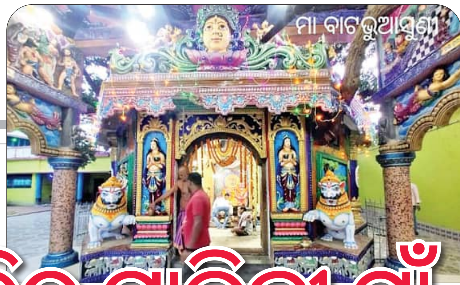
ମା ବାଟ ଲୁଆଣ୍ଡା