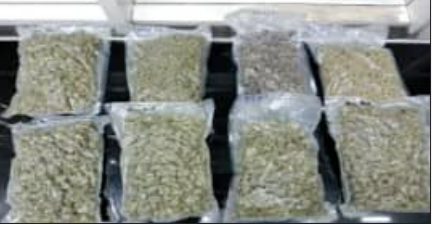
ଜଣେ ଚାଲାଣକାରୀଙ୍କୁ ଅଟକ ରଖି ପତରାଉତରା କରାଯାଇଛି ୧୪ ଦିନରେ ୨୯ କୋଟିରୁ ଅଧିକ ମାରିକୁଆନା ଜବତ ହେଲାଣି ଆଇଲାଣ୍ଡ, ମାଲେସିଆରୁ ହେଉଛି ଚାଲାଣ

ଭୁବନେଶ୍ୱର, ୧୮ (ସମ୍ପାଦକ): ନିଶା ମାଫିଆଙ୍କ ଗଳାବାଟ ପାଲଟିଛି ଭୁବନେଶ୍ୱର ବିମାନ ବନ୍ଦର। ସେମାନେ ବିମାନ ବନ୍ଦର ଦେଇ ବିଦେଶକୁ ମାରିକୁଆନା ଚାଲାଣ କରୁଛନ୍ତି। ଗତ ୧୪ ଦିନରେ ୨୯ କୋଟିରୁ ଅଧିକ ଟଙ୍କା ମୂଲ୍ୟର ମାରିକୁଆନା (ଗଞ୍ଜେଇ କାଟାୟ ନିଶାଦ୍ରବ୍ୟ) ଜବତ ହେଲାଣି। ଏହି ଘଟଣାରେ ଦୁଇ ମହିଳା ସମେତ ୩ଜଣଙ୍କୁ ଗିରଫ କରାଗଲାଣି। ତଥାପି ମାରିକୁଆନା ଚାଲାଣ କମୁନାହିଁ। ଆଜି ପୁଣି ବିକ୍ୱ ପକ୍ଷରୁ ବିମାନ ବନ୍ଦରରୁ ୬ କୋଟିର ମାରିକୁଆନା ଜବତ କରାଯାଇଛି। ଜଣେ ଚାଲାଣକାରୀ ମାରିକୁଆନା ନେଇ ଆସୁଥିବା ବେଳେ ମାଡ଼ି ବସିଥିଲା କଷ୍ଟମ ବିଭାଗ। ଚାଲାଣ କରୁଥିବା ବ୍ୟକ୍ତିଙ୍କୁ ଅଟକ ରଖି ପତରାଉତରା କରୁଛି କଷ୍ଟମ ବିଭାଗ। ସାତ କେଜି ମାରିକୁଆନା ନେଇ ଜଣେ ଅଭିଯୁକ୍ତ ବ୍ୟାଙ୍କରୁ ଭୁବନେଶ୍ୱର ଆସୁଥିଲେ। ଏନେଇ ଗୁଜରାଟ ସୁଦ୍ଧରୁ ଖବର ପାଇଥିଲା କଷ୍ଟମ ବିଭାଗ। ଇଣ୍ଡିଗୋ ବିମାନ ଭୁବନେଶ୍ୱର ବିମାନ ବନ୍ଦରରେ ଅବତରଣ କରିବା ପରେ କଷ୍ଟମ ବିଭାଗ କର୍ମଚାରୀ ଜଣେ ଯାତ୍ରୀଙ୍କ ଲଗେଜ୍‌ସ୍‌ ଯାଞ୍ଚ କରିଥିଲେ। ଯାଞ୍ଚ ବେଳେ ୬ କୋଟିର ମାରିକୁଆନା ଧରାପଡ଼ିଥିଲା। ଉକ୍ତ ବ୍ୟକ୍ତିଙ୍କୁ ଉଠାଇ ନେଇଥିଲା କଷ୍ଟମ ବିଭାଗର ସଫର ଇଣ୍ଡିଗୋକୁ ଯୁକ୍ତି। ବ୍ୟାଙ୍କ ଓ ହାଲାଲ୍‌ମୁରୁ ପୂର୍ବରୁ ଆସୁଛି ଏହି ବାମା ନିଶାଦ୍ରବ୍ୟ। ପୂର୍ବରୁ ୨ ଜଣ ମହିଳା ଓ ୩ ମୁଦ୍ରକଙ୍କୁ ଗିରଫ କରାଯାଇଥିବା ବେଳେ ବିମାନବନ୍ଦର ବଜ୍ରମାନ ନିଶା ପୃଷ୍ଠା-୯