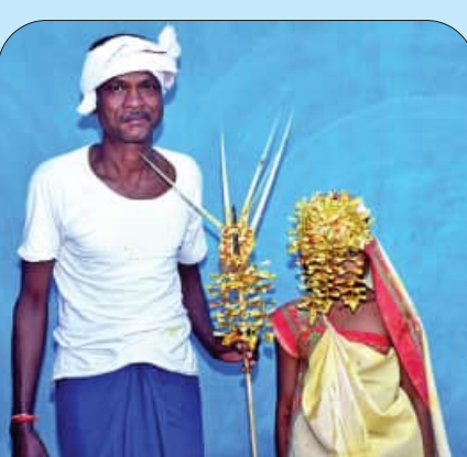
ଗାନ କରନ୍ତି । ସକାଳ ହେଲେ କନ୍ୟାକୁ ଧଳା ଶାଢ଼ି ପିନ୍ଧାଇ ଧରମ ଖରିଲା ଦିଆଯାଏ । ସେଥିରେ ନାଲି ପୁଲ, ନାଲି ପିତା, ଅରୁଆ ଚାଉଳ, କଞ୍ଚା ହଳଦା, ଧରମ ଖରିଲାରେ ଦିଆଯାଇ ମୁଖରେ କୁଟାଯାଏ ।

ରୁକ୍ଷିଆ ଲୁ ଞି ଆ ଜନଜାତି ମୁଖ୍ୟତଃ ନୂଆପଡ଼ା ଜିଲ୍ଲାରେ ବାସ କରନ୍ତି । ସେମାନଙ୍କ ସମ୍ପ୍ରଦାୟର ପ୍ରତ୍ୟେକ ଝିଅ ଥରେ ନୁହେଁ ବରଂ ଦୁଇ ଥର ବିବାହ କରନ୍ତି । ଆଦିବାସୀ ସମ୍ପ୍ରଦାୟର ରୁକ୍ଷିଆ ଲୁ ଞିଆ ଜନଜାତିକ ମଧ୍ୟରେ ଏପରି ଏକ ଭିନ୍ନ ଧରଣର ବିବାହ ପ୍ରଥା ଦେଖିବାକୁ ମିଳିଥାଏ । ପୂର୍ବ କାଳରୁ ଜନଜାତି ସଂସ୍କୃତି ଓ ପରମ୍ପରା ସହ ଜଡ଼ିତ ଏହି ଭିନ୍ନ ପ୍ରକାରର ବିବାହକୁ ଅତି ଧ୍ୟାନ ସହ ପାଳନ କରି ଆସୁଛନ୍ତି ଏହି ସମ୍ପ୍ରଦାୟ ଲୋକେ । ସ୍ଥାନୀୟ ଭାଷାରେ ଏହି ବିବାହ ନାମ ହେଉଛି 'କଣାବରା' ବା ଅଧା ବିବାହ । କଣାବରା ବା ଅଧା ବିବାହ ରୁକ୍ଷିଆ ଲୁ ଞିଆ ଜନଜାତିକ ମଧ୍ୟରେ ଏକ ଗୁରୁତ୍ୱପୂର୍ଣ୍ଣ ପରମ୍ପରା । ଏହା ମୁଖ୍ୟତଃ ବିଶାଖା ମଧ୍ୟର ବିବାହ ଡିଅନ୍ତରେ ପାଳନ କରାଯାଏ । ଝିଅଟିର ଗରୁସ୍ରାବ ହେବା ପୂର୍ବରୁ ଦଶ ବର୍ଷ ବୟସରେ ନିଜ ପରିବାର ଏବଂ ସମ୍ପ୍ରଦାୟ ଲୋକଙ୍କ ଉପସ୍ଥିତିରେ କଣାବରା ବିବାହ