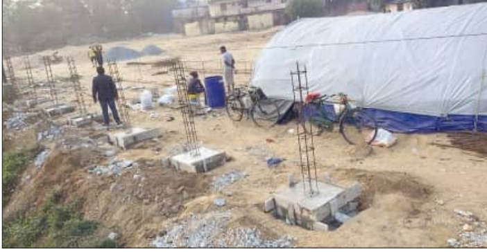
ପ୍ରକାଶ ସେ ଏବେ ସାଲେପୁର ବସ୍ତାଖଣ୍ଡ ପାଇଁ ଜାଗା ଚିହ୍ନଟ ହୋଇ ବସ୍ତାଖଣ୍ଡ ନିର୍ମାଣ କାର୍ଯ୍ୟ ଆରମ୍ଭ ହୋଇଛି। କଟକ ଠିକାଦାର ଚିହ୍ନଟ ହୋଇଥିବା ସ୍ଥାନରେ ବସ୍ତାଖଣ୍ଡ

ବସ୍ତାଖଣ୍ଡ ନିର୍ମାଣ କରୁଥିବା ଠିକାଦାର କେନାଲବନ୍ଧକୁ ଜବରଦଖଲ କରି ବସ୍ତାଖଣ୍ଡ ନିର୍ମାଣ କରୁଥିବା ଦେଖାଯାଇଛି। କେନାଲରେ ପାଣି ଆସିଲେ ଯଦି କୌଣସି ସମସ୍ୟା ସୃଷ୍ଟି ହୁଏ, ତେବେ କେନାଲବନ୍ଧକୁ ମରାମତି କରିବା ପାଇଁ ସେହି ସ୍ଥାନରେ କୌଣସି ବ୍ୟବସ୍ଥା ମଧ୍ୟ କରାଯାଇ ନାହିଁ। କେନାଲବନ୍ଧକୁ ମତାଇ ବସ୍ତାଖଣ୍ଡ ନିର୍ମାଣ କାର୍ଯ୍ୟ ଆରମ୍ଭ କରିଥିବାରୁ ସ୍ଥାନୀୟ ଜନସାଧାରଣଙ୍କ ମଧ୍ୟରେ ଅସନ୍ତୋଷ ପ୍ରକାଶ ପାଇଛି।