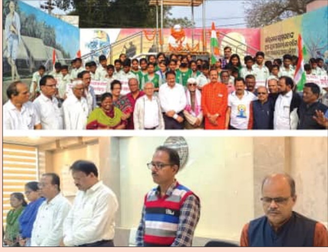
ଭଦ୍ରକ, ୩୦।୧(ସମ୍ବିଧ): କାନ୍ଧିଜୀ ପିତା ମହାତ୍ମାଗାନ୍ଧୀଙ୍କ ପବିତ୍ର ତିରୋଧାନରେ ସହିଦ ଦିବସ ପାଳନ ଅବସରରେ ଭଦ୍ରକ ଜିଲ୍ଲା ପ୍ରଶାସନ ଆନୁଷ୍ଠାନିକ ଗାନ୍ଧୀଜୀଙ୍କ

ଦିଲ୍ଲୀ ପାଇଁ ଗାନ୍ଧୀଜୀଙ୍କ ପୂର୍ଣ୍ଣାଙ୍ଗ ପ୍ରତିମା ପ୍ରତିଷ୍ଠା କରାଯାଇଥିଲା। ଏହାଛଡ଼ା ଭଦ୍ରକ ଜିଲ୍ଲା ପ୍ରଶାସନ ଆନୁଷ୍ଠାନିକ ଗାନ୍ଧୀଜୀଙ୍କ ପୂର୍ଣ୍ଣାଙ୍ଗ ପ୍ରତିମା ପ୍ରତିଷ୍ଠା କରାଯାଇଥିଲା। ଏହାଛଡ଼ା ଭଦ୍ରକ ଜିଲ୍ଲା ପ୍ରଶାସନ ଆନୁଷ୍ଠାନିକ ଗାନ୍ଧୀଜୀଙ୍କ ପୂର୍ଣ୍ଣାଙ୍ଗ ପ୍ରତିମା ପ୍ରତିଷ୍ଠା କରାଯାଇଥିଲା।