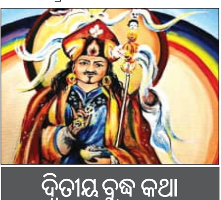
ଦ୍ୱିତୀୟ ବୁଦ୍ଧ କଥା

ନିରବ ବସନ୍ତର ଯନ୍ତ୍ରଣା ନିରବ ବସନ୍ତର ଯନ୍ତ୍ରଣା ନିରବ ବସନ୍ତର ଯନ୍ତ୍ରଣା ନିରବ ବସନ୍ତର ଯନ୍ତ୍ରଣା ନିରବ ବସନ୍ତର ଯନ୍ତ୍ରଣା