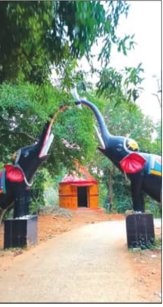
ପର୍ଯ୍ୟଟକ ପରିବାର ସହ ଆସିବାକୁ ଲଜ୍ଜା ପ୍ରକାଶ କରୁ ନ ଥିବା ଜଣାପଡ଼ିଛି। ସ୍ଥାନୀୟ ପୁଲିସ୍ ଏ ଦିଗରେ ପଦକ୍ଷେପ ଗ୍ରହଣ କରିବାକୁ ସାଧାରଣରେ ଦାବି ହେଉଛି।

ରୁକ୍ ପିଣ୍ଡୁଆରେ ଅନୁଷ୍ଠିତ ହୋଇଥିବା କୁହୁଣୀ ସମାଜ ସଭା ସାରି ଫେରୁଥିବା କୁହୁଣୀ ସମାଜ ନେତୃବର୍ଗଙ୍କ ଗାଡ଼ି ସହ ନେତୃବର୍ଗଙ୍କୁ ଆକ୍ରମଣ ହୋଇଥିବା ନେଇ ସାମାଜିକ ଗଣମାଧ୍ୟମରେ ଚର୍ଚ୍ଚା ଜୋର ଧରିଛି।