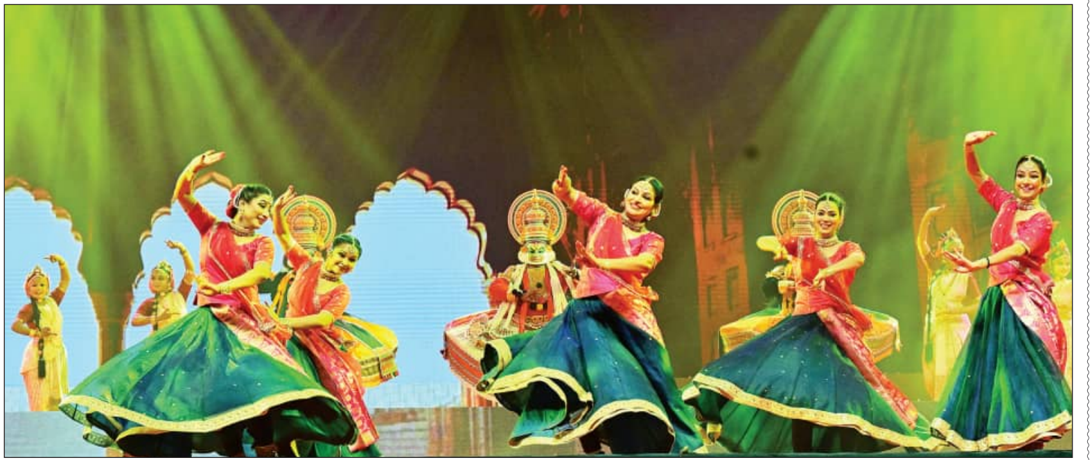
ଭୁବନେଶ୍ୱରରେ ଆୟୋଜିତ ପ୍ରବାସୀ ଭାରତୀୟ ଦିବସ ସମ୍ମେଳନ ମଞ୍ଚରେ ନୃତ୍ୟ ପ୍ରଦର୍ଶନ

କୋଣାର୍କ, ୯।୧(ସମ୍ପାଦକ): ପବିତ୍ର ଶାମ୍ବୁ ଦଶମୀ ଅବସରରେ ଉତ୍ସବମୁଖର ଅନନ୍ତ ଅବଧୂତ ମଠରୁ ସୂର୍ଯ୍ୟ ନାରାୟଣଙ୍କ ଚଳନ୍ତି ପ୍ରତିମା ମିତ୍ରାଦିତ୍ୟଙ୍କୁ ରଥାରୂପେ କରାଯାଇ ଚନ୍ଦ୍ରଭାଗା ଚାପିଲୁ ନିଆଯାଇଛି। ସେଠାରେ ୨୭ଟି ନକ୍ଷତ୍ରରେ ୨୭ଦିନ ଧରି ପୂଜାର୍ଚ୍ଚନା ପରେ ମାଘ ଶୁକ୍ଳ ସପ୍ତମୀ ତିଥିରେ ମିତ୍ରାଦିତ୍ୟଙ୍କ ବାହୁଡ଼ା ଯାତ୍ରା ଅନୁଷ୍ଠିତ ହେବ। ଉତ୍ସବରେ ମିତ୍ରାଦିତ୍ୟଙ୍କୁ ଦର୍ଶନ କଲେ ରୋଗ, ଶୋକ ଓ ଭୟରୁ ମୁକ୍ତି ମିଳିବ। ସହ ପୂଜାର୍ଚ୍ଚନା ହୋଇନଥାଏ ବୋଲି ଶ୍ରଦ୍ଧାଳୁଙ୍କ ବିଶ୍ୱାସ ରହିଛି। ଏହି ଅବସରରେ ଆଜି ଅର୍ଦ୍ଧକ୍ଷେତ୍ର କୋଣାର୍କ ଉତ୍ସବମୁଖର ହୋଇଛି। ପୌଷ ଶୁକ୍ଳ ଅଷ୍ଟମୀରୁ ଦଶମୀ ପର୍ଯ୍ୟନ୍ତ ତିନିଦିନ ବ୍ୟାପୀ ସ୍ଥାନୀୟ ଜଗନ୍ନାଥ ମନ୍ଦିର ପରିସରରେ ବିଶ୍ୱ କଲ୍ୟାଣ ଯୌର ମହାଯଜ୍ଞ, ଚନ୍ଦ୍ରଭାଗାଠାରେ ଶାକ୍ୟଦ୍ୱୀପ ବ୍ରାହ୍ମଣ ମହାଫେଦ ପକ୍ଷରୁ ବିଶ୍ୱ କଲ୍ୟାଣ ନବଗ୍ରହ ମହାଯଜ୍ଞ ଏବଂ କୋଣାର୍କର ଅନନ୍ତ ଅବଧୂତ ମଠ ପକ୍ଷରୁ ବିଶ୍ୱ କଲ୍ୟାଣ ମହାଯଜ୍ଞ ଅନୁଷ୍ଠିତ ହୋଇଛି।