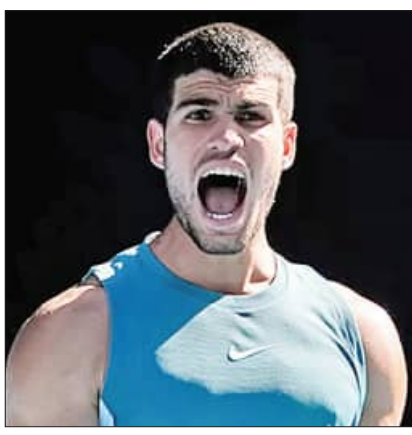
ପାଲ୍ୟୁଟେକୋରାଙ୍କ ଭଳି ସିଡ୍‌ରେ ଖେଳାଳି କ୍ୱାର୍ଟରଫାଇନାଲରେ ପ୍ରବେଶ କରିଛନ୍ତି । କ୍ୱାର୍ଟରରେ ସାବାଲେକା ଓ ପାଲ୍ୟୁଟେକୋରା ଏବଂ ଗର୍ଡ ଓ ବଡୋସା ପରସ୍ତରକୁ ଭେଟିବେ । ଶ୍ରେଷ୍ଠ ସିଡ୍ ବେଲାରୁଷ୍‌ରେ ସାବାଲେକା ୬-୨, ୬-୨ ସିଧାସଳଖ ସେଟ୍‌ରେ ୧୪ତମ ସିଡ୍ ୧୭ ବର୍ଷୀୟ ରୁଷ୍‌ରୁ ଖେଳାଳି ମାରା ଆସ୍ତିଭାଙ୍କୁ, ଚୁଡାୟ ସିଡ୍ ଆମେରିକାର ଗର୍ଡ ୫-୬, ୬-୨, ୬-୨ ସେଟ୍‌ରେ ସ୍ପେନ୍‌ରାଲକ୍ସର ବେଲିଷ୍ଟା