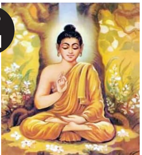
ତା'କୁ ଶିକ୍ଷା ପ୍ରଦାନ କରିବି? ଉତ୍ତରରେ ବୁଦ୍ଧ ତାଙ୍କୁ ବୁଝାଇ କହିଲେ, 'ପାଞ୍ଚ ବର୍ଷ ପୂର୍ବରୁ ହିଁ ତୁମକୁ ପିଲାଟିର ଶିକ୍ଷାଗ୍ରହଣ ଆରମ୍ଭ କରିବାର ଥିଲା । କ'ଣ ଖାଇବା ଉଚିତ, ଅନୁଚିତ,

କବୀ ଜଣେ ଯୁବକ ଗୌତମ ବୁଦ୍ଧଙ୍କ ପାଖକୁ ଆସି କହିଲେ, "ମହାରାଜା ମୋ ଗାଁ ଅଖିଷିତ । ମୁଁ ମୋ ଘର ଲୋକଙ୍କ ସହ ଝଗଡ଼ା କରି ଯାହା କିଛି ପାଠ ପଢ଼ିଛି । ଆଗକୁ ଆହୁରି ବି ପଢ଼ିବାକୁ ଚାହୁଁଛି । ହେଲେ ସମସ୍ତେ ମୋତେ ବାଧା ଦେଉଛନ୍ତି । ଘର ଲୋକ କହୁଛନ୍ତି ତାହାକାର୍ଯ୍ୟରେ ବହୁତ ଟଙ୍କା ଅଛି ଏବଂ ଏ ଲାଗି କୌଣସି ଶିକ୍ଷାର ଆବଶ୍ୟକତା ନାହିଁ । ତେବେ ଏ ଚିନ୍ତାଧାରା କେବଳ ମୋ ଘର ଲୋକଙ୍କର ନୁହେଁ, ପୂରା ଗାଁବାସୀ ମଧ୍ୟ ଏହି ସମାନ କଥା ଭାବୁଛନ୍ତି । ତେଣୁ ଦୟାକରି ଆପଣ ମୋ ଗାଁକୁ ଆସି ଶିକ୍ଷାର ପ୍ରଚାର ପ୍ରସାର କରନ୍ତୁ ।"