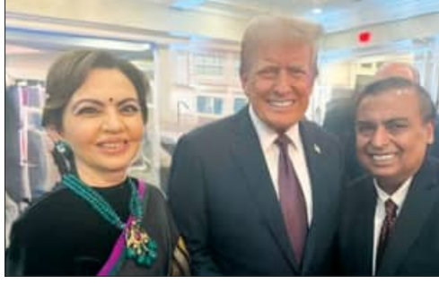
ଟ୍ରମ୍ପଙ୍କ ଡିନର ପାର୍ଟିରେ ମୁକେଶ-ନୀତା ଅମ୍ବାନୀ

ଏଥିପ୍ରସଙ୍ଗରେ ବିଏ ଟାଙ୍କ ମାଆ ଉପହାର ସ୍ୱରୂପ ଦେଇଥିଲେ । ଅନ୍ୟତମ ଲିଙ୍କନ୍ ବାଲବେଳ ବୋଲି କୁହାଯାଇଛି । ଟ୍ରମ୍ପଙ୍କ ଶପଥ ଗ୍ରହଣ ପୂର୍ବରୁ ଆୟୋଜିତ ରାତ୍ରୀ ଭୋଜନରେ ରିଲ୍ୟାଏନ୍ ଇଣ୍ଡଷ୍ଟ୍ରିର ଅଧ୍ୟକ୍ଷ ମୁକେଶ ଅମ୍ବାନୀ ଏବଂ ରିଲ୍ୟାଏନ୍