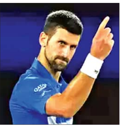
କରିଥିବା ଜୋକୋଭିଚ୍ ଏଥର ସଫଳ ହେଲେ ୨୫ଟି ଟାଇଟଲ ହାସଲ କରି କିମ୍ବଦନ୍ତୀ ଅଷ୍ଟ୍ରେଲିଆନ୍ ମହିଳା ଖେଳାଳି ମାରୀୟୋରା କୋର୍ଟି (୨୪ ଟାଇଟଲ)ଙ୍କୁ ପଛରେ ପକାଇ ବିଶ୍ୱରେକର୍ତ୍ତୃତ୍ୱ ସୃଷ୍ଟି କରିବେ ।

ମେଲବୋର୍ଣ୍ଣ, ୧୯/୧ (ଏକେନ୍ଦ୍ର): ଚଳିତ ଅଷ୍ଟ୍ରେଲିଆନ୍ ଓପନ୍ ଚେନିସ ଚୂର୍ଣ୍ଣାମେଣ୍ଡର ପୁରୁଷ ଏକକ ପ୍ରତିଯୋଗିତାରେ ନୋଭାକ ଜୋକୋଭିଚ୍, ଆଲେକ୍ସାନ୍ଦର ଡେବେଲ, କାର୍ଲୋସ ଆଲକାରାଜ, ଚର୍ଚ୍ଚିତ ଡାକ୍ ଡେଲିଆଲି କ୍ୱାର୍ଟରଫାଇନାଲରେ ପ୍ରବେଶ କରିଛନ୍ତି । ମଲ୍‌କୋବାର କ୍ୱାର୍ଟରରେ ୬ମ ସିଡ୍ ସର୍ବିଆର ଜୋକୋଭିଚ୍ ଓ ଚୁଡାୟ ସିଡ୍ ଆମେରିକାର କାର୍ଲୋସ ଆଲକାରାଜ ଏବଂ ଦ୍ୱିତୀୟ ସିଡ୍ ଜର୍ମାନୀର ଡେବେଲ ଓ ଆମେରିକାର ପଲ ପରସ୍ତରକୁ ଭେଟିବେ । ରବିବାର ଖେଳାଯାଇଥିବା ଚତୁର୍ଥ ରାଉଣ୍ଡ ମୁକାବିଲାରେ ୩୬ ବର୍ଷୀୟ ଜୋକୋଭିଚ୍ ୬-୩, ୬-୪, ୬-୨ ସେଟ୍‌ରେ ଚେକ ଗଣରାଜ୍ୟର ଜିରି କେହେକାଙ୍କୁ ପରାସ୍ତ କରିଥିବା ବେଳେ ଚୁଡାୟ ସିଡ୍ ସ୍ପେନ୍‌ର ଆଲକାରାଜ ଓ ଡେବେଲ ପାଇଁ ଅଗ୍ରଗତି କରିଛନ୍ତି । ୧୫ତମ ସିଡ୍ ବ୍ରିଟେନ୍‌ର ଜ୍ୟାକ ଡ୍ରାପର ଲକ୍ଷ୍ମୀରା କାରଣରୁ ଓହରିଯିବା ପରେ ଆଲକାରାଜ କ୍ୱାର୍ଟରକୁ ଉଠିଥିଲେ । ସେହିପରି ଦ୍ୱିତୀୟ ସିଡ୍ ଜର୍ମାନୀ ଡେବେଲ ୬-୨, ୨-୬, ୬-୩, ୬-୨ ସେଟ୍‌ରେ ୧୪ତମ ସିଡ୍ ପ୍ରାନ୍ତର ଉଗୋ ହର୍ମୁଟ୍‌ଙ୍କୁ ଓ ଦ୍ୱାଦଶ ସିଡ୍ ଆମେରିକାର ପଲ ୬-୨, ୬-୨, ୬-୨ ସେଟ୍‌ରେ ସ୍ପେନ୍‌ର ଆଲେକ୍ସେଣ୍ଡା ଦେଭିଡୋଭିକ୍ ଡେଲିଆଲିଙ୍କୁ ପରାସ୍ତ କରି କ୍ୱାର୍ଟରକୁ ଉଠିଛନ୍ତି । ୨୪ଟି ଗ୍ରାଣ୍ଡସ୍ଲାମ ଟାଇଟଲ ହାସଲ କରିଥିବା ଜୋକୋଭିଚ୍ ଏଥର ସଫଳ ହେଲେ ୨୫ଟି ଟାଇଟଲ ହାସଲ କରି କିମ୍ବଦନ୍ତୀ ଅଷ୍ଟ୍ରେଲିଆନ୍ ମହିଳା ଖେଳାଳି ମାରୀୟୋରା କୋର୍ଟି (୨୪ ଟାଇଟଲ)ଙ୍କୁ ପଛରେ ପକାଇ ବିଶ୍ୱରେକର୍ତ୍ତୃତ୍ୱ ସୃଷ୍ଟି କରିବେ ।