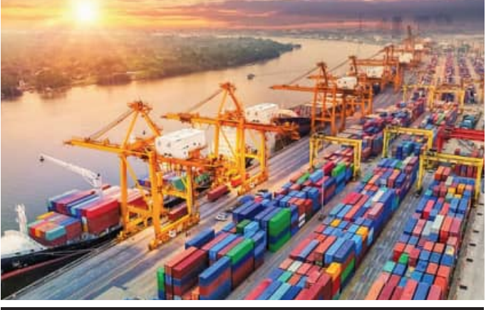
ଏପ୍ରିଲରେ ଡିସେମ୍ବର ମଧ୍ୟରେ ୨୧୦.୭୭ ବିଲିୟନ ଡଲାରର ବାଣିଜ୍ୟ କ୍ଷତି

ନୂଆଦିଲ୍ଲା, ୧୫୧ (ଏକେଡି): ଅନ୍ତର୍ଜାତୀୟ ସ୍ତରରେ ଟଙ୍କା ମୂଲ୍ୟ ହ୍ରାସ ପାଇବାରେ ଲାଗିଛି। ଏହା ଦିନକୁ ଦିନ ହ୍ରାସରେ ରେକର୍ଡ କରି ଚାଲିଛି। ଏପରି ସମୟରେ ଭାରତୀୟ ଅର୍ଥନୀତିକୁ ନେଇ ଖରାପ ଖବର ଆସିଛି। ଦେଶରେ ଡିସେମ୍ବରରେ ରଞ୍ଚନା ହ୍ରାସ ପାଇଥିବାବେଳେ ଆମଦାନୀ ବୃଦ୍ଧି ପାଇଛି। ବାଣିଜ୍ୟ କ୍ଷତି ମଧ୍ୟ ବଢ଼ିବାରେ ଲାଗିଛି। ସରକାରଙ୍କ ପକ୍ଷରୁ ଏହି ସୂଚନା ଦିଆଯାଇଛି। ଏହି ତଥ୍ୟ ଅର୍ଥନୀତି ଭିତ୍ତିରେ ମଧ୍ୟ ଗଭୀର ପ୍ରଭାବ ପକାଇପାରେ। ସେୟାର ବଜାର ମଧ୍ୟ ହ୍ରାସ ପାଇପାରେ। ସରକାରୀ ତଥ୍ୟ ଅନୁଯାୟୀ ସମାଜିକ୍ ଅବସ୍ଥାରେ ଦେଶର ରଞ୍ଚନା ଏକ ପ୍ରତିଶତ ଅଧିକ ହ୍ରାସ ପାଇଛି। ଆମଦାନୀ ୫ ପ୍ରତିଶତ ଅଧିକ ବୃଦ୍ଧି ପାଇଛି। ଏହା ଦ୍ୱାରା ବାଣିଜ୍ୟ କ୍ଷତି ଆହୁରି ଅଧିକ ବୃଦ୍ଧି ପାଇଛି। ତେବେ ନଭେମ୍ବର ତୁଳନାରେ ଦେଶରେ ରଞ୍ଚନା