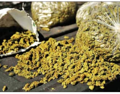
୫୨୪ଗ୍ରାମର ମାରିଜୁଆନା ନେଇ ଆସୁଥିବାବେଳେ ସାମାନ୍ୟ ବିଭାଗ କାନ୍ଦୁ କରି ନେଇଥିଲା । ଦିନି ଦିନ ବ୍ୟବଧାନରେ ଏହି ନିଶାଦ୍ରବ୍ୟ ଓଡ଼ିଶାରୁ ଦୁଇଜଣ ଠାକ ହେବା ପରେ ସମସ୍ତଙ୍କ ଚିନ୍ତା