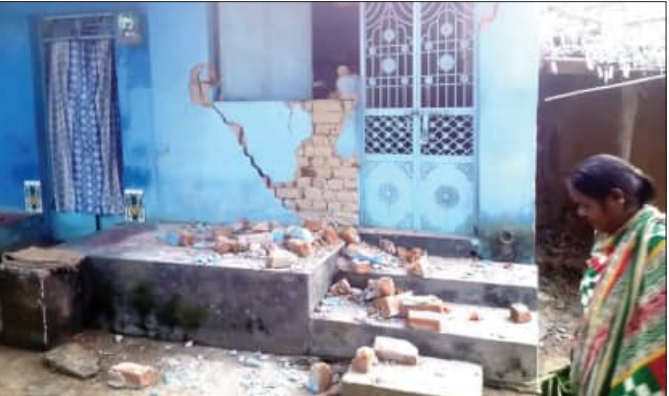
ଶୋଇ ପାଲୁନାହାନ୍ତି। ଗତ ୪ ଦିନ ଧରି ହାତୀ ପଲ୍ଲୀ ଗତ ବନାଞ୍ଚଳ ଗୁଣ୍ଡୁରିବାଦି,

ଏବେ ଉତ୍ତର ଗୁମୁସର ବନଖଣ୍ଡ ଅଧିକ ପ୍ରକାଶିତ ବନାଞ୍ଚଳ ଉଲ୍ଲାନରେ ୨୫ ଜଣିଆ ହାତୀପଲ୍ଲୀ କ ବୌଦ୍ଧଗ୍ୟ ଜାଗା ରହିଛି।