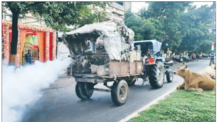
ସିନି କରାଯାଉଥିବା ତେଲ ମଧ୍ୟ ପଢ଼ୁନାହାନ୍ତି । ଯାହାକି ନେଇ ବସନ୍ତ ଋତୁରୁ ମଶାଙ୍କ ଦାଉ ବୃଦ୍ଧି ପାଇଛି । ଯାହାକି ନେଇ ବସନ୍ତ ଋତୁରୁ ମଶାଙ୍କ ଦାଉ ବୃଦ୍ଧି ପାଇଛି ।

'ଟିପା' ମେସିନ କୁଲି ମଶା ଧୂଆଁ ଛାଡ଼ିବାର ବ୍ୟବସ୍ଥା କରାଯାଇଛି । ଯାହାକି ନେଇ ବସନ୍ତ ଋତୁରୁ ମଶାଙ୍କ ଦାଉ ବୃଦ୍ଧି ପାଇଛି । ଯାହାକି ନେଇ ବସନ୍ତ ଋତୁରୁ ମଶାଙ୍କ ଦାଉ ବୃଦ୍ଧି ପାଇଛି ।