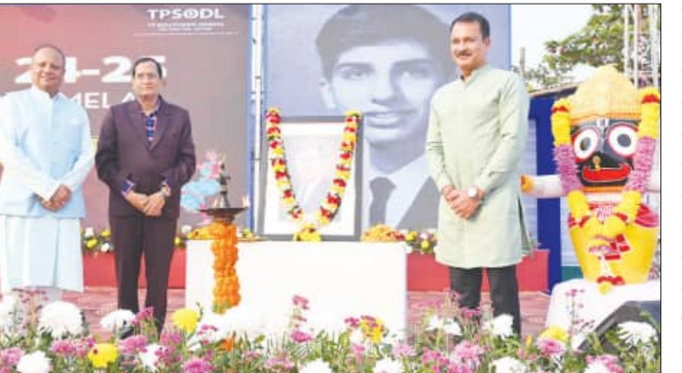
ବୁଦ୍ଧପୁର, ୩ ଡିସେମ୍ବର: ନୂତନ ବର୍ଷକୁ ସାଗର କରିବା ପାଇଁ ଟିପିଏସ୍‌ଓଟିଏଲ୍ ପକ୍ଷରୁ 'ଉଲ୍ଲାସ ୨୦୨୪' ପାଇଁ ଗୋଟିଏ ପଦକ୍ଷେପ ଗ୍ରହଣ କରାଯାଇଛି ।