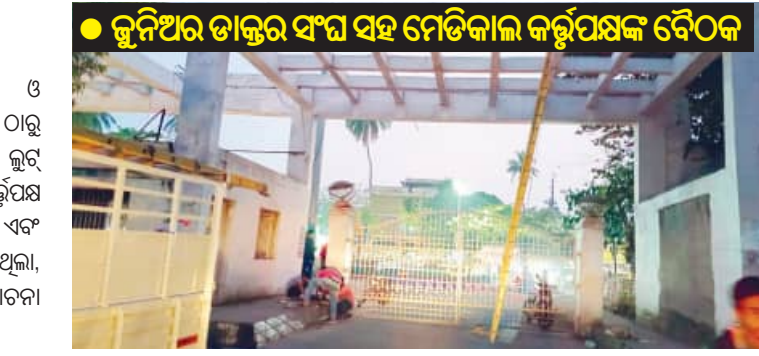
ବୁଦ୍ଧପୁର, ୩ ଡିସେମ୍ବର: ଏମକେସିଜି ମେଡିକାଲ କଲେଜ ଓ ହସ୍ପିଟାଲର ଚୋର ଗଲା ପରେ ଚେତିଲେ; ଆରମ୍ଭହେଲା ଆଲୋକୀକରଣ ।