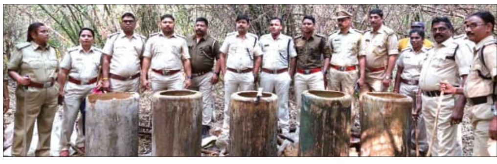
ଏହି ଚଢ଼ାଉରେ ଶ୍ରୀକାକୁଳମ ଅବକାରୀ ବିଭାଗ ଓ ଓଡ଼ିଶା ପ୍ରସ୍ତର ମିଳିତ ଚଢ଼ଉ କରାଯାଇଛି।

ସୀମାନ୍ତ ଅଞ୍ଚଳରେ ଥିବା ପାହାଡ଼ ଉପର ଗ୍ରାମଗୁଡ଼ିକରେ ଦେଖାଇବା ଉଦ୍ଦେଶ୍ୟ ସହ ପ୍ରସ୍ତର କରାଯାଇଥିବା ଖବର ମିଳିବା ପରେ ଆନ୍ଧ୍ରପ୍ରଦେଶ ଶ୍ରୀକାକୁଳମ ଜିଲ୍ଲାର ଅବକାରୀ ବିଭାଗ ଓ ଓଡ଼ିଶା ପ୍ରସ୍ତର ମିଳିତ ଚଢ଼ଉ କରାଯାଇଛି।