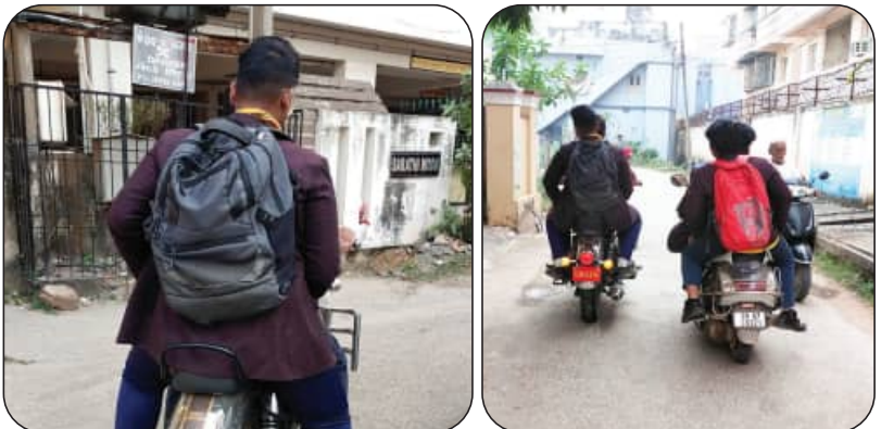
ପରିବର୍ତ୍ତେ ଏକ୍ସପ୍ରେସରେ ମୁହଁଦେଖା କାରବାର କରାଯାଉଥିବା ଅଭିଯୋଗ ହୋଇଛି । ଯଦିଓ ସତକ ଦୁର୍ଦ୍ଦିଗଣା ହେଉନଥିବାରୁ ଏହି ମାସ ତମାମ