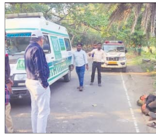
ପୁଲିସ୍ ଗ୍ରାହ୍ୟତା ନିକଟରେ ଜଣେ ଅପରିଚିତ ତଥା ଚେତାଶୂନ୍ୟ ଯୁବକ ପଡ଼ିଥିବା ସ୍ଥାନୀୟ କିଛି ଲୋକେ ଦେଖିଥିଲେ । ଯୁବକଙ୍କ ନିକଟରେ ଏକ ବ୍ୟାଗ ରହିଥିଲା । ଯୁବକଙ୍କୁ ନିଶା ଦେଇ କେହି ଲୁଚ କରିଥିବା ସନ୍ଦେହ କରାଯାଇଥିଲା । ତୁରନ୍ତ ୧୧୨ନମ୍ବରକୁ ଯୋଗାଯୋଗ କରାଯାଇଥିବା ବେଳେ ଯୁବକ ଜଣକ ଚେତାଶୂନ୍ୟ ଥିବା ଜାଣି ୧୧୨ କଣ୍ଟ୍ରୋଲ ରୁମକୁ ୧୦୮ କୁ ଯୋଗାଯୋଗ କରିବାକୁ ପରାମର୍ଶ ଦିଆଯାଇଥିଲା । ପରେ ସୁତନାବାଗା ଜଣକ ୧୦୮ କୁ ଯୋଗାଯୋଗ କରିଥିଲେ । ସେଠାରେ ମଧ୍ୟ ଦୀର୍ଘ ସମୟ ଧରି ଆବଶ୍ୟକ ତଥ୍ୟ ପ୍ରଦାନ କରିବାକୁ ପଡ଼ିଥିଲା । ମେଡିକାଲ କ୍ୟାମ୍ପସ ଭିତରେ ଘଟଣା ଘଟିଥିବା ବେଳେ ତାଙ୍କୁ ଚାକର ଖାକାର ପରିସ୍ଥିତିରେ ଆମ୍ବୁଲାନ୍ସ ଆଇ ସୁଦ୍ଧା ଉକ୍ତ ସେବା ଉପଲକ୍ଷ କରିବା ସମ୍ଭବପର ହେଉନାହିଁ ।

ବ୍ରହ୍ମପୁର, ୮ (ସମ୍ବିଧ): ସମଗ୍ର ରାଜ୍ୟରେ ଜରୁରିକାଳୀନ ସାହାଯ୍ୟଯୋଗାଣ ଯୋଗାଇ ଦେବାକୁ ଯାଇ ୧୦୮ ନମ୍ବରକୁ ବ୍ୟବହାର କରାଯାଉଛି । ସେହିଭଳି ପୁଲିସ୍ ସହାୟତା, ଅଗ୍ନିଶମ ଓ ଆମ୍ବୁଲାନ୍ସ ସେବାକୁ ଜରୁରିକାଳୀନ ସେବା ଉପଲକ୍ଷ କରାଯିବାକୁ ଯାଇ ୧୧୨ ନମ୍ବରକୁ ଜାରି କରାଯାଇଛି । ଯାହା ସଫଳତାର ସହିତ କାର୍ଯ୍ୟ ମଧ୍ୟ କରୁଛି । ତେବେ ଉଭୟ ନମ୍ବରକୁ ନେଇ ଅନେକ ସମୟରେ ଲୋକଙ୍କ ମଧ୍ୟରେ ଦ୍ୱନ୍ଦ୍ୱ ସୃଷ୍ଟି ହେବା ସହିତ ସେବା ପାଇବାରେ ହେଉଥିବା ବିକଳକୁ ନେଇ ଅସନ୍ତୋଷ ମଧ୍ୟ ଦେଖିବାକୁ ମିଳୁଛି । ୧୦୮ ନମ୍ବରକୁ କଲ କରାଗଲେ ତାହା ପ୍ରଥମେ ଭୁବନେଶ୍ୱରସ୍ଥିତ କେନ୍ଦ୍ର ସହିତ ସଂଯୋଗ ହେବାପରେ ଆବେଦନକାରୀଙ୍କ ଠାରୁ ବିଭିନ୍ନ ତଥ୍ୟ ସଂଗ୍ରହ କରାଯାଉଛି । ପରେ ନିକଟସ୍ଥ ଆମ୍ବୁଲାନ୍ସ ସେବା ଉପଲକ୍ଷ କରାଯିବାକୁ ଯାଇ ଆବେଦନକାରୀଙ୍କୁ ଦିର୍ଘ ସମୟ ଧରି ଅନଲାଇନ ଯୋଗାଣ କରେ ରହିବାକୁ ପଡ଼ୁଛି । ଏପରିକି ବିଭିନ୍ନ ସମୟରେ ହସ୍ପିଟାଲ ନିକଟରେ ଓ ହାତପାଆନ୍ତାରେ ଆମ୍ବୁଲାନ୍ସ ଆଇ ସୁଦ୍ଧା ଉକ୍ତ ସେବା ଉପଲକ୍ଷ କରିବା ସମ୍ଭବପର ହେଉନାହିଁ । ସେହିଭଳି ରାଜ୍ୟରେ ପୁଲିସ୍, ଅଗ୍ନିଶମ ଓ ଆମ୍ବୁଲାନ୍ସ ସେବା ଉପଲକ୍ଷ କରାଯିବା ପାଇଁ ଯଦିଓ ୧୧୨ ହେଲ୍ପଲାଇନ ନମ୍ବରକୁ ନିୟୋଜିତ କରି ଏକ ଦୂରଦୃଷ୍ଟି ସମ୍ପନ୍ନ ବ୍ୟବସ୍ଥା କରାଯାଇଥିଲା ତାହାର ପରିଚାଳନାରେ ସମସ୍ୟା ଦେଖିବାକୁ ମିଳୁଛି । କୌଣସି ଅପରିଚିତ ବା ଅସହାୟ ବ୍ୟକ୍ତିଙ୍କୁ ସହାୟତା ଯୋଗାଇବାକୁ ଯାଇ କେହି ଯୋଗାଯୋଗ କଲେ ୧୦୮ କୁ ଯୋଗାଯୋଗ କରିବାକୁ ପରାମର୍ଶ ଦିଆଯାଉଛି । ଅନେକ ସମୟରେ ୧୧୨ନମ୍ବରରେ ସେବା ପ୍ରଦାନ କରିବାକୁ ଆସୁଥିବା ପିସିଆର ଗାଡ଼ିରେ ଥିବା କର୍ମଚାରୀଙ୍କର କୌଣସି କ୍ଷମତା