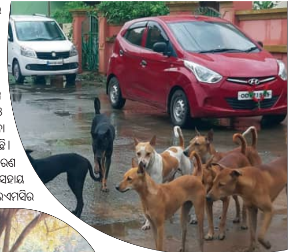
ପ୍ରତିଫଳରେ କହିଛନ୍ତି । ବିଭିନ୍ନ କାରଣରୁ ଯଦିଓ ଏସିସି କାର୍ଯ୍ୟକ୍ରମ ହାତକୁ ନିଆଯାଇ ପାରିନାହିଁ ତେବେ ମାର୍ଚ୍ଚା ସୁଦ୍ଧା ସହରରେ ଏସିସି କାର୍ଯ୍ୟକାରୀ ହେବ ବୋଲି ସେ ଦୃଢ଼ଭାବେ ପ୍ରକାଶ କରିଛନ୍ତି । ଏଥିପାଇଁ ଜାନୁଆରୀ ଶେଷ ସୁଦ୍ଧା ‘ଇଓଆଇ’ ବା ‘ଏକ୍ସପ୍ରେସନ ଅଫ୍ ଇଣ୍ଟେଣ୍ଟ’ ଆହୁାନ କରାଯିବ । ଜନସାଧାରଣଙ୍କ ଜୀବନର ସୁରକ୍ଷା ଭଳି ବୁଲ୍‌ଡାଗ୍‌କୁରଙ୍କ ସୁରକ୍ଷା ପାଇଁ ମଧ୍ୟ କିଛି ନିର୍ଦ୍ଦେଶ ନିତ୍ୟାନନ୍ଦ ରହିଛି । ସବୁକୁ ଦୃଷ୍ଟିରେ ରଖି ନିଗମ ପକ୍ଷରୁ ଆବଶ୍ୟକ ପଦକ୍ଷେପ ଗ୍ରହଣ କରାଯିବ ଓ ଏହାର ସ୍ଥାୟୀ ସମାଧାନ କରାଯିବ ବୋଲି ଶ୍ରୀ ପରିତା କହିଛନ୍ତି ।

ବ୍ରହ୍ମପୁର, ୮ (ସମ୍ବିଧ): ସହରରେ ଦିନକୁ ଦିନ ବୃଦ୍ଧି ପାଇବାରେ ଲାଗିଛି ବୁଲ୍‌ଡାଗ୍‌କୁରଙ୍କ ସଂଖ୍ୟା । ସାଙ୍ଗକୁ ଦୌରାନ୍ତ, କେତେବେଳେ କିଏ କେଉଁ ପରିସ୍ଥିତିରେ ବୁଲୁଛନ୍ତି କାମୁଡ଼ା ଖାକାର ହେଉଛି ତାହା ଜାଣିବା କଷ୍ଟକର ହୋଇପଡ଼ିଛି । ଫଳରେ ତାଙ୍କୁ ଚାକର କାମୁଡ଼ା ରୋଗୀଙ୍କ ସଂଖ୍ୟା ମଧ୍ୟ ବୃଦ୍ଧିରେ ଲାଗିଛି । ବୁଲ୍‌ଡାଗ୍‌କୁରଙ୍କ ସଂଖ୍ୟା ବୃଦ୍ଧି ହେବାର ଅଧିକ ସମ୍ଭାବନା ରହିଛି । ଏଣୁ ବୁଲ୍‌ଡାଗ୍‌କୁରଙ୍କୁ ସେମାନଙ୍କ ସ୍ଥାନରୁ ଅନ୍ୟତ୍ର ସ୍ଥାନାନ୍ତର କରିବା ନେଇ ନେତାମାନେ ଚାହୁଁଛନ୍ତି । ଏହାଛଡ଼ା ବୁଲ୍‌ଡାଗ୍‌କୁରଙ୍କୁ ନିକଟରେ ପକ୍ଷରୁ ସ୍ୱଳ୍ପ ନିର୍ଦ୍ଦେଶନା ମଧ୍ୟ ରହିଛି । ଫଳରେ ବୁଲ୍‌ଡାଗ୍‌କୁରଙ୍କ ସଂଖ୍ୟା ବୃଦ୍ଧିରେ ଲାଗିଛି । ଏହାଛଡ଼ା ବୁଲ୍‌ଡାଗ୍‌କୁରଙ୍କୁ ନିକଟରେ ପକ୍ଷରୁ ସ୍ୱଳ୍ପ ନିର୍ଦ୍ଦେଶନା ମଧ୍ୟ ରହିଛି । ଫଳରେ ବୁଲ୍‌ଡାଗ୍‌କୁରଙ୍କ ସଂଖ୍ୟା ବୃଦ୍ଧିରେ ଲାଗିଛି । ଦୀର୍ଘବର୍ଷ ପରେ ମଧ୍ୟ ସହରରେ ଆରମ୍ଭ ହୋଇ ପାରିଲାନି ‘ଏସିସି’ ଏସିସି ପରେ ବିଲ‌ଏମ୍‌ସିକୁ ଚିଠି ଲେଖିଲେ ମେଡିକାଲ୍ ଆଧ୍ୟକ୍ଷ ବଂଶ ନିୟନ୍ତ୍ରଣ କରାଯିବ କିନ୍ତୁ ସ୍ଥାନାନ୍ତରରେ ରହିଛି କଟକଣା ଉପରେ ଲୋକ ଲାଗାଇବା ପାଇଁ ଯଦିଓ (ଏସିସି) ଆନିମାଲ ବାଏ କଣ୍ଟ୍ରୋଲ ବା ପ୍ରାଣୀ ଜନ୍ମ ନିୟନ୍ତ୍ରଣ କାର୍ଯ୍ୟକ୍ରମ ରହିଛି ତାହାକୁ ଆଜି ପର୍ଯ୍ୟନ୍ତ ବ୍ରହ୍ମପୁର ଭଳି ସହରରେ କାର୍ଯ୍ୟକାରୀ କରାଯାଇ ପାରିନାହିଁ । ଏକ ପରିସ୍ଥିତିରେ ବୁଲ୍‌ଡାଗ୍‌କୁରଙ୍କ ସଂଖ୍ୟା ବୃଦ୍ଧି ଓ ଦୌରାନ୍ତ ରୋଗୀଙ୍କ ସଂଖ୍ୟା ବୃଦ୍ଧିରେ ଲାଗିଛି । ଏହାଛଡ଼ା ବୁଲ୍‌ଡାଗ୍‌କୁରଙ୍କୁ ନିକଟରେ ପକ୍ଷରୁ ସ୍ୱଳ୍ପ ନିର୍ଦ୍ଦେଶନା ମଧ୍ୟ ରହିଛି । ଫଳରେ ବୁଲ୍‌ଡାଗ୍‌କୁରଙ୍କ ସଂଖ୍ୟା ବୃଦ୍ଧିରେ ଲାଗିଛି । ଏହି ଦାୟିତ୍ୱରେ ଥିବା ଉପାୟକୁ ଆଣିବା ପରିବା ସ୍ୱଳ୍ପ ଏହି ସମସ୍ୟାର ସମାଧାନ ହେବ ବୋଲି ନିଜ ପଦକ୍ଷେପ ଗ୍ରହଣ କରାଯିବ ଓ ଏହାର ସ୍ଥାୟୀ ସମାଧାନ କରାଯିବ ବୋଲି ଶ୍ରୀ ପରିତା କହିଛନ୍ତି ।