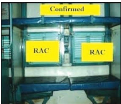
ନୂଆଦିଲ୍ଲୀ, ୨୦୧୯ (ଏକେନିଉ)

ଭାରତୀୟ ରେଳବାଇ ସଂରକ୍ଷଣ ବାଟିଲ ବିଭାଗ ବା ରିଜର୍ଭେସନ୍ ଏବଂ ଏକାଧିକ କ୍ୟାନ୍ସଲେସନ୍ (ଆର୍ଏସି) ଟିକଟଧାରୀଙ୍କୁ ପାଇଁ ଏକ ବଡ଼ ସୁବିଧା