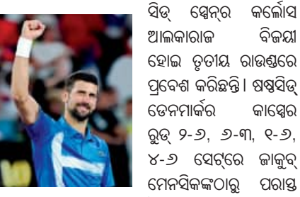
ଜୋକୋଭିଚ୍ ୨-୬, ୬-୩, ୧-୬, ୪-୬ ସେଟ୍ରେ କାନ୍ଦୁ ମେନସିକ୍ ଠାରୁ ପରାସ୍ତ ରାଉଣ୍ଡ ମ୍ୟାଚ୍ରେ ୬-୧, ୬-୬, ୬-୬, ୬-୬ ସେଟ୍ରେ ପର୍ଯ୍ୟନ୍ତ ଖେଳି ଏକକରେ ଟପ୍ ପରିଆଣ୍ଟ ପରାସ୍ତ କରି ଅଗ୍ରଗତି କରିଛନ୍ତି।

ମେଲବୋର୍ଣ୍ଣ, ୧୫ (ସମ୍ବାଦ): ଚଳିତ ମ୍ୟାଟ୍ରେକ୍ଟିକରେ ଦ୍ୱିତୀୟ ସିଡ୍ ଜର୍ମାନୀ ଅଷ୍ଟ୍ରେଲିଆନ୍ ଓପନ୍ରେ ଉତ୍ତମ ପୁରୁଷ ଓ ଆଲେକ୍ସାଣ୍ଡର ନେଭେଲ, ତୃତୀୟ ସିଡ୍ ଡେନିସ୍ ମେଡ୍ୱେଡ୍ କଲୋସ ଆଲକାରାଜ ବିଜୟ ଅଭିଯାନ କରି ରହିଛି।