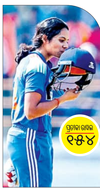
ରାଜକୋଟ, ୧୫ (ସମ୍ବାଦ): ପ୍ରତୀକ୍ଷା ରାଘବ ୧୫୪

ଭଦୋଦାର, ୧୫ (ସମ୍ବାଦ): କର୍ଣ୍ଣାଟକ ଏଥର ବିଜୟ ହଜାରେ ଗ୍ରୀଟି ଦିନିକିଆ ଟୁର୍ଣ୍ଣାମେଣ୍ଟର ପାଇନାଲରେ ପ୍ରବେଶ କରିଛି। ଏଠାରେ ରୁଧିରା ଖେଳାଯାଇଥିବା ପ୍ରଥମ ସେମିଫାଇନାଲରେ କର୍ଣ୍ଣାଟକ ୧୬ ବଲ ବାକିଆଇ ୫ ଓକେଟରେ ହରିୟାଣାକୁ ପରାସ୍ତ କରି ୫ମ ଥର ପାଇଁ ପାଇନାଲ ଟିକେଟ ହାସଲ କରିଛି।