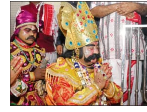
କରାଯାତରେ କୁଳକନ୍ୟା ହସ୍ତା ପ୍ରାଣ ହରାଇଥିଲା। ଶ୍ରୀକୃଷ୍ଣ, ବଳରାମଙ୍କୁ ହତ୍ୟା କରିବା ପାଇଁ କଂସ ମହାରାଜଙ୍କ ପାତ୍ରମନ୍ତ୍ରୀ,

ବରଗଡ଼, ୧୩୧୧ (ସମ୍ବିଧ): ବିଶ୍ୱର ସର୍ବବୃହତ୍ ମୁକ୍ତାକାଶ ରଙ୍ଗମଞ୍ଚ ବରଗଡ଼ ଧନୁଯାତ୍ରାର ଆଜି ପରଦା ନଈଲା। ପୌରାଣିକ ବିଷୟକୁ ଉପରେ ଆଧାରିତ ଏହି ଧନୁଯାତ୍ରା ମହୋତ୍ସବ କଂସ ବଧ ସହ ଶେଷ ହୋଇଛି। ୧୧ ଦିନ ବ୍ୟାପୀ ଗଜକଟକରେ ପାଟି ପଡ଼ୁଥିବା ଗୋପପୁର ଓ ମଥୁରାନଗରୀ ଶାନ୍ତ ପଡ଼ିଛି। ଆଜି ଅନ୍ତିମ ଦିନରେ କଂସ ବଧ ଦୃଶ୍ୟାଭିନୟ ଦେଖିବା ପାଇଁ ଲକ୍ଷାଧିକ ଲୋକଙ୍କ ସମାଗମ ହୋଇଥିଲା। ସବୁଦିନ ଭଳି କଂସ ମହାରାଜ ଗଜମହଲକୁ ମଥୁରା ଭ୍ରମଣ କରିଥିଲେ। ଭ୍ରମଣ ସାରି ସେ ଲୋକମଣ୍ଡଳ ପଡ଼ିଆସ୍ଥିତ ରଙ୍ଗ ମଞ୍ଚରେ ପହଞ୍ଚିଥିଲେ। ସେଠାରେ ଶ୍ରୀକୃଷ୍ଣ ଓ ବଳରାମଙ୍କୁ ହତ୍ୟା କରିବା ପାଇଁ ସେନାପତି, ମହାମନ୍ତ୍ରୀ, ଚାଣୁର, ମୂଷିକ ଆଦି ସୈନ୍ୟସାମନ୍ତଙ୍କ ସହ ରଣକୋଶଳ ପ୍ରସ୍ତୁତ କରିଥିଲେ। ଅନ୍ୟପକ୍ଷେ ହାତପଦା ମଞ୍ଚକୁ ଯାଇ ଶ୍ରୀକୃଷ୍ଣ ଶିବଧର ଭଙ୍ଗ କରିଥିଲେ। ତାଙ୍କ