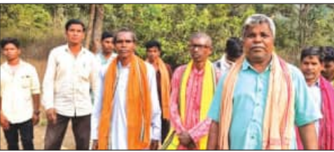
ଭୋଜିଭାତ ଦେଲେ ସମାଜରେ ମିଶିବେ

ଏହାସହ, ସମାଜକୁ ଭୋଜିଭାତ ଦେଇ ପୁଣ୍ୟ ହେଲେ ଯାଇ ସେମାନଙ୍କୁ ପୁଣିଥରେ ସାମାଜିକ କରାଯିବ ବୋଲି କୁହାଯାଇଛି।