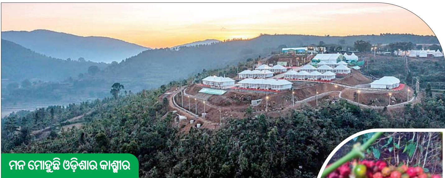
ମନ ମୋହୁଛି ଓଡ଼ିଶାର କାଶ୍ମୀର