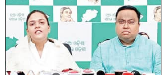
ସତସାହସ ଥିଲେ ଦୁଇ ଦିନ ଭିତରେ ଅନାୟା ଭୋଟ କରାକୁ