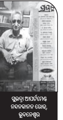
ସୁକୁମାର ଆପଟମେଣ୍ଟ ନନ୍ଦକାନନ ଗୋଡ଼, ଭୁବନେଶ୍ୱର ମୂଲ୍ୟ: ୧୫ ଟଙ୍କା