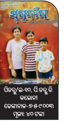
ପିତୃ/୯-୧୦ ପିତୃ/୧୧ କଲମା ଡେକୋରା-୭୫୯୦୦୩ ମୂଲ୍ୟ: ୪୦ ଟଙ୍କା