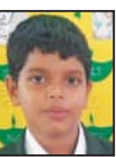
ସାବ୍ୟାନ୍ତ ଶତପଥୀ ଷଷ୍ଠ ଶ୍ରେଣୀ ମଦର୍ସ ପବ୍ଲିକ୍ ସ୍କୁଲ ପୁରୀ