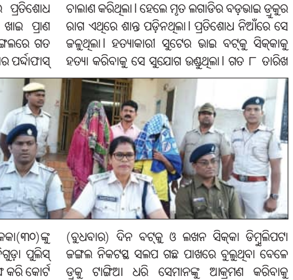
ସୂଚନାମୁତାୟ, ଗତ ୨୦୧୯ ଜାନୁଆରୀ ୧୪ ଦିନ ଉକ୍ତ ଗ୍ରାମର ଲଗାଡ଼ି ସିକକା(୩୦)କୁ ହତ୍ୟା କରାଯାଇଥିଲା।

ମୁନିଗୁଡ଼ା, ୧୧/୧୨ (ସମ୍ପାଦକ): ଭାଇ ହତ୍ୟାର ପ୍ରତିଶୋଧ ନେବାକୁ ଯାଇଥିଲେ, କିନ୍ତୁ ନିଜେ ହତ୍ୟା ଖାଇ ପ୍ରାଣ ହରାଇଲେ।