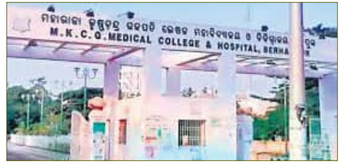
ନିଦାନ ଓ ଚିକିତ୍ସା ସେବା ନ ପାଇ ରୋଗୀ ହତ୍ତସ୍ତମ୍ଭ

ବୁଢ଼ପୁର, ୧୧/୧୨(ସମ୍ପାଦକ): ଏମକେସିଡି ମେଡିକାଲ କେନ୍ଦ୍ର ଓ ହସ୍ପିଟାଲରେ ସରକାରୀ ଛୁଟି ଦିନରେ ରୋଗୀଙ୍କୁ ମିଳୁନି ଏମଆରଆଇ ଭଳି ଗୁରୁତ୍ୱପୂର୍ଣ୍ଣ ସେବା।