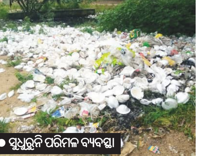
ସୁଧୁରୁନି ପରିମଳ ବ୍ୟବସ୍ଥା

ସୁବକଳ୍ୟ, ୮/୧୨(ସମିପ): ଗାଁ ପରିବେଶ ସୁସ୍ଥ ରହିଲେ ପଞ୍ଚାୟତ ସୁସ୍ଥ ରହିବ। ପଞ୍ଚାୟତ ସୁସ୍ଥ ରହିଲେ ରାଜ୍ୟ ସୁସ୍ଥ ରହିବ। ଏହି ଲକ୍ଷ୍ୟ ନେଇ କାତାୟ ଗ୍ରାମୀଣ ସ୍ୱାସ୍ଥ୍ୟ ମିଶନର ଗାଁ କଲ୍ୟାଣ ସମିତି ଭଳି ମହତ୍ତ୍ୱ ଯୋଜନା କାର୍ଯ୍ୟକାରୀ କରାଯାଇଛି।