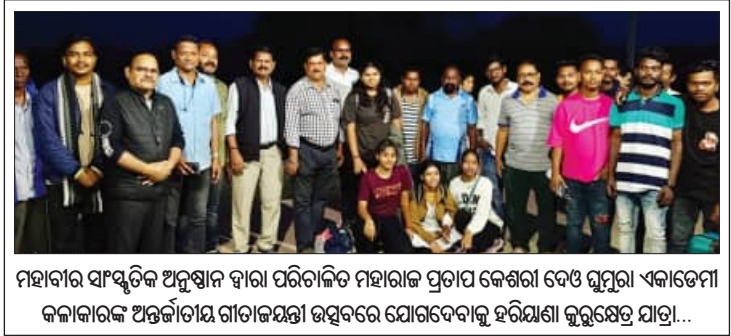
ମହାନଗର ସାଂସ୍କୃତିକ ଅନୁଷ୍ଠାନ ଦ୍ୱାରା ପରିଚାଳିତ ମହାରାଜ ପ୍ରତାପ କେଶରୀ ଦେଓ ଗୁମୁରା ଏକାଡେମୀ କଳାକାରଙ୍କ ଅଭିଭାବନା ଗାତାକଣ୍ଠା ଉତ୍ସବରେ ଯୋଗଦେବାକୁ ହରିୟାଣା କୁରୁକ୍ଷେତ୍ର ଯାତ୍ରା...

ଯୋଗାଣପୂର୍ଣ୍ଣ ପଞ୍ଚାୟତ ତୁମ୍ଭାପୁର ଗ୍ରାମରେ। ଏହି ଗାଁର ମୁଖ୍ୟମନ୍ତ୍ରୀ ପ୍ରଧାନଙ୍କ ଛାତ୍ର ଉପରେ ବିଦ୍ୟୁତ୍ ତାର କମ୍ ଉତ୍ତରରେ ଯାଇଛି। ଏହା ଛାତ୍ରରେ ଚଳୁଥିବା ଅସୁବିଧା ହେଉଛି। ଏହି ତାରକୁ ଅନ୍ୟତ୍ର ସ୍ଥାନାନ୍ତର କରିବା ପାଇଁ ମୁଖ୍ୟମନ୍ତ୍ରୀ ଅନେକ ଥର ବିଭାଗୀୟ କର୍ମଚାରୀଙ୍କୁ ଆରମ୍ଭ କରି ଅଧିକାରୀଙ୍କ ପର୍ଯ୍ୟନ୍ତ ଅଭିଯୋଗ କଲେଣି; ହେଲେ କେହି ଶୁଣୁନ ଥିବା ସେ କହିଛନ୍ତି।