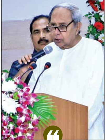
‘ଆପଣମାନଙ୍କ ଖୁସିରେ ମୋ ଖୁସି, ଶେଷ ପର୍ଯ୍ୟନ୍ତ ଶ୍ରମିକ ଭାଇଭଉଣୀଙ୍କ କଲ୍ୟାଣ ପାଇଁ କାମ କରିବି’

କାର୍ଯ୍ୟକାରୀତା ବୈଠକରେ ଉଦ୍‌ବୋଧନ ଦେଇ ବିରୋଧୀ ଦଳ ନେତା ତଥା ବିଜେଡି ସୁପ୍ରିମୋ ନବୀନ ପଟ୍ଟନାୟକ ଏହା କହିଛନ୍ତି। ନବୀନ କହିଛନ୍ତି, ବିକାଶ ଓ ସମୃଦ୍ଧିର ପ୍ରତିଟି କ୍ଷେତ୍ରରେ ଆମ ଶ୍ରମିକ ଭାଇଭଉଣୀମାନଙ୍କର ସବୁଠାରୁ ବଡ଼ ଅବଦାନ ରହିଛି। ଆପଣମାନଙ୍କର ଅବଦାନକୁ ମୁଁ ସମ୍ମାନ ଜଣାଉଛି। ମହାନ ଜନନାୟକ ବିକଳ ବାବୁ ୧୯୯୦ରେ ଶ୍ରମିକମାନଙ୍କର ସର୍ବନିମ୍ନ ମୂଲ୍ୟ ବୃଦ୍ଧି କରି ଇତିହାସ ସୃଷ୍ଟି କରିଥିଲେ। ବିକଳ ଜନତା ଦଳର ସରକାର ସମୟରେ ଆପଣମାନଙ୍କ କଲ୍ୟାଣ ପାଇଁ ଅନେକ ପଦକ୍ଷେପ ନିଆଯାଇଛି। ▶ପୃଷ୍ଠା-୭