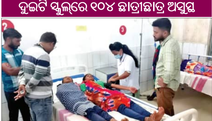
ପରିସ୍ଥିତି ସୃଷ୍ଟି କରିଛି। ଏସବୁ ଅବ୍ୟବସ୍ଥା ଘଟିଯାଇଛି। ଖରାପ ମଧ୍ୟାହ୍ନଭୋଜନ ଖାଲ ଭିତରେ ଆଜି (ଶନିବାର) ରାଜ୍ୟର ଦୁଇ ଦୁଇଟି କନ୍ୟାମାନ ଓ ବଳାଙ୍ଗିର ଜିଲ୍ଲାର ଦୁଇଟି ଧୂଳି ମୋଟ ୧୦୪ଜଣ ଛାତ୍ରଛାତ୍ରୀ ▶ପୃଷ୍ଠା-୭

■ ମୁରିବାହାଲ/ଦାରିକବାଡ଼ି, ୭।୧୨ (ସମ୍ବିଧାନ): ବିଦ୍ୟାଳୟରେ ଉପସ୍ଥାନ ବୃଦ୍ଧି ସହ ପୁଷ୍ଟି ସାଧନ ଲକ୍ଷ୍ୟରେ ଛାତ୍ରଛାତ୍ରୀମାନଙ୍କ ପାଇଁ ଜାରି ରହିଥିବା ମଧ୍ୟାହ୍ନଭୋଜନ ଯୋଜନା ଏବେ ଦିଗହରା ହୋଇଯାଇଛି। କେଉଁଠି ପାଣି ଅଭାବରୁ ଶିକ୍ଷକମାନେ ଅଙ୍ଗନବାଡ଼ି କେନ୍ଦ୍ରରୁ ଚାଉଳ ଉଧାର ଆଣି ପିଲାମାନଙ୍କୁ ଖାଇବାକୁ ଦେଉଛନ୍ତି ତ କେଉଁଠି ପନିପରିବାର ଆକାଶକୁ ଆକାଶକୁ ଦରବୃଦ୍ଧି ଖାଦ୍ୟର ମାନକୁ ନିକୁଷ୍ଟ କରିଛି। ପୁଣି କେଉଁଠି ପାଟିକାମାନଙ୍କୁ ପାରିଶ୍ରମିକ ମିଳୁ ନାହିଁ ତ କେଉଁଠି ଗ୍ୟାସ୍ କିମ୍ବା କାଠ ଅଭାବରୁ ରୋଷେଇ ହୋଇପାରୁ ନାହିଁ। ଏହାକୁ ନେଇ ଗତ ୬ ମାସ ହେଲା ରାଜ୍ୟର ବିଭିନ୍ନ ସ୍ଥାନରେ ଅଙ୍ଗନବାଡ଼ି କେନ୍ଦ୍ରଠାରୁ ଆରମ୍ଭ କରି ବିଦ୍ୟାଳୟଗୁଡ଼ିକରେ ଛାତ୍ରଛାତ୍ରୀ ଏବଂ ଅଭିଭାବକଙ୍କ ଅସନ୍ତୋଷ ଅପ୍ରତିକର