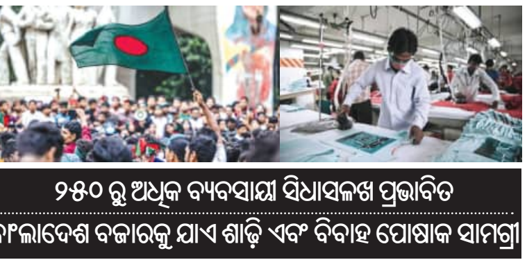
୨୫୦ ରୁ ଅଧିକ ବ୍ୟବସାୟୀ ସିଧାସଳଖ ପ୍ରଭାବିତ ବାଂଲାଦେଶ ବଜାରକୁ ଯାଏ ଶାଢ଼ି ଏବଂ ବିବାହ ପୋଷାକ ସାମଗ୍ରୀ

ବାଂଲାଦେଶରେ ସରକାର ପରିବର୍ତ୍ତନ ପରେ ବ୍ୟବସାୟିକ ପରିବେଶ ଅନିଶ୍ଚିତ ହୋଇପଡ଼ିଛି। ବ୍ୟବସାୟୀମାନେ କହିଛନ୍ତି ଯେ ଗତ ଏକ ବର୍ଷ ଧରି ବାଂଲାଦେଶର ଅବସ୍ଥା ଖରାପ ଥିଲା, କିନ୍ତୁ ନୂତନ ସରକାର ଆସିବା ପରେ ପରିସ୍ଥିତି ଆହୁରି ବିଗିଡ଼ିଯାଇଛି। ବୁଦ୍ଧି ରପ୍ତାନି ଜାରି ରହିଛି, କିନ୍ତୁ ପେମେଣ୍ଟ ଠିକ୍ ସମୟରେ ଆସୁନାହିଁ। ସୁରତରୁ ବାଂଲାଦେଶକୁ ସିଧାସଳଖ କିମ୍ବା କଲକତା ମାଧ୍ୟମରେ ସାମଗ୍ରୀ ପଠାଯାଇଥାଏ। ଏହି ଘଟଣାରେ ଭୁବନେଶ୍ୱର ହସ୍ତକ୍ଷେପ କରିବାକୁ ସଫଳ ପ୍ରଧାନମନ୍ତ୍ରୀ ନରେନ୍ଦ୍ର ମୋଦୀଙ୍କୁ ଚିଠି ଲେଖିଛି। ବ୍ୟବସାୟୀମାନେ ନିଶ୍ଚିତ ଅଛନ୍ତି ଯେ କେନ୍ଦ୍ର ସରକାର ଏହି ସମସ୍ୟାର ସମାଧାନ ପାଇଁ କୃତନୈତିକ ପଦକ୍ଷେପ ନେବେ, ଯାହା ଦ୍ୱାରା ସେମାନଙ୍କ ଅଟକାଯାଇଥିବା ଟଙ୍କା ଫେରସ୍ତ ହୋଇପାରିବ।