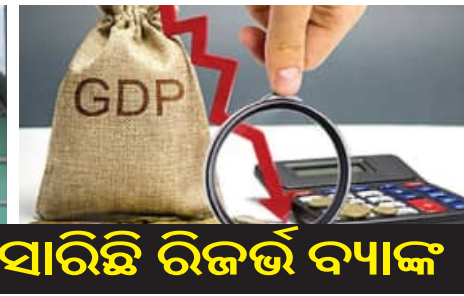
ଅଭିବୃଦ୍ଧି ଆକଳନ ୬.୨ରୁ ୬ ପ୍ରତିଶତକୁ ହ୍ରାସ ପାଇଛି। ଏହାପୂର୍ବରୁ ଆର୍ବିଆଇ ମଧ୍ୟ ଚଳିତ ଅର୍ଥନୀତିକ ବର୍ଷରେ ଭାରତର ଜିଡିପି ଅଭିବୃଦ୍ଧିକୁ ୬.୨ ପ୍ରତିଶତରୁ ୬.୬ ପ୍ରତିଶତକୁ ହ୍ରାସ ପାଇଥିଲା। ଖାସ୍ ଯାମଗ୍ରା ମୂଲ୍ୟରେ ବୃଦ୍ଧି ଏବଂ ଅର୍ଥନୀତିକ କାର୍ଯ୍ୟକଳାପରେ ହ୍ରାସ ଯୋଗୁ କେନ୍ଦ୍ରୀୟ ବ୍ୟାଙ୍କ ଭାରତର ମୁଦ୍ରାସ୍ଫୀତି ୪.୮ ପ୍ରତିଶତକୁ ବୃଦ୍ଧି ପାଇବ ବୋଲି ଆକଳନ କରିଛି। ଅପରପକ୍ଷେ ଚଳିତ ଅର୍ଥନୀତିକ ବର୍ଷର ଦ୍ୱିତୀୟ ଟ୍ରେମାସିକ (ଜୁଲାଇ-ସେପ୍ଟେମ୍ବର)ରେ ଦେଶର

ଅଭିବୃଦ୍ଧି ୬ ପ୍ରତିଶତ ରହିବ ବୋଲି ରିଜର୍ଭ ବ୍ୟାଙ୍କ ଆକଳନ କରିଥିଲେ ସୁଦ୍ଧା ଏହା ୫.୪ ପ୍ରତିଶତ ଅର୍ଥାତ୍ ୬ ଟ୍ରେମାସିକ ସର୍ବନିମ୍ନ ଚସ୍ତ୍ରରେ ରହିଥିଲା। ତେବେ ଭାରତର ଏହି ଅଭିବୃଦ୍ଧି ଇଣ୍ଡିଏନ୍ ଉତ୍ତମ ରବି ପଏଲ ଏବଂ ସେବା କ୍ଷେତ୍ର ସହ ବୃଦ୍ଧି କୁଳ ମୂଲ୍ୟ ଆଣ୍ଡାଠାରୁ କମ୍ ରହିବ। ଯୋଗୁ ଆଗକୁ ବଢ଼ିବ ବୋଲି ଏଡିବି ପକ୍ଷରୁ ରିପୋର୍ଟରେ କୁହାଯାଇଛି। ଏତଦ୍ୱ୍ୟତୀତ ଏଡିବି ଦକ୍ଷିଣ-ପୂର୍ବ ଆକଳନ ୪.୫ ପ୍ରତିଶତରୁ ୪.୬ ପ୍ରତିଶତକୁ ବୃଦ୍ଧି କରାଯାଇଛି। ଆଗାମୀ ଟ୍ରେମାସିକରେ ଆର୍ବିଆଇ କାର୍ଯ୍ୟକଳାପରେ କେତେକଂଶରେ ପ୍ରଧାନ ଆସିବ ବୋଲି ଏଡିବି ପକ୍ଷରୁ ରିପୋର୍ଟରେ ଦର୍ଶାଯାଇଛି। ଏକେନି ଚାଲିନା ଅଭିବୃଦ୍ଧି ଆକଳନ ଚଳିତବର୍ଷ ପାଇଁ ୪.୮ ପ୍ରତିଶତ ଏବଂ ଆସନ୍ତା ବର୍ଷ ପାଇଁ ୪.୫ ପ୍ରତିଶତରେ ଅପରିବର୍ତ୍ତିତ ରଖିଛି। ହେଲେ ଆମେରିକାର ନବ ନିର୍ବାଚିତ ରାଷ୍ଟ୍ରପତି ଡୋନାଲ୍ଡ ଟ୍ରମ୍ପ ଦେଶର ନୀତିରେ ଆଣିବାକୁ ଥିବା ପରିବର୍ତ୍ତନ ଦାର୍ଯ୍ୟକାଳୀନ ଭିତ୍ତିରେ କ୍ଷେତ୍ରର ଅଭିବୃଦ୍ଧିକୁ ପ୍ରଭାବିତ କରିପାରେ।