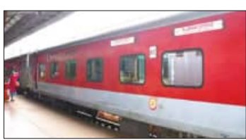
ଗୁରୁତର ରଖି ଆଗକୁ ବଢ଼ିବାର ଆବଶ୍ୟକତା ରହିଛି। ନୂଆ ବିଧେୟକ ବିଭିନ୍ନ ପ୍ରକ୍ରିୟାରେ କାମକୁ ସରଳୀକରଣ କରିବ। ରେଳ ବୋର୍ଡ ସମ୍ପୂର୍ଣ୍ଣ ନେଇ ମିଳି ପ୍ରଚାର ପୋଲି ହୋଇଛି। ଏହା ଉପରେ ବିରୋଧୀ ବେଶ କିଛି ସମୟ ଗୃହଣ ହେବାରୁ କମିଥିଲା। ଏହୁ ମଧ୍ୟରେ ରେଳ ମନ୍ତ୍ରୀ ନୂଆ ବିଧେୟକ ଏବଂ ସାଫସତ

ନୂଆଦିଲ୍ଲୀ, ୧୨ ଡିସେମ୍ବର (ଏକେନି): ଦୀର୍ଘ ଦିନର ହୋଇଛି ଯେ ଲୋକସଭାରେ ଗୃହଣ କରାଯାଇଥିବା (ସଂଶୋଧନ) ବିଧେୟକ ୨୦୧୪ ଗୃହୀତ ହୋଇଯାଇଛି। କେନ୍ଦ୍ର ରେଳ ମନ୍ତ୍ରୀ ଅଶିଷ୍ଟା ବିଶ୍ୱାସ କହିଛନ୍ତି ଯେ ଅନେକ ସାଫସତ ରେଳବାଇର ଘରୋଇକରଣ ହେଉଥିବା ନେଇ ଭ୍ରାନ୍ତି ସୃଷ୍ଟି କରିବା ପାଇଁ ଉଦ୍ୟମ କରିଛନ୍ତି। ହେଲେ ଏହି ବିଧେୟକ ଆସିବା ଦ୍ୱାରା ରେଳବାଇର ଘରୋଇକରଣ ହେବାର କୌଣସି ପ୍ରଶ୍ନ ଉଠୁନାହିଁ ବୋଲି ରେଳମନ୍ତ୍ରୀ ଗୃହଣ ଆଶ୍ୱାସୀୟା ଦେଇଛନ୍ତି।