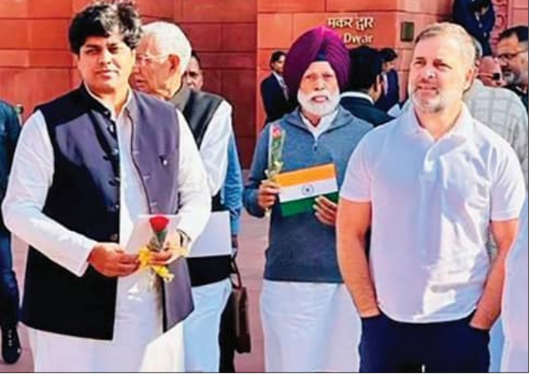
ସଂସଦ ଭବନ ବାହାରେ ଜାତୀୟ ପତାକା ଓ ପୁଲି ଦେଇ ବିରୋଧୀ ସଦସ୍ୟଙ୍କ ପ୍ରତିବାଦ