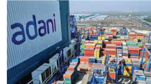
ପ୍ରଭାବକୁ ସୀମିତ ରଖିବା ଲକ୍ଷ୍ୟରେ ଏଥିସହ ଜଡ଼ିତ ଥିଲା। କଲମ୍ବୋ ଷ୍ଟେସ୍ ଇଣ୍ଡରନିୟାମାଲ ଟର୍ମିନାଲ ପ୍ରକଳ୍ପର ଅଧିକାଂଶ କାର୍ଯ୍ୟ ସମାପ୍ତ ହୋଇଛି। ଏଥିରେ ଆଦାନୀ ପୋର୍ଟର ୫୨% ଅଂଶଧନ ରହିଛି। ଏହି ପ୍ରକଳ୍ପର କାର୍ଯ୍ୟ ୨୦୧୧ ସେପ୍ଟେମ୍ବରରେ ଆରମ୍ଭ ହୋଇଥିଲା। କଲମ୍ବୋ

ଆବେଦନ ପ୍ରତ୍ୟାହାର କରିନେଇଛି। ଏହି ପ୍ରକଳ୍ପ କାର୍ଯ୍ୟ ଜାରି ରହିଛି ଏବଂ ଆସନ୍ତା ବର୍ଷ ଏହା ଶେଷ ହେବ ବୋଲି କମ୍ପାନୀ କହିଛି। ଆଦାନୀ ଗ୍ରୁପ କମ୍ପାନୀ ଏହା ମଧ୍ୟ କହିଛି ଯେ ଏହା ନିଜସ୍ୱ ଉତ୍ପାଦ ଏହି ପ୍ରକଳ୍ପକୁ ପାଣି ଯୋଗାଇବ। ଆମେରିକାର ଡେଭଲପମେଣ୍ଟ ଫାଉଣ୍ଡେସନ୍ କର୍ମଚାରୀଙ୍କ ଗତ ବର୍ଷ ନଭେମ୍ବରରେ 'କଲମ୍ବୋ ଷ୍ଟେସ୍ ଇଣ୍ଡରନିୟାମାଲ ଟର୍ମିନାଲ' ପ୍ରକଳ୍ପ ପାଇଁ ୫୫୩ ନିୟୁଟ୍ ଆମେରିକୀୟ ଡଲାର ରଖି ପ୍ରଦାନ କରିବାକୁ ରାଜି ହୋଇଥିଲା। ଏହି ଟର୍ମିନାଲକୁ ଆଦାନୀ ବନ୍ଦର, ଶ୍ରୀଲଙ୍କା କମ୍ପାନୀ ଜର୍ କେଏଲ୍ ହୋଲ୍ଡିଂସ୍ ପିଏଲସି ଏବଂ ଶ୍ରୀଲଙ୍କା ବନ୍ଦର ପ୍ରାଧିକରଣ (ଏସ୍‌ଏଲପିଏ) ମିଳିତ ଭାବେ ବିକଶିତ କରାଯାଇଛି। ବର୍ତ୍ତମାନ ପର୍ଯ୍ୟନ୍ତ ଡିଏସ୍‌ସି ଏହି ପ୍ରକଳ୍ପ ପାଇଁ ଆଦାନୀ ପୋର୍ଟକୁ