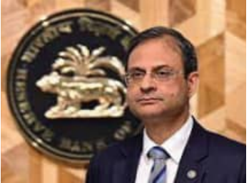
ଦେଶର ଅର୍ଥନୀତି ବିକାଶରେ ରିଜର୍ଭ ବ୍ୟାଙ୍କ ମଧ୍ୟ ଏକ ଗୁରୁତ୍ୱପୂର୍ଣ୍ଣ ଭୂମିକା ଗ୍ରହଣ କରିଥାଏ। ବିଗତ ବର୍ଷଗୁଡ଼ିକରେ ଆର୍ବିଆଇର କାର୍ଯ୍ୟ ପ୍ରଶଂସାଯାଏ। ଏହାର ଉତ୍ତରାଧିକାରୀ ଭାବେ ତାହାକୁ ଆଗକୁ ବଢ଼ାଇବାକୁ ସେ ଚେଷ୍ଟା କରିବେ। ନୀତିରେ ସ୍ଥିରତା ଆଣିବା ସହୁଡ଼ାକୁ ଗୁରୁତ୍ୱପୂର୍ଣ୍ଣ। ଏହି ଅବସରରେ ସେ ସୁନିଶ୍ଚିତ କରିଛନ୍ତି ଯେ, ଯାହା ବି ଜନସାଧାରଣଙ୍କ ସ୍ୱାର୍ଥରେ ନିଶ୍ଚଳ ନିଆଯିବ ବୋଲି ସେ କହିଛନ୍ତି।

ନୂଆଦିଲ୍ଲୀ, ୧୨ ଡିସେମ୍ବର (ଏକେନି): ଭାରତୀୟ ରିଜର୍ଭ ବ୍ୟାଙ୍କ (ଆର୍ବିଆଇ)ର ନୂଆ ଗଭର୍ଣ୍ଣର ଭାବେ ଆଜି ଦାୟିତ୍ୱ ଗ୍ରହଣ କରିଛନ୍ତି ସଞ୍ଜୟ ମାଲହୋତ୍ରା। ନୂଆଦାୟିତ୍ୱ ପରେ ଶ୍ରୀ ମାଲହୋତ୍ରା କହିଛନ୍ତି ଯେ ଦେଶର ଅର୍ଥନୀତି, ଅଭିବୃଦ୍ଧି ହାର ଏବଂ ମୁଦ୍ରାସ୍ଫୀତି ସହ ଜଡ଼ିତ ସମସ୍ତ ଦିଗ ଉପରେ ସେ ଦୃଷ୍ଟି ଅଧ୍ୟୟନ କରିବେ। ତାଙ୍କର ପ୍ରାଥମିକତା ହେଉଛି ବ୍ୟାଙ୍କିଙ୍ଗ ବ୍ୟବସ୍ଥାକୁ ମଜବୁତ କରିବା ଏବଂ ଆର୍ଥିକ ସ୍ଥିରତା ବଜାୟ ରଖିବା। ସେ ଆର୍ବିଆଇ ଗଭର୍ଣ୍ଣର ଶକ୍ତିକାନ୍ତ ଦାସଙ୍କ ସ୍ଥାନ ନେଇଛନ୍ତି। ଶ୍ରୀ ଦାସଙ୍କ କାର୍ଯ୍ୟକାଳ ଡିସେମ୍ବର ୧୦ରେ ଶେଷ ହୋଇଛି। ଶ୍ରୀ ମାଲହୋତ୍ରା କହିଛନ୍ତି ଯେ, ଆର୍ବିଆଇ ଗଭର୍ଣ୍ଣର ପଦ ଗ୍ରହଣ କରିବା ତାଙ୍କ ପାଇଁ ଗୌରବର ବିଷୟ, କିନ୍ତୁ ମୁଖ୍ୟ ଭାବରେ ଏହା ମଧ୍ୟ ଏକ ବଡ଼ ଦାୟିତ୍ୱ। ଆର୍ବିଆଇର ଦାୟିତ୍ୱ କେବଳ ବ୍ୟାଙ୍କିଙ୍ଗ କ୍ଷେତ୍ରରେ ସୀମିତ ନୁହେଁ।