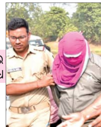
ଦୁର୍ଘଟ ଅଭିଯୋଗର ଭୟଙ୍କର ପ୍ରତିଶୋଧ

■ ରାଉରକେଲା, ୧୧/୧୨ (ସଂକେତ): ଦୁର୍ଘଟ ଅଭିଯୋଗର ଭୟଙ୍କର ପ୍ରତିଶୋଧ ନେଇ କେଲି ପେରନ୍ତା ହତାଶ ପ୍ରେମିକା କେଲିରୁ ପେରି ପ୍ରେମିକାକୁ ଖଣ୍ଡ ଖଣ୍ଡ କରି କାଟି ଅତ୍ୟନ୍ତ ନୃଶଂସ ଭାବେ ହତ୍ୟା କରିଛି । ଝାରସୁଗୁଡ଼ାରୁ ପ୍ରେମିକାକୁ ଅପହରଣ କରିବା ପରେ ରାଉରକେଲାରେ ହତ୍ୟା କରିଛି । ପରେ ଖଣ୍ଡବିଖଣ୍ଡିତ ଶରୀରକୁ ପୋଖରୀ ଓ ବ୍ରାହ୍ମଣୀ ନଦୀରେ ଫିଙ୍ଗି ଦେଇଛି । ପୁଲିସ ରାଉରକେଲାର ତରକେରା ନିକଟସ୍ଥ ଏକ ପୋଖରୀରୁ ଯୁବତୀର କଟାମୁଣ୍ଡ, ହାତ ଗୋଡ଼ ଓ ବ୍ରାହ୍ମଣୀ ନଦୀରୁ ଖଣ୍ଡବିଖଣ୍ଡିତ ଗଣ୍ଡିକୁ ଉଦ୍ଧାର କରିବା ।