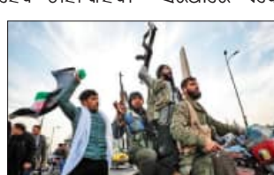
ଆଲ-ଏସ୍ ଠିକଣାରେ ଆମେରିକାର ବୋମାମାଡ଼ ଅସ୍ତ୍ରଭଣ୍ଡାର ନଷ୍ଟକଲା ଇସ୍ରାଏଲ ଗୋଲାନ୍ ହାଇଟସ୍ରେ ବହୁ ଅଞ୍ଚଳ ଦଖଲ

ଦାମାସ୍କସ୍, ୯।୧୨ (ଏକେନିଉ): ବିଦ୍ରୋହୀ ଗୋଷ୍ଠୀ ସିରିଆକୁ ଦଖଲ କରିବା ପରେ ରାଷ୍ଟ୍ରପତି ଅଲ ଅସାଦ ଇସ୍କ୍ରାଫା ଦେବା ସହିତ ଦେଶ ଛାଡ଼ି ରୁଷିଆରେ ଆଶ୍ରୟ ନେଇଛନ୍ତି। ଅସାଦ ଏବଂ ତାଙ୍କ ପରିବାରକୁ ରୁଷିଆ ରାଜନୈତିକ ଆଶ୍ରୟ ଦେଇଛି। ଏହାଦ୍ୱାରା ବିଗତ ୫୪ ବର୍ଷ ଧରି ସିରିଆରେ ଶାସନ ଚଳାଇଥିବା ଅସାଦ ପରିବାରର ରାଜୁତି ଶେଷ ହୋଇଛି। ଅସଦ ପରିବାରର ଏକଜୁଟିତା ଶାସନକୁ ବିରୋଧ କରି ୨୦୧୧ରୁ ସିରିଆରେ ବିଦ୍ରୋହର ସୂତ୍ରପାତ ହୋଇଥିଲା ବେଳେ ଏବେ କ୍ଷମତା ବିଦ୍ରୋହୀଙ୍କ ହାତକୁ ଯାଇଛି। ବର୍ତ୍ତମାନ ଏଠାକାର ଗଣତାନ୍ତ୍ରିକ ଚାଷ୍ଟାରେ ସରକାର ଗଠନ କରି ସିରିଆ ନାଗରିକଙ୍କୁ ସୁଧିଧା ସୁଯୋଗ ଦେବାକୁ ପ୍ରୟାସ ଆରମ୍ଭ ହୋଇଛି। ସିରିଆରେ କ୍ଷମତା ଦଖଲ କରିଥିବା ପ୍ରମୁଖ ବିଦ୍ରୋହୀ ସଂଗଠନ ହାୟର ଟେହରିର ଅଲ ସାଫ୍ (ଏଚଟିଏସ୍) ମୁଖ୍ୟ ଅହ୍ମ ମହମ୍ମଦ ଅଲ ଜୋଲାନି ନୂଆ ସରକାର ଗଠନ ବେଳେ ସୋମବାର ଦାମାସ୍କସ୍ରେ ମସଜିଦ୍ରେ ନିଜର ବକ୍ତବ୍ୟ ରଖିଛନ୍ତି। କିନ୍ତୁ ସିରିଆର ସାମ୍ପ୍ରତିକ ସ୍ଥିତି ଯେଭଳି ରହିଛି ତାହାକୁ ବିଚାରକଲେ ନୂଆ ସରକାର ଗଠନ ହେବା ପରେ ଏଠାରେ ଶାନ୍ତି ଫେରିବ କି ନାହିଁ ତାହା ପ୍ରଶ୍ନବାଚୀ ଦୃଷ୍ଟି କରିଛି। କାରଣ ରାଜନୈତିକ ଏବଂ ଆଞ୍ଚଳିକ କାରଣକୁ ନେଇ ସିରିଆର ବିଭିନ୍ନ ପୁଲିସ୍ ବ୍ୟାପାର। ଏହିପ୍ରକରେ ଆମେରିକା ଏବଂ ଇସ୍ରାଏଲ ସୋମବାର ସିରିଆରେ ଯେଭଳି ଆଭିମୁଖ୍ୟ ପ୍ରଦର୍ଶନ କରିଛନ୍ତି ତାହା ଏହି ଆଞ୍ଚଳିକ ଦୃଷ୍ଟିରେ ସିରିଆର ପୁଣି ଆତଙ୍କବାଦ ମୁଖ୍ୟ ଚେତକି ବୋଲି ଆଖ୍ୟା ପ୍ରକଟ କରି ଆମେରିକା ଏବଂ ଇସ୍ରାଏଲ ତୁରନ୍ତ ପଦକ୍ଷେପ ଗ୍ରହଣ କରିବେ ସହିତ ସୋମବାର ଘନ ଘନ ଆକ୍ରମଣ କରିଛନ୍ତି। ଏଚଟିଏସ୍ ସିରିଆର ଅଲ-କାଏଦା ଆତଙ୍କବାଦୀ ଶାଖାକୁ ଉପରେ ଲାଭ କରିବା ସହିତ ଏକ ଜିହାଦୀ ଗୋଷ୍ଠୀ ଭାବେ କାର୍ଯ୍ୟ କରୁଥିବାରୁ ଏହି ଦୁଇ ରାଷ୍ଟ୍ର ଏଚଟିଏସ୍ ଆଭିମୁଖ୍ୟକୁ ନେଇ ସହିଦାନ ହୋଇପଡ଼ିଛନ୍ତି।