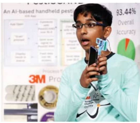
ପାକଙ୍କ ଏବଂ ଟମାଟୋ ଉପରେ ପରୀକ୍ଷା କରୁଥିଲେ। ଉପକରଣଟି ୮୫ ପ୍ରତିଶତ ସଫଳତା ପ୍ରଦାନ କରିଥିଲା। ଏନେଇ ସେ ଅଧିକ ପରୀକ୍ଷାନିରୀକ୍ଷା ଚଳାଇଛନ୍ତି।