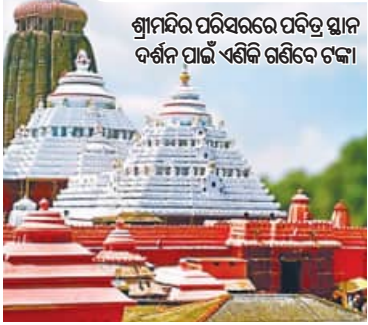
ଶ୍ରୀମନ୍ଦିର ପରିସରରେ ପବିତ୍ର ସ୍ନାନ ଦର୍ଶନ ପାଇଁ ଏଣିକି ଗଣିବେ ଟଙ୍କା

■ ପୁରୀ, ୯୧୨ (ସମିପ): ଶ୍ରୀମନ୍ଦିର ପରିସର ଏବଂ ମନ୍ଦିର ବାହାରେ ଏକାଧିକ ପବିତ୍ର ପାଠ ବା ସ୍ନାନ ରହିଛି। ଏଗୁଡ଼ିକ ମଧ୍ୟରେ ରୋଷଘର, କୋଇଲି ବୈକୁଣ୍ଠ, ନାଳାଚଳ ଉପବନ, ନରେନ୍ଦ୍ର ପୁଷ୍କରିଣୀ ପ୍ରଭୃତି ରହିଛି। ଏସବୁ ଶ୍ରୀମନ୍ଦିର ପ୍ରଶାସନ ଅଧୀନରେ ରହିଛି। ମହାପ୍ରଭୁଙ୍କୁ ପ୍ରତିଦିନ ଦର୍ଶନ କରିବାକୁ ଆସୁଥିବା ଶ୍ରଦ୍ଧାଳୁଙ୍କ ମଧ୍ୟରୁ ଅଧିକାଂଶ ଏହିସବୁ ସ୍ନାନକୁ ବୁଲି ଯାଆନ୍ତି। କିନ୍ତୁ ଆସ୍ଥା ଓ ବିଶ୍ୱାସର ଏହି ।