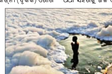
କେନ୍ଦ୍ରୀୟ ଜଳ କମିଶନଙ୍କ ରିପୋର୍ଟ