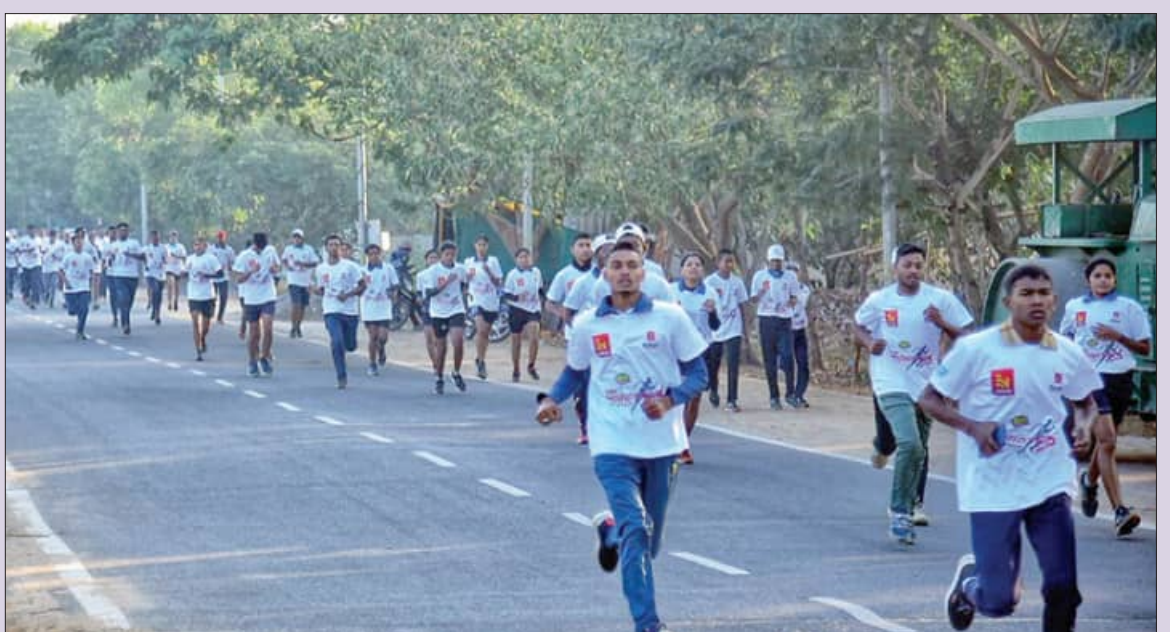
'ସକାଳ' ଓ 'ନବିନ୍ଦୋଷ ଚିତ୍ତି' ପକ୍ଷରୁ ଅନୁଷ୍ଠିତ ମିନି ମାରାଥନ୍ରେ ଅଂଶଗ୍ରହଣ କରିଥିବା ପ୍ରତିଯୋଗୀ