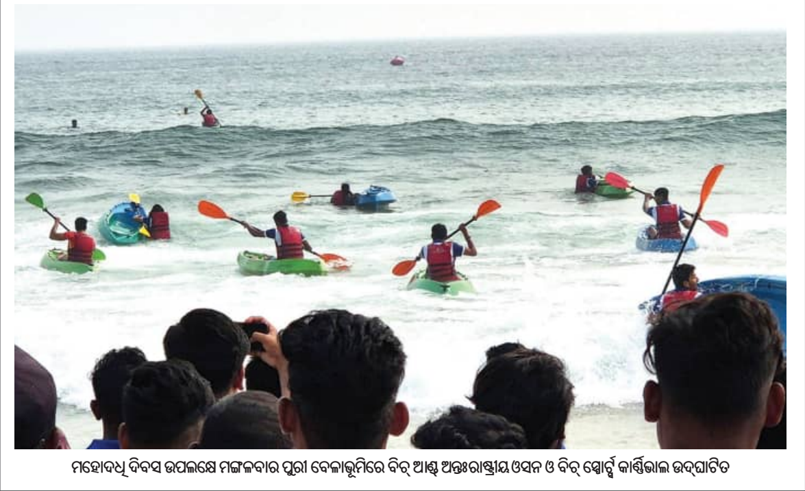
ମହୋଦଧି ଦିବସ ଉପଲକ୍ଷେ ମଙ୍ଗଳବାର ପୁରୀ ବେଳାକୁମ୍ଭୀରେ ବିଭିନ୍ନ ଆକାରର ଅନୁଷ୍ଠାନ ଓ ସମ୍ପ୍ରଦାୟର ବିଭିନ୍ନ ଶାଖାରେ କାର୍ଯ୍ୟକ୍ରମ ଉଦ୍ଘାଟିତ