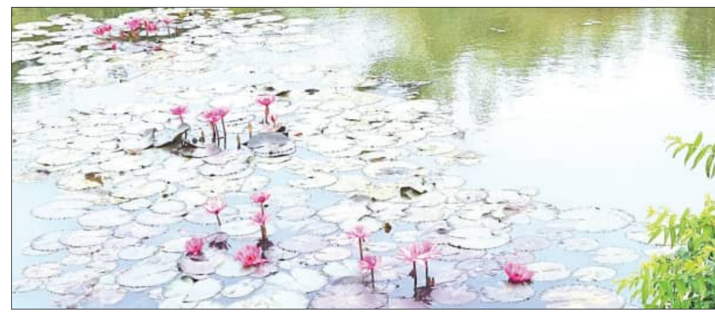
ଯୋଖାରେ ପୁଟିଲି ଲାଲ୍ କର୍ମପୁଲ୍: ବାଗୋଇଲ୍ କରୁଛି ବିମୋହିତ (ଫଟୋ-ସୋସୋ)