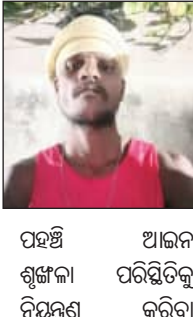
ପହଞ୍ଚି ଆଇନ ଶୁଖିଳା ପରିସ୍ଥିତିକୁ ନିୟନ୍ତ୍ରଣ କରିବା

ଶକର (୨୬)। ତାଙ୍କ ଘର ବକ୍ସବଜାର ପ୍ରେମସେନ୍ ଲେନ୍ ଅଞ୍ଚଳର ରୋଡ଼ାମ ଘରରେ। ଏହି ଦୁର୍ଘଟଣାରେ ଆଉ ଜଣେ ଶ୍ରମିକ ଆହତ ହୋଇ ଏସ୍‌ସିଏରେ ଚିକିତ୍ସିତ ହେଉଛନ୍ତି। ଘଟଣାସ୍ଥଳରେ ସମୁଦାୟ ୫ଜଣ ଶ୍ରମିକ କାର୍ଯ୍ୟ କରୁଥିଲେ। କୌଣସି ଶ୍ରମିକଙ୍କ ପାଇଁ ସୁରକ୍ଷା ବ୍ୟବସ୍ଥା ଗ୍ରହଣ କରାଯାଇ ନଥିଲା। ନିର୍ମାଣସାଧନ ଡ୍ରେନ୍ କଡ଼ରେ ଥିବା ପୁରାତନ ପାଟେଲଟି ହଠାତ୍ ଲୁହୁଡ଼ି ପଡ଼ିବାକୁ ୨ଜଣ ଶ୍ରମିକ ଚାପି ହୋଇ ରହିଯାଇଥିଲେ। ସ୍ଥାନୀୟ ଲୋକଙ୍କ ସହଯୋଗରେ ଦୁର୍ଘଟଣା ଉଦ୍ଧାର