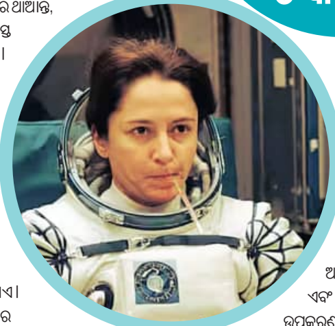
ମହାକାଶଚାରୀଙ୍କ ନିମନ୍ତେ ବ୍ୟାଣ୍ଡେଜ୍, ପେନ୍‌କିଲର, କ୍ଲିଷ୍ଟି ଏବଂ କିଛି ସର୍ଜିକାଲ୍ ସାମଗ୍ରୀ ରହିଥାଏ। ଗମ୍ଭୀର ସ୍ଥିତି ପାଇଁ କିଛି ମହାକାଶଯାନରେ ଅଣ୍ଟିକେନ୍ଦ୍ର ସିଲିଣ୍ଡର ଏବଂ କେଣ୍ଟିଲେଟର ଆଦି ଉପକରଣ ଥାଏ। ଏହା ଦ୍ୱାରା ପୃଥିବୀପୃଷ୍ଠ ଡାକ୍ତରମାନେ ଭିଡିଓକଲ୍ ତଥା ଯୋଗାଯୋଗ ମାଧ୍ୟମରେ ମହାକାଶଚାରୀଙ୍କ ଚିକିତ୍ସା କରିଥାନ୍ତି। ମହାକାଶରେ ସମସ୍ତ ସମସ୍ୟାକୁ ସାମ୍ନା କରିବାକୁ ସେଠାକାର ବାତାବରଣରେ ଖାସ୍‌ଖାସ୍‌ ଚିକିତ୍ସା ମହାକାଶଚାରୀଙ୍କୁ ପୂର୍ବରୁ ତାଲିମ ଦିଆଯାଇଥାଏ। ଯାତ୍ରା ସମୟରେ ସେମାନଙ୍କୁ କିଛି ଔଷଧ ଏବଂ ଭିଟାମିନ୍ ବଟିକା ମଧ୍ୟ ଦିଆଯାଇଥାଏ। ବେଳେବେଳେ ଡାକ୍ତରଙ୍କୁ ମହାକାଶକୁ ଯାତ୍ରା ରୁପେ ପଠାଯାଇଥାଏ। ଉଦାହରଣ ସ୍ୱରୂପ ନାସାର କିଛି ମିଶନରେ ଡାକ୍ତର ମହାକାଶକୁ ଯାତ୍ରା କରିଥିବା ଦେଖିବାକୁ ମିଳିଥିଲା।

ମହାକାଶଚାରୀମାନେ ମହାକାଶକୁ ବିଭିନ୍ନ ପ୍ରକାର ଗବେଷଣା ପାଇଁ ଯାଇଥାନ୍ତି। ମହାକାଶଚାରୀମାନେ ପୃଥିବୀ ପୃଷ୍ଠରୁ ବହୁ ଦୂରରେ ଭିନ୍ନ ଏକ ପରିବେଶରେ ରହିଥାନ୍ତି। ଏହି ସମୟରେ ସେମାନଙ୍କ ସ୍ୱାସ୍ଥ୍ୟ ଉପରେ ଅଧିକ ପ୍ରଭାବ ପଡ଼ିଥାଏ। ତେବେ ମହାକାଶରେ ସ୍ୱାସ୍ଥ୍ୟ ବିଗ୍ଗିଡ଼ିଲେ, କେମିତି ଚିକିତ୍ସା କରାଯାଏ, ସେଠାରେ କ'ଣ ଡାକ୍ତର ଥାଆନ୍ତି, ଏହା ଜାଣିବାକୁ ସମସ୍ତେ ଆଗ୍ରହ ପ୍ରକାଶ କରନ୍ତି। ବାସ୍ତବ କଥା ହେଉଛି, ମହାକାଶ ବାତାବରଣ ପୃଥିବୀ ଠାରୁ ସମ୍ପୂର୍ଣ୍ଣ ଭିନ୍ନ। ଏହା ଦ୍ୱାରା ମହାକାଶରେ ବିକିରଣ ସ୍ତର ଅଧିକ ଥିବାରୁ ଏଠାରେ କର୍କଟ ହେବାର ଆଶଙ୍କା ଅଧିକ ରହିଥାଏ। ସେହିପରି ମହାକାଶରେ ଖାଦ୍ୟପେୟ ଶୈଳୀ ପୃଥିବୀପୃଷ୍ଠ ଠାରୁ ଭିନ୍ନ ହୋଇଥିବାରୁ ପାଚନଜନିତ ସମସ୍ୟା ଦେଖାଯାଇଥାଏ। ପୃଥିବୀପୃଷ୍ଠରୁ ମହାକାଶରେ ମହାକାଶଚାରୀଙ୍କୁ ଏକାକୀ ରହିବାକୁ ପଡ଼ିଥାଏ। ଏକାକୀପଣରୁ ମାନସିକ ଚିନ୍ତା ବୃଦ୍ଧିପାଇଥାଏ। ସେହିପରି ମହାକାଶଚାରୀ ଯାତ୍ରା ସାରି ଫେରିବା ପରେ ପ୍ରାୟତଃ ଉଚ୍ଚହାନତାର ଶିକାର ହୋଇଥାନ୍ତି। ଯଦିଓ ମହାକାଶରେ ଡାକ୍ତର ନ ଥାନ୍ତି, ହେଲେ ଏଠାରେ ମହାକାଶଚାରୀଙ୍କ ଚିକିତ୍ସା ପାଇଁ ବିଭିନ୍ନ ପ୍ରକାର ଚିକିତ୍ସା ଉପକରଣ ମହତ୍ତ୍ୱ ରହିଥାଏ। ଯଦ୍ୱାରା ଜଣେ ନିଜର ଷୋର୍ଟମୋଟ୍ ରୋଗର ନିରାକରଣ କରିପାରିବେ। ଏଠାରେ ମହାକାଶଚାରୀଙ୍କ ନିମନ୍ତେ ବ୍ୟାଣ୍ଡେଜ୍, ପେନ୍‌କିଲର, କ୍ଲିଷ୍ଟି ଏବଂ କିଛି ସର୍ଜିକାଲ୍ ସାମଗ୍ରୀ ରହିଥାଏ। ଗମ୍ଭୀର ସ୍ଥିତି ପାଇଁ କିଛି ମହାକାଶଯାନରେ ଅଣ୍ଟିକେନ୍ଦ୍ର ସିଲିଣ୍ଡର ଏବଂ କେଣ୍ଟିଲେଟର ଆଦି ଉପକରଣ ଥାଏ। ଏହା ଦ୍ୱାରା ପୃଥିବୀପୃଷ୍ଠ ଡାକ୍ତରମାନେ ଭିଡିଓକଲ୍ ତଥା ଯୋଗାଯୋଗ ମାଧ୍ୟମରେ ମହାକାଶଚାରୀଙ୍କ ଚିକିତ୍ସା କରିଥାନ୍ତି। ମହାକାଶରେ ସମସ୍ତ ସମସ୍ୟାକୁ ସାମ୍ନା କରିବାକୁ ସେଠାକାର ବାତାବରଣରେ ଖାସ୍‌ଖାସ୍‌ ଚିକିତ୍ସା ମହାକାଶଚାରୀଙ୍କୁ ପୂର୍ବରୁ ତାଲିମ ଦିଆଯାଇଥାଏ। ଯାତ୍ରା ସମୟରେ ସେମାନଙ୍କୁ କିଛି ଔଷଧ ଏବଂ ଭିଟାମିନ୍ ବଟିକା ମଧ୍ୟ ଦିଆଯାଇଥାଏ। ବେଳେବେଳେ ଡାକ୍ତରଙ୍କୁ ମହାକାଶକୁ ଯାତ୍ରା ରୁପେ ପଠାଯାଇଥାଏ। ଉଦାହରଣ ସ୍ୱରୂପ ନାସାର କିଛି ମିଶନରେ ଡାକ୍ତର ମହାକାଶକୁ ଯାତ୍ରା କରିଥିବା ଦେଖିବାକୁ ମିଳିଥିଲା।