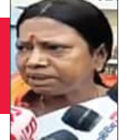
ବିକେଡ଼ି ସରକାର ଅମଳରେ ପୂର୍ବରୁ ହୋଇଥିଲା ଯଦି ଧରନ୍ତୁ