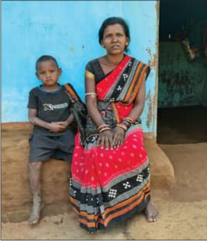
ତାଙ୍କ ଖାଉଣାକୁ ମଧ୍ୟ ଦେଉଛନ୍ତି। ଜିଲ୍ଲା ଶିଶୁ ସୁରକ୍ଷା ବିଭାଗ ଏହା ଉପରେ ଦୃଷ୍ଟି ଦେଇ ଶିଶୁଙ୍କୁ ଉଦ୍ଧାର କରି ବାଳାଶ୍ରମରେ ରଖିବାର ବ୍ୟବସ୍ଥା କରିବାକୁ କାଳିମାଟି ଗ୍ରାମବାସୀ ଦାବି କରିଛନ୍ତି।