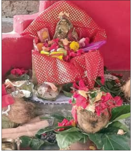
ସୁବଳୟା, ୧୨।୧୨(ସମିପ): ସୁବର୍ଣ୍ଣପୁର ଜିଲ୍ଲା ବିରମହାରାଜପୁର ବ୍ଲକ କେନଝରିଆପାଲି ପଞ୍ଚାୟତର