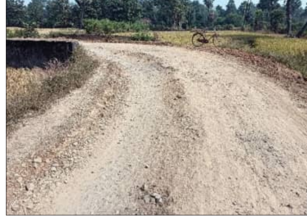
ଉକ୍ତ ରାସ୍ତାରେ ବଡ଼ବଡ଼ ଗର୍ଭି ସୃଷ୍ଟି ହେବା ଫଳରେ ଛୋଟ ବଡ଼ ଦୁର୍ଘଟଣାମାନ ହେଉଥିବା ଅଭିଯୋଗ ହେଉଛି। ଏନେଇ ବିଭାଗୀୟ ଯନ୍ତ୍ରା ସୁନାଲ ଦେହୁରାଙ୍କୁ ଯୋଗାଯୋଗ କରିବାକୁ ମୁଁ ସେହିରାସ୍ତାର ଯୋଗା

ସୁବଳୟା, ୧୨।୧୨(ସମିପ): ସୁବର୍ଣ୍ଣପୁର ଜିଲ୍ଲା ବାରମହାରାଜପୁର ବ୍ଲକ ଅନ୍ତର୍ଗତ ବହଳପଦର ଠାରୁ କେଶଲଗା ପର୍ଯ୍ୟନ୍ତ ପୂର୍ବରୁ ହୋଇଥିବା ପ୍ରଧାନମନ୍ତ୍ରୀ ସଡ଼କ ପିଚୁ ଦବିଯିବବା ଫଳରେ ରାସ୍ତା ଶୋଚନୀୟ ହୋଇପଡ଼ିଛି। ସୂଚନା ଆଉକି ଦାବରପାଲି ଠାରୁ କେଶଲଗାକୁ ସଂଯୋଗ କରିବା ପାଇଁ ପ୍ରଧାନମନ୍ତ୍ରୀ ସଡ଼କ ରାସ୍ତା ପାଇଁ ତିଆରି କରିବା ପାଇଁ ଆବଶ୍ୟକୀୟ ବାଲି, ମେଟାଲ, ଟିସ୍, ଡଷ୍ଟ ଆଣି କେଶଲଗା ଥରେ ଠିକାସଂସ୍ଥା କ୍ୟାମ୍ପ କରିଛି। ହାତୀ ଗାଡ଼ି ଗୁଡ଼ିକରେ ଅଧିକ ଓଜନ ନେଇ ପୂର୍ବରୁ ତିଆରି ହୋଇଥିବା ରାସ୍ତାରେ ଯାତାୟତ କରିବା ଫଳରେ ରାସ୍ତାର ପିଚୁ ଦବିଯାଇ ବଡ଼ବଡ଼ ଗର୍ଭି ସୃଷ୍ଟି ହୋଇଛି। ରାସ୍ତାରୁ ପିଚୁ ଗୁଡ଼ିକ ମଧ୍ୟ ଫାଟି ଯାଇଛି। ପୂର୍ବରୁ ମଧ୍ୟ ଉକ୍ତ ରାସ୍ତାକାମ ବେଳେ ନିମ୍ନମାନର କାମ ହୋଇଥିବା ଅଭିଯୋଗ ହେଉଛି।