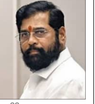
ମିଳିଥିବା ଖବର ଅନୁଯାୟୀ ବିଜେପି ପକ୍ଷରୁ ସିଦ୍ଧେଙ୍କୁ ଜଣାଇ ଦିଆଯାଇଛି ଯେ ବିଜେପିକୁ ସର୍ବାଧିକ ଆସନ ମିଳିଛି । ପୂର୍ଣ୍ଣ ବିଜେପି ନେତା ଫତନାଭିସ୍ ମୁଖ୍ୟମନ୍ତ୍ରୀ ହୋଇଥିବାରୁ ତାଙ୍କ ହାତରେ ହିଁ ରହିବ ଗୃହ ବିଭାଗ । ଏଥିରୁ ବିଜେପି ଓହରିବ ନାହିଁ । ଅନ୍ୟପକ୍ଷରେ ବିଜେପି ପକ୍ଷରୁ ସିଦ୍ଧେଙ୍କୁ ତିନିଟି ବିଭାଗର ବିକଳ ଦିଆଯାଇଛି । ଏହି ତିନିଟି ବିଭାଗ ହେଲା ରାଜସ୍ୱ, ନଗର ଉନ୍ନୟନ ଏବଂ ପୂର୍ବ ବିଭାଗ । ସେଥିମଧ୍ୟରୁ ସେ ଗୋଟିଏ ବାଜକୁ ଏହାସହିତ ତାଙ୍କୁ ଜଣାଇ ଦିଆଯାଇଛି ଅନ୍ୟତମ ଉପମୁଖ୍ୟମନ୍ତ୍ରୀ ।

■ ପୁରୀ, ୮ ୧୨ (ଏକେଡ୍): ଶିବ ସେନା ମୁଖ୍ୟ ଏକନାଥ ସିଦ୍ଧେଙ୍କୁ ନେଇ ୧୫ ଦିନ ଧରି ମହାରାଷ୍ଟ୍ର ରାଜନୀତି ଉଠିଲାପଡ଼ିଲା । ନିର୍ବାଚନରେ ବିପୁଳ ବହୁମତ ସତ୍ତ୍ୱେ ସରକାର ଗଠନ କରିବାକୁ ୧୦ ଦିନ ଲାଗିଲା । କେବଳ ଏକନାଥ ସିଦ୍ଧେଙ୍କ ପାଇଁ ସରକାର ଗଠନ ଅବକିଥିଲା । ସେତେବେଳେ ମୁଖ୍ୟମନ୍ତ୍ରୀ ଥିବା ସିଦ୍ଧେ ମୁଖ୍ୟମନ୍ତ୍ରୀ ବୌଦ୍ଧ ଓହରିବାକୁ ପ୍ରସ୍ତୁତ ନଥିଲେ । ବିଜେପି ନେତାଙ୍କ ପ୍ରବଳ ଚାପରେ ସେ ମୁଖ୍ୟମନ୍ତ୍ରୀ ବୌଦ୍ଧ ଓହରିଯାଇଥିଲେ ମଧ୍ୟ ଗୃହ ବିଭାଗ ନିଜ ହାତରେ ରଖିବାକୁ ଚିନ୍ତା ଧରିଲେ । ଏକଳି ବିଜି ପ୍ରତିଶ୍ରୁତି ମିଳିବା ପରେ ସେ ଉପମୁଖ୍ୟମନ୍ତ୍ରୀ ଭାବେ ଶପଥ ନେଲେ । କିନ୍ତୁ ବିଜେପି ଏବେ ରୋକଠୋକ ଭାବେ କଣ୍ଠାକେଇଛି ଯେ ସିଦ୍ଧେଙ୍କୁ କୌଣସି ପରିସ୍ଥିତିରେ ଗୃହ ବିଭାଗ ମିଳିବ ନାହିଁ । ଏହା ଶୁଣିବା ପରେ ଅକଳରେ ପଡ଼ିଯାଇଛନ୍ତି ସିଦ୍ଧେ । ଏହା ତାଙ୍କ ପାଇଁ ସମ୍ମାନ ପ୍ରଶ୍ନ ହୋଇଥିବାରୁ ସେ ଯେକୌଣସି ମୁହୂର୍ତ୍ତରେ ଅପ୍ରତିକାର ନିଷ୍ପତ୍ତି ନେଇପାରନ୍ତି ।