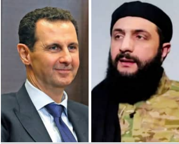
ଅସଦ ପରିବାର ରାଜୁତିର ଅବସାନ ଜୋଲାନୀ ହେବେ ଶାସନ ମୁଖ୍ୟ

■ ବାମାସ୍ୱୟ ୮୧୨ (ଏକେଡ୍): ସିରିଆରେ ସରକାରୀ ସେନା ଏବଂ ବିଦ୍ରୋହୀ ଗୋଷ୍ଠୀଙ୍କ ମଧ୍ୟରେ କିଛି ଦିନ ଲାଗି ରହିଥିବା ସଂଘର୍ଷର ଅନ୍ତ ଘଟିଛି । ଶନିବାର ରାତିରେ ବିଦ୍ରୋହୀ ଗୋଷ୍ଠୀ ରାଜଧାନୀ ଦାମାସ୍କସ୍‌କୁ ଦଖଲ କରିବା ପରେ ସରକାରୀ ସେନା ସେମାନଙ୍କ ଆଗରେ ମୁଣ୍ଡ ନୁଆଁଇବାକୁ ବାଧ୍ୟ ହୋଇଛି । ରାଜଧାନୀ ବିଦ୍ରୋହୀଙ୍କ ହାତକୁ ଚାଲିଯିବା ପରେ ରାଷ୍ଟ୍ରପତି ବସର ଅଲ୍-ଅସଦ୍ ଦେଶ ଛାଡ଼ି ଫୋରା ହୋଇଯାଇଛନ୍ତି । ପରିବାର ସହିତ ସେ ମସ୍କୋରେ ଆଶ୍ରୟ ନେଇଥିବା ଜଣାପଡ଼ିଛି । ଏହାସହିତ ୫୦ ବର୍ଷରୁ ଅଧିକ ବୟସ୍କ ଧରି ସିରିଆରେ ଚାଲିଥିବା ଅସଦ ପରିବାର ଶାସନର ଅବସାନ ଘଟିଛି । ଅସଦ ସରକାରକୁ ହଟାଇବା ପାଇଁ ବିଦ୍ରୋହର ନେତୃତ୍ୱ ନେଇଥିବା ଅଲ୍ ମହମ୍ମଦ ଅଲ୍ ଜୋଲାନୀ ମୁଖ୍ୟ ଶାସନ ମୁଖ୍ୟ ହେବାକୁ ଯାଉଥିବା ସ୍ୱପ୍ନ ହୋଇଯାଇଛି । ବିଦ୍ରୋହୀମାନେ ପ୍ରଥମେ ହାମା, ଆଲେପ୍ପୋ ଏବଂ ଦରାକୁ ଦଖଲ କରିବା