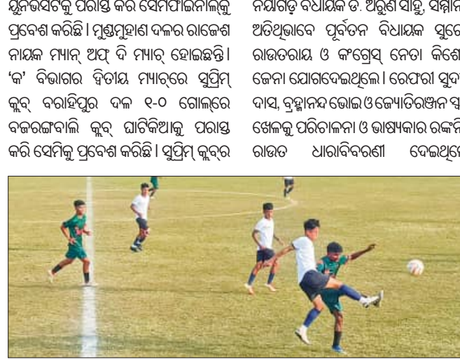
ପଦ୍ମକେଶରୀପୁର ପ୍ରାଥମିକରେ ଜିତିବାରେ ୫-୪ ଗୋଲରେ ଜୟ ହାସଲ କରି ଆଗକୁ ପରାସ୍ତ କରି ଗୁରୁତ୍ୱ ଦ୍ୱିତୀୟ ଦଳ ଭାବେ ପାଇନାଲକୁ ପ୍ରବେଶ କରିଛି । ଅନୁଷ୍ଠିତ 'କ'