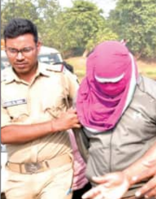
ଦୁର୍ଘଟଣା ଅଭିଯୋଗର ଭୟଙ୍କର ପ୍ରତିଶୋଧ

■ ରାଉରକେଲା, ୧୧/୧୨ (ସଂକେତ): ଦୁର୍ଘଟଣା ଅଭିଯୋଗର ଭୟଙ୍କର ପ୍ରତିଶୋଧ ନେଇ କେଲ୍ ପେଟରା ହତାଶ ପ୍ରେମିକ । କେଲ୍ ପେଟରା ପ୍ରେମିକାକୁ ଖଣ୍ଡ ଖଣ୍ଡ କରି କାଟି ଅତ୍ୟନ୍ତ ବୃଷ୍ଟି ଭାବେ ହତ୍ୟା କରିବା ପରେ ନଦୀ ଓ ପୋଖରୀରେ ପିଙ୍ଗି ଦେଇଛି । ଝାରସୁଗୁଡ଼ାରୁ ପ୍ରେମିକାକୁ ଅପହରଣ କରିବା ପରେ ରାଉରକେଲାରେ ଅତ୍ୟନ୍ତ ଅନାୟାସ ଭାବେ ହତ୍ୟା କରିଛି । ପରେ ଖଣ୍ଡବିଖଣ୍ଡିତ ଶରୀରକୁ ପୋଖରୀ ଓ ବ୍ରାହ୍ମଣୀ ନଦୀରେ ପିଙ୍ଗି ଦେଇଛି । ପୁଲିସ୍ ରାଉରକେଲାର ତରକେରା ନିକଟସ୍ଥ ଏକ ପୋଖରୀରୁ ଯୁବତୀର କଟାମୁଣ୍ଡ, ହାତ