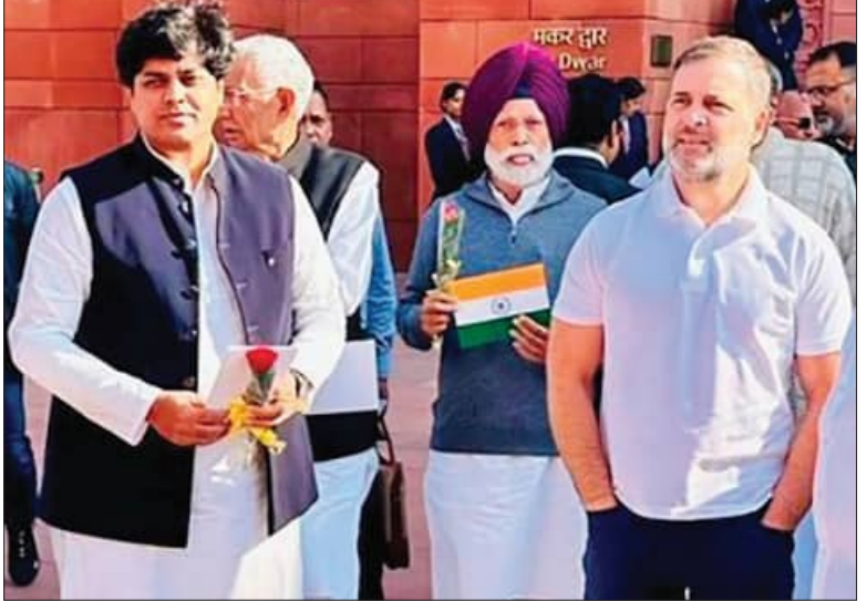
ସଂସଦ ଭବନ ବାହାରେ ଜାତୀୟ ପତାକା ଓ ପୁଲି ଦେଇ ବିରୋଧୀ ସଦସ୍ୟଙ୍କ ପ୍ରତିବାଦ