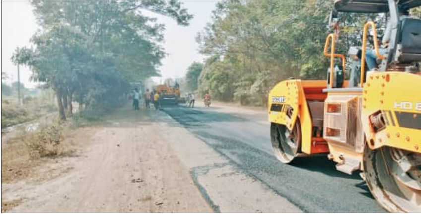
କରାଯାଇଥିଲା। ପକ୍ଷରେ ବିଜୁ ପଟ୍ଟନାୟକ ମାର୍ଗ ୧୨ କିମି ରାସ୍ତା ଅବସ୍ଥା ଯାହାପୂର୍ବ ତଥା ତରଫ ଅବସ୍ଥାରେ ରହିଛି। ରାସ୍ତା କାମ ନିମ୍ନମାନର ହେଉଥିବାରୁ ନାନା ସମସ୍ୟା

ଯଜ୍ଞପୁରା, ୧୯୧୨(ସମ୍ପାଦକ): କଳିଙ୍ଗନଗର ଏସିଆ ମହାଦେଶର ହର୍ଦ୍ଦ ହୋଇଥିବାରୁ କୋଟି କୋଟି ଟଙ୍କା ଖର୍ଚ୍ଚ ହେଉଛି କୋଟି କୋଟି ଟଙ୍କା; ସୁଧୁରୁନି ଅବସ୍ଥା