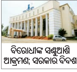
ବିରୋଧୀଙ୍କ ସମ୍ମୁଖୀନ ଅଧିବେଶନ; ସରକାର ବିବସ୍ତା

■ ଭୁବନେଶ୍ୱର, ୧୧/୧୨ (ସଂକେତ): ଭୁବନେଶ୍ୱର ଶେଷ ହୋଇଛି ସପ୍ତଦଶ ବିଧାନସଭାର ଦ୍ୱିତୀୟ ତଥା ଶୀତ ଅଧିବେଶନ । ଅଧିବେଶନରେ ମୋଟ ୩୦ଟି କାର୍ଯ୍ୟ ବିବସ୍ତା ଧାର୍ଯ୍ୟ ହୋଇଥିବା ବେଳେ ୧୬ଟି କାର୍ଯ୍ୟବିବସ୍ତା ପୂର୍ବରୁ ବାଚସ୍ପତି ସୁରମ୍ଭା ପାଢ଼ୀ ଗୃହକୁ ଅନିବିଷ୍ଟ କାଳ ଯାଏଁ ମୁଲତବା ଘୋଷଣା କରିଛନ୍ତି । ବିରୋଧୀଙ୍କ ସମ୍ମୁଖୀନ ଅଧିବେଶନ ହୋଇ ନ ପାରି ସରକାର ଆଗୁଆ ଅଧିବେଶନକୁ ମୁଲତବା କରିଥିବା ରାଜନୈତିକ ସମାଜକମାନେ ମତ ଦେଉଛନ୍ତି । ଗତ ୨୬ ତାରିଖରେ ଶୀତ ଅଧିବେଶନର ପ୍ରଥମ ଦିନ ମୁଖ୍ୟମନ୍ତ୍ରୀ ଗୃହରେ ଅତିରିକ୍ତ ବଜେଟ ଆରତ