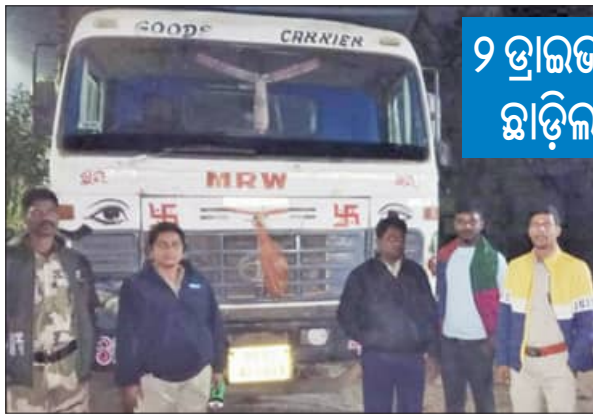
୨ ଡ୍ରାଇଭରଙ୍କୁ ସନ୍ଧ୍ୟାରେ ଛାଡ଼ିଲା ବନ ବିଭାଗ

କି ସ୍ଥାନୀୟ ବ୍ୟାସନଗର ପୁଲିସ୍ ଉପରେ ଖଣି ବିଭାଗ ଅଧିକାରୀ ଭରସି ପାରୁନାହାନ୍ତି। ତେବେ ମଙ୍ଗଳବାର ବିଳମ୍ବିତ ରାତିରେ ବ୍ୟାସନଗର