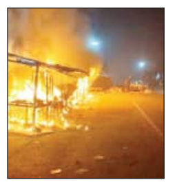
କର୍ମଚାରୀ ଘଟଣାସ୍ଥଳରେ ପହଞ୍ଚି ନିଆଁକୁ ଆଉଁସ ପୋଡ଼ିବାକୁ ଚେଷ୍ଟା କରୁଥିଲେ।

କେନ୍ଦୁଝର, ୧୧/୧୨(ସମ୍ପାଦକ): କେନ୍ଦୁଝର ଜିଲ୍ଲା ଘଟଣା ୩୮ ତାରିଖା ମନ୍ଦିର ୨ ନଂ ଗେଟ୍ ନିକଟରେ ଗତ ବିଳମ୍ବିତ ରାତ୍ରିରେ ୧୪ଟି ଭୋଗ ସାମଗ୍ରୀ ହଠାତ୍ ନିଆଁ ଲାଗି ୨୦୦ ଶାଠକରୁ ଅଧିକ ଟଙ୍କାର ଭୋଗ ସାମଗ୍ରୀ ଓ ସ୍ୱେଦନା ଚିନିଷପତ୍ର ପୋଡ଼ି ପାଉଁଶ ହୋଇଯାଇଛି। ମନ୍ଦିର ପରିସର ପାଚେରିକୁ ଲାଗିବାର ଶତାଧିକ ଭୋଗ ସାମଗ୍ରୀ ଓ ସ୍ୱେଦନା ବୋକାଳ କରି ଶତାଧିକ ଲୋକ ନିକଟ ବୋକାଳ ମେଣ୍ଟାଇଥିଲା। ପାଚେରି