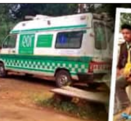
ଚାଲିବ ବୋଲି କର୍ମଚାରୀ ସଂଘ ତେରାବନା ଦେଇଛି। ଅନ୍ୟପକ୍ଷରେ ସମସ୍ତ କର୍ମଚାରୀ ଆଜି ହୁଏତରେ ଥିଲେ ବି ଆମ୍ବୁଲାନ୍ସ ଡିପିଏସ୍ ବନ୍ଦ