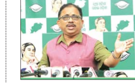
ଅନିୟମିତ ନିୟୁକ୍ତି ପାଇଁ ଗୁରୁତ୍ୱପୂର୍ଣ୍ଣ ସଂସ୍ଥା ରିମ୍ ମାଲିକକୁ ଦିଆଯାଇଛି କାମ କଳା ତାଲିକାକୁ କମ୍ପାନୀ ଓଡ଼ିଶାରେ କାମ ହାତେଇବାକୁ ନେଇ ପ୍ରଶ୍ନ

ଭୁବନେଶ୍ୱର, ୧୧/୧୨(ସମ୍ପାଦକ): ଗୋଟିଏ ପଟେ ରାଜ୍ୟ ବିଜେଡି ସରକାରଙ୍କ ବିପକ୍ଷରେ ତାଲିକା ଦିନକୁ ଦିନ ଲମ୍ବା ହୋଇ ଚାଲିଥିବା ବେଳେ ଅନ୍ୟପଟେ ପୁଲିସ୍ ଏସ୍ଆଇ ଓ ପାଠ୍ୟପୁସ୍ତକ ନିୟୁକ୍ତିରେ ଅନିୟମିତତାକୁ ନେଇ ରାଜ୍ୟସରକାରଙ୍କୁ ଗୁରୁତ୍ୱପୂର୍ଣ୍ଣ ଭାବରେ ପ୍ରଶ୍ନାବଳୀ ଦିଆଯାଇଛି। ବିଧାନସଭାର ଶାନ୍ତକାଳୀନ ଅଧିବେଶନରେ ଏହି ପ୍ରସଙ୍ଗକୁ ନେଇ ବିଜେଡି ଏକାଧିକ ସରକାରଙ୍କୁ ଘେରୁଛି। ୯୪୧ ଜଣ ପାଠ୍ୟପୁସ୍ତକ ନିୟୁକ୍ତିର ଗୁରୁତ୍ୱପୂର୍ଣ୍ଣ କମ୍ପାନୀ ମାଧ୍ୟମରେ ପଚାଶ କୋଟି ଟଙ୍କାର କାରବାର ହୋଇଥିବା ଅଭିଯୋଗ ଆଣିଛି। ବିଜେଡି ବିଧାନସଭାରେ ଏହି ଦୁର୍ଗତି