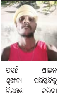
ପହଞ୍ଚି ଆଇନ ଶୁଖିଳା ପରିସ୍ଥିତିକୁ ନିୟନ୍ତ୍ରଣ କରିବା

ଶକ୍ତର (୨୬)। ତାଙ୍କ ଘର ବନ୍ଧିବଜାର ପେନସେନ୍ ଲେନ୍ ଅଞ୍ଚଳର ରୋଡ଼ାମ ଘରରେ। ଏହି ଦୁର୍ଘଟଣାରେ ଆଉ ଜଣେ ଶ୍ରମିକ ଆହତ ହୋଇ ଏସ୍‌ସିଏସ୍‌ରେ ଚିକିତ୍ସିତ ହେଉଛନ୍ତି। ଘଟଣାସ୍ଥଳରେ ସମୁଦାୟ ୫ ଜଣ ଶ୍ରମିକ କାର୍ଯ୍ୟ କରୁଥିଲେ। କୌଣସି ଶ୍ରମିକଙ୍କ ପାଇଁ ସୁରକ୍ଷା ବ୍ୟବସ୍ଥା ଗ୍ରହଣ କରାଯାଇ ନଥିଲା। ନିର୍ମାଣସାଧନ ଡ୍ରେନ୍ କଡ଼ରେ ଥିବା ପୁରାତନ ପାଟେରୀଟି ହଠାତ୍ ଲୁହାଣି ପଡ଼ିବାକୁ ୨ ଜଣ ଶ୍ରମିକ ଚାପି ହୋଇ ରହିଯାଇଥିଲେ। ସ୍ଥାନୀୟ ଲୋକଙ୍କ ସହଯୋଗରେ ଦୁର୍ଘଟଣା ଉଦ୍ଧାର