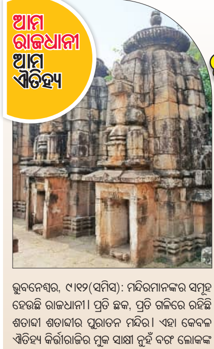
ଭୁବନେଶ୍ୱର, ୯/୧୨ (ସମ୍ବିଧ): ମନ୍ଦିରମାନଙ୍କର ସମୂହ ହେଉଛି ରାଜଧାନୀ। ପ୍ରତି ଛକ, ପ୍ରତି ଗଳିରେ ରହିଛି ଶତାବ୍ଦୀ ଶତାବ୍ଦୀର ପୁରାତନ ମନ୍ଦିର। ଏହା କେବଳ ଏହିପରି କର୍ତ୍ତାବଳିର ପୂଜା ସାଧା ହୁଏ ବରଂ ଲୋକଙ୍କ

ଭୁବନେଶ୍ୱର, ୯/୧୨ (ସମ୍ବିଧ): ଭୁବନେଶ୍ୱର ଉପକଣ୍ଠ କାଲମାଟିଆ ପାଟଣା ଗ୍ରାମରେ ହନୁମାନଙ୍କ ମନ୍ଦିର ପ୍ରତିଷ୍ଠା ତଥା ବିଶ୍ୱର ମଙ୍ଗଳ ନିମନ୍ତେ ବିଶ୍ୱଶାଳି ମହାସ୍ଥ ଅନୁଷ୍ଠିତ ହୋଇଛି।