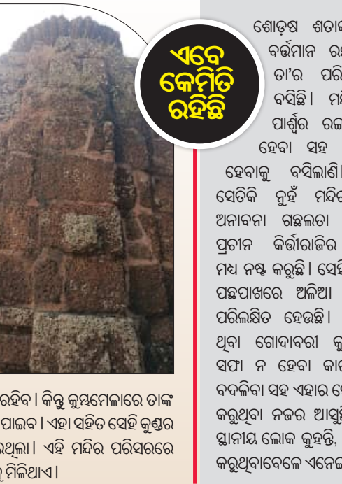
ଭୁବନେଶ୍ୱର, ୯/୧୨ (ସମ୍ବିଧ): ମନ୍ଦିରମାନଙ୍କର ସମୂହ ହେଉଛି ରାଜଧାନୀ। ପ୍ରତି ଛକ, ପ୍ରତି ଗଳିରେ ରହିଛି ଶତାବ୍ଦୀ ଶତାବ୍ଦୀର ପୁରାତନ ମନ୍ଦିର। ଏହା କେବଳ ଏହିପରି କର୍ତ୍ତାବଳିର ପୂଜା ସାଧା ହୁଏ ବରଂ ଲୋକଙ୍କ

ଆଧ୍ୟାତ୍ମିକ ଭାବନା ସହ ମଧ୍ୟ ଜଡ଼ିତ। ଏକ ସର୍ବୋଚ୍ଚ ଉପାଦେୟ ଗଣାଯାଏ, ରାଜଧାନୀ ଭୁବନେଶ୍ୱରରେ ପାଖାପାଖି ୭୦୦ ପୁରାତନ ମନ୍ଦିର ରହିଛି। ସେଥିମଧ୍ୟରୁ ଶୋଡ଼଼ଶ ଶତାବ୍ଦୀର ଅଷ୍ଟଶତମୁ ମନ୍ଦିର ଅନ୍ୟତମ। ଏହି ମନ୍ଦିରଟି ବିଭୁସାଗର ନିକଟରେ ଥିବା ଭରଣେଶ୍ୱର ମନ୍ଦିର ପରିସରରେ ରହିଛି।