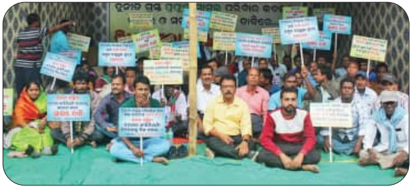
ବରପଦା ଲଞ୍ଜିନିୟର କଲେଜ ପୁରୁଣା ଦାବିରେ ଉଦ୍‌ଘାଟନା କରାଯାଇଥିବା ସଭାରେ ଉପସ୍ଥିତ ଲୋକମାନଙ୍କର ଛବି