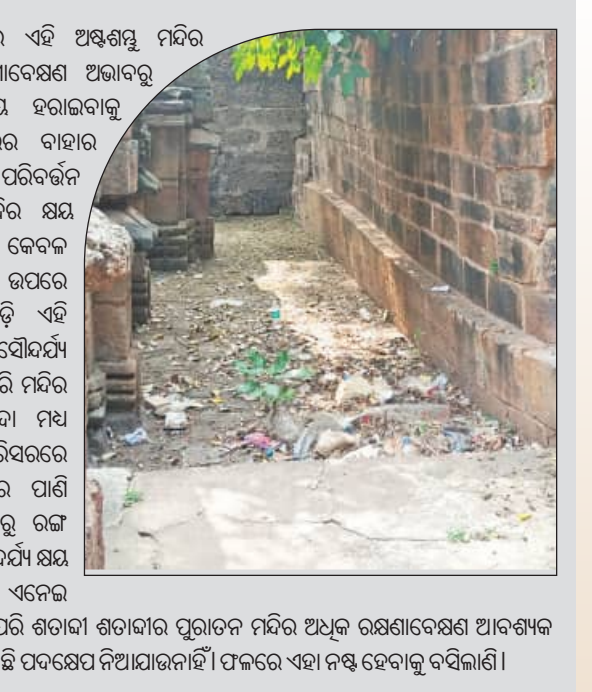
ଭୁବନେଶ୍ୱର, ୯/୧୨ (ସମ୍ବିଧ): ମନ୍ଦିରମାନଙ୍କର ସମୂହ ହେଉଛି ରାଜଧାନୀ। ପ୍ରତି ଛକ, ପ୍ରତି ଗଳିରେ ରହିଛି ଶତାବ୍ଦୀ ଶତାବ୍ଦୀର ପୁରାତନ ମନ୍ଦିର। ଏହା କେବଳ ଏହିପରି କର୍ତ୍ତାବଳିର ପୂଜା ସାଧା ହୁଏ ବରଂ ଲୋକଙ୍କ