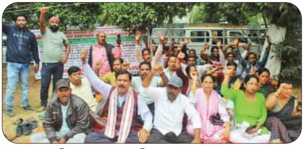
ଏମ୍‌ସିଏଲ୍‌ଏଫ୍ କର୍ମଚାରୀଙ୍କ ଦ୍ୱାରା ଡାକିଥିବା ସଭାରେ ଉପସ୍ଥିତ ଲୋକମାନଙ୍କର ଛବି

ସରକାରଙ୍କ ମନମାନିକୁ ନେଇ ସମସ୍ତଙ୍କ ମଧ୍ୟରେ ଗୋଟିଏ ପ୍ରକାର କଳହ ଉଠିଛି। ସରକାରଙ୍କ ମନମାନିକୁ ନେଇ ସମସ୍ତଙ୍କ ମଧ୍ୟରେ ଗୋଟିଏ ପ୍ରକାର କଳହ ଉଠିଛି।