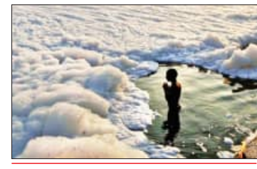
କେନ୍ଦ୍ରୀୟ ଜଳ କମିଶନଙ୍କ ରିପୋର୍ଟ

ସିକନ୍ଦରା ଘାଟର ଘାଟ୍ ରହିଛି। ଏଥିରୁ ସିକନ୍ଦରା ଘାଟର ଘାଟ୍‌ରେ ୧୪୪ ଏମ୍‌ଏଲିଟି କ୍ଷମତାର ଏମ୍‌ବିଏଆର ପ୍ଲାଣ୍ଟ ରହିଛି। ଏଠାରେ ଯମୁନା ପାଣିକୁ ପରୀକ୍ଷା କରାଯାଇ ଥିଲା। ସହରକୁ ଜଳ ଯୋଗାଇ ଦିଆଯାଇଥାଏ। ତେବେ ଭାରି ଧାତୁର ଯାଞ୍ଚ ପାଇଁ ଆବଶ୍ୟକୀୟ ଉପକରଣ ଏଠାରେ ନାହିଁ କିମ୍ବା କମିଶନ ଆନ୍ଧ୍ରାଜୀବ ପୋଲିସ। ଘାଟ୍ ସହିତ ୨ ସ୍ଥାନ ଏବଂ ମଥୁରାରେ ଗୋଟିଏ ସ୍ଥାନରୁ ନମୁନା ସଂଗ୍ରହ କରିଥିଲେ। ଯାଞ୍ଚରେ ଏଥିରେ ଭାରି ଧାତୁ ଥିବା ଜଣାପଡ଼ିଥିଲା। ଦେଶର ୧୮୭ ସହରର ପାଣିରେ ତିନୋଟି ଭାରି ଧାତୁ ଥିବା ଜଣାପଡ଼ିଛି। ଏହା ମଧ୍ୟରେ ଆନ୍ଧ୍ରା ଏବଂ ମଥୁରା ସାମିଲ ରହିଛି। ନଦୀ ପାଣିରୁ ଆର୍ସେନିକ, କ୍ୟାଡମିୟମ, କ୍ଲୋମିଡ଼ାମ୍, କପର୍, ଆଇରନ, ମରକ୍କୁରା, ନିକେଲ, ଲେଡ୍ ଏବଂ ଜିଙ୍କ ମିଳିଛି। ଏହି ପାଣି ପିଇଲେ ଚର୍ମ ରୋଗ, ପେଟ ରୋଗ, ଆଲ୍‌ସର, ଯୂସ୍‌ପ୍‌ସ୍ କର୍କଟ, ରୋଗ ପ୍ରତିରୋଧକ ଶକ୍ତି ହ୍ରାସ, ହୃଦ୍‌ପିଣ୍ଡ ଜନିତ ରୋଗ, ଯକୃତ ଖରାପ ଏବଂ ଶ୍ୱାସ୍‌ପ୍ରତ୍ନରେ ପରିବର୍ତ୍ତନ ଆଦି ରୋଗ ହୋଇଥାଏ। ଏବେ ଏହି ରିପୋର୍ଟକୁ ପ୍ରତ୍ୟକ୍ଷ ନିୟନ୍ତ୍ରଣ ବୋର୍ଡ୍ ଉପରେ ପ୍ରସ୍ତୁତ କରାଯାଇଛି।