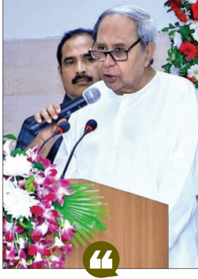
‘ଆପଣମାନଙ୍କ ଖୁସିରେ ମୋ ଖୁସି, ଶେଷ ପର୍ଯ୍ୟନ୍ତ ଶ୍ରମିକ ଭାଇଭଉଣୀଙ୍କ କଲ୍ୟାଣ ପାଇଁ କାମ କରିବି’

କାର୍ଯ୍ୟକାରୀତା ବୈଠକରେ ଉଦ୍‌ବୋଧନ ଦେଇ ହେଉଛନ୍ତି ଗୋଟିଏ ରାଷ୍ଟ୍ରର ସବୁଠାରୁ ବଡ଼ ଶକ୍ତି। ସେମାନଙ୍କ ତ୍ୟାଗ ଓ ଶ୍ରମ ହିଁ ଦେଶକୁ ସମୃଦ୍ଧ କରିଥାଏ। ବିକାଶ ଓ ସମୃଦ୍ଧିର ପ୍ରତିଟି କ୍ଷେତ୍ରରେ ଆମ ଶ୍ରମିକ ଭାଇଭଉଣୀମାନଙ୍କର ସବୁଠାରୁ ବଡ଼ ଅବଦାନ ରହିଛି। ଆପଣମାନଙ୍କର ଅବଦାନକୁ ମୁଁ ସମ୍ମାନ ଜଣାଉଛି। ମହାନ ଜନନାୟକ ବିଜୁ ବାବୁ ୧୯୯୦ରେ ଶ୍ରମିକମାନଙ୍କର ସର୍ବନିମ୍ନ ମଜୁରି ବୃଦ୍ଧି କରି ଇତିହାସ ସୃଷ୍ଟି କରିଥିଲେ। ବିଜୁ ଜନତା ଦଳର ସରକାର ସମୟରେ ଆପଣମାନଙ୍କ କଲ୍ୟାଣ ପାଇଁ ଅନେକ ପଦକ୍ଷେପ ନିଆଯାଇଛି। ▶ପୃଷ୍ଠା-୬