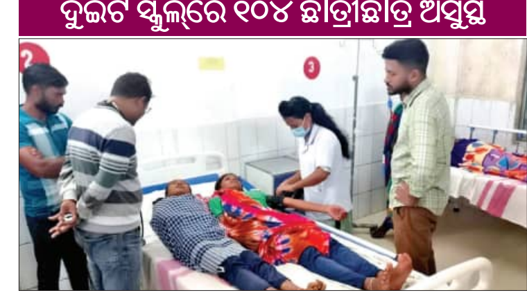
ପରିସ୍ଥିତି ସୃଷ୍ଟି କରିଛି। ଏସବୁ ଅବ୍ୟବସ୍ଥା ଘଟିଯାଇଛି। ଖରାପ ମଧ୍ୟାହ୍ନଭୋଜନ ଖାଇ ଭିତରେ ଆଜି (ଶନିବାର) ରାଜ୍ୟର ଦୁଇ ଦୁଇଟି କନ୍ୟାଙ୍କ ଓ ବଳାଙ୍ଗିର ଜିଲ୍ଲାର ଦୁଇଟି ଧୂଳର ସ୍ଥାନରେ ମଧ୍ୟାହ୍ନଭୋଜନ ଜନିତ ବଡ଼ ଅଘଟଣ ଘଟିଛି। ୧୦୪ଜଣ ଛାତ୍ରଛାତ୍ରୀ ▶ପୃଷ୍ଠା-୬

■ ମୁରିବାହାଲ/ଦାରିକବାଡ଼ି, ୭।୧୨ (ସମ୍ବାଦ): ବିଦ୍ୟାଳୟରେ ଉପସ୍ଥାନ ବୃଦ୍ଧି ସହ ପୁଷ୍ଟି ସାଧନ ଲକ୍ଷ୍ୟରେ ଛାତ୍ରଛାତ୍ରୀମାନଙ୍କ ପାଇଁ ଜାରି ରହିଥିବା ମଧ୍ୟାହ୍ନଭୋଜନ ଯୋଜନା ଏବେ ଦିଗହରା ହୋଇଯାଇଛି। କେଉଁଠି ପାଣି ଅଭାବରୁ ଶିକ୍ଷକମାନେ ଅଙ୍ଗନବାଡ଼ି କେନ୍ଦ୍ରରୁ ଚାଉଳ ଉଧାର ଆଣି ପିଲାମାନଙ୍କୁ ଖାଇବାକୁ ଦେଉଛନ୍ତି ତ କେଉଁଠି ପନିପରିବାର ଆକାଶକୁ ଆଁ ଦରବୁଦ୍ଧି ଖାଦ୍ୟର ମାନକୁ ନିକୁଷ୍ଟ କରିଛି। ପୁଣି କେଉଁଠି ପାଟିକାମାନଙ୍କୁ ପାରିଶ୍ରମିକ ମିଳୁ ନାହିଁ ତ କେଉଁଠି ଗ୍ୟାସ୍ କିମ୍ବା କାଠ ଅଭାବରୁ ରୋଷେଇ ହୋଇପାରୁ ନାହିଁ। ଏହାକୁ ନେଇ ଗତ ୬ ମାସ ହେଲା ରାଜ୍ୟର ବିଭିନ୍ନ ସ୍ଥାନରେ ଅଙ୍ଗନବାଡ଼ି କେନ୍ଦ୍ରଠାରୁ ଆରମ୍ଭ କରି ବିଦ୍ୟାଳୟଗୁଡ଼ିକରେ ଛାତ୍ରଛାତ୍ରୀ ଏବଂ ଅଭିଭାବକଙ୍କ ଅସନ୍ତୋଷ ଅପ୍ରତିକର