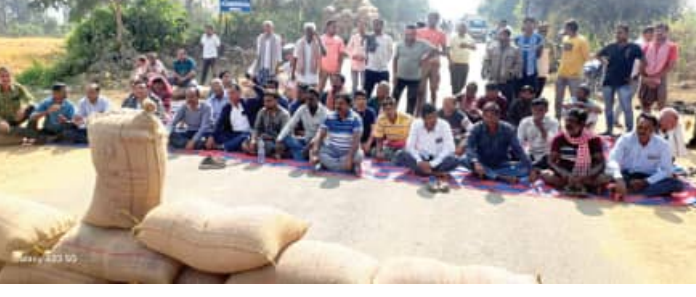
ସମସ୍ୟା ନେଇ ଚାଷୀ ଗତି କରୁଛି। କିନ୍ତୁ ତାର ଦୁଃଖ ଶୁଣିବାକୁ କେହି ନାହାନ୍ତି। ବଲାଙ୍ଗିର ଜିଲ୍ଲାର ସଦର ଏବଂ ଦେଓଗାଁ ବ୍ଲକ୍ ଅନ୍ତର୍ଗତ ବିଭିନ୍ନ ମଣ୍ଡିମାନଙ୍କରେ ଧାନ କିଣାରେ

■ ବଲାଙ୍ଗିର, ୧୮।୧୨ (ସମ୍ପାଦକ): ରାଜ୍ୟରେ ବିଜେପି ସରକାର ଆସିବା ପରେ ବିନା କର୍ତ୍ତୃତ୍ୱ ଛନ୍ଦିରେ ଚାଷୀଙ୍କ ଧାନ କିଣାଯିବ ବୋଲି ଘୋଷଣା କରାଯାଇଥିଲା। କିନ୍ତୁ ବିଜେପି ସରକାର ଦେଇଥିବା କଥା ପାଖିରଗାର ପାଲଟିଛି। ଧାନକିଣା ଶୁଭାରମ୍ଭ ହେବାର ଦୁଇ ସପ୍ତାହ ବିତିଯାଇଥିଲେ ହେଁ ବର୍ତ୍ତମାନ ସୁଦ୍ଧା ସମସ୍ତ ମଣ୍ଡିରେ ଧାନକିଣା ଆରମ୍ଭ ହୋଇପାରିନି। ଯେଉଁ କିଛି ପାହୁରେ ଧାନ କିଣା ଯାଉଛି ସେଠାରେ ୫/୬ କେଜି କର୍ତ୍ତୃତ୍ୱ ଛନ୍ଦି କରାଯାଉଛି। କେବଳ ଏତିକି ନୁହେଁ ଅଣ୍ଡା ବସ୍ତ୍ର ସମସ୍ୟା ପାଇଁ ଚାଷୀ ତାର ଧାନ ବିକ୍ରି କରିପାରୁନାହିଁ। ଏଭଳି ବିଭିନ୍ନ ସମସ୍ୟା ନେଇ ଚାଷୀ ଗତି କରୁଛି। କିନ୍ତୁ ତାର ଦୁଃଖ ଶୁଣିବାକୁ କେହି ନାହାନ୍ତି। ବଲାଙ୍ଗିର ଜିଲ୍ଲାର ସଦର ଏବଂ ଦେଓଗାଁ ବ୍ଲକ୍ ଅନ୍ତର୍ଗତ ବିଭିନ୍ନ ମଣ୍ଡିମାନଙ୍କରେ ଧାନ କିଣାରେ