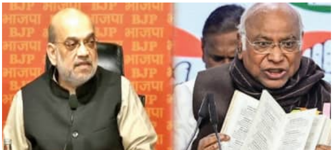
ଶାହଙ୍କ ଲକ୍ଷ୍ମୀ ଦାବି କଲା କଂଗ୍ରେସ କଂଗ୍ରେସକୁ ମୋଦୀ, ଶାହଙ୍କ ସମାଲୋଚନା ସ୍ୱାଧୀକାର ଭଙ୍ଗ ନୋଟିସ୍ ଆଣିଲା ଟିଏମ୍‌ସି

■ ନୂଆଦିଲ୍ଲୀ, ୧୮।୧୨ (ଏକେଡ଼ି): ରାଜ୍ୟସଭାରେ ଗତକାଳି ସମ୍ମିଳିତ ଉପରେ ଆଲୋଚନା ବେଳେ ଆନ୍ଦୋଳନର ଝଡ଼ ଖେଳିଥିବା ମନ୍ତ୍ରବ୍ୟକ୍ତି ନେଇ ବଡ଼ ଧରଣର ବିବାଦ ସୃଷ୍ଟି ହୋଇଛି। ଅମିତ ଶାହ ଲକ୍ଷ୍ମୀ ଦିଅନ୍ତୁ, ନହେଲେ ତାଙ୍କୁ ପ୍ରଧାନମନ୍ତ୍ରୀ ବହିଷ୍କାର କରନ୍ତୁ ବୋଲି କଂଗ୍ରେସ ଦାବି କରିଥିବା ବେଳେ ଅମିତ ଶାହ କହିଛନ୍ତି ଯେ ଆନ୍ଦୋଳନକୁ ପ୍ରତି ସେ କୌଣସି ଆପତ୍ତିଜନକ ମନ୍ତ୍ରବ୍ୟକ୍ତି ଦେଇ ନାହାନ୍ତି। ତାଙ୍କ ମନ୍ତ୍ରବ୍ୟକ୍ତି କର୍ତ୍ତୃତ୍ୱ କରି କଂଗ୍ରେସ ନେତା ଅପପ୍ରତୀତ ଚଳାଇଛନ୍ତି। ସେମାନଙ୍କ ବିରୋଧରେ ଆଇନଗତ କାର୍ଯ୍ୟାନୁଷ୍ଠାନ ଗ୍ରହଣ କରାଯିବ ବୋଲି ସେ ଧମକ ଦେଇଛନ୍ତି। ପ୍ରଧାନମନ୍ତ୍ରୀ ମୋଦୀ ମଧ୍ୟ ଶାହଙ୍କୁ ସମର୍ଥନ ଜଣାଇ କହିଛନ୍ତି ଯେ କଂଗ୍ରେସର ଅପପ୍ରତୀତ କାମ ଦେବନାହିଁ। ଏହି ବିବାଦକୁ ନେଇ ଆଜି ସଂସଦର ଉଭୟ ଗୃହରେ