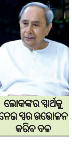
ଲୋକଙ୍କର ସ୍ୱାର୍ଥକୁ ନେଇ ସ୍ୱର ଉତ୍ତୋଳନ କରିବ ଦଳ

■ ଭୁବନେଶ୍ୱର, ୧୮।୧୨ (ସମ୍ପାଦକ): ଆସନ୍ତା ୨୬ ତାରିଖରେ ବିଜୁ ଜନତା ଦଳ ପାଇଁ ୨୮ତମ ପ୍ରତିଷ୍ଠା ଦିବସ। ଏହା ଅବ୍ୟବହୃତ ପୂର୍ବରୁ ଦଳୀୟ କର୍ମୀ ଓ କର୍ମକର୍ତ୍ତାଙ୍କୁ ଚିଠି ଲେଖି ନବୀନ ରାଜ୍ୟ ସରକାରଙ୍କ ଜନବିରୋଧୀ କାର୍ଯ୍ୟ ସମ୍ପର୍କରେ ସାଧାରଣ ଲୋକଙ୍କୁ ଜଣାଇବାକୁ ନିର୍ଦ୍ଦେଶ ଦେଇଛନ୍ତି। ଏହା ସହିତ ନୂଆ ପ୍ରତ୍ୟୟର ସହ ନୂଆ ଓଡ଼ିଶା ଗଠନ ପାଇଁ ଉତ୍ସାହୀକୃତ କାର୍ଯ୍ୟ କରିବାକୁ ସେ ଦକ୍ଷତା ସମସ୍ତଙ୍କୁ ନେତା, ପଦାଧିକାରୀ, କର୍ମକର୍ତ୍ତାଙ୍କୁ ପରାମର୍ଶ ଦେଇଛନ୍ତି।