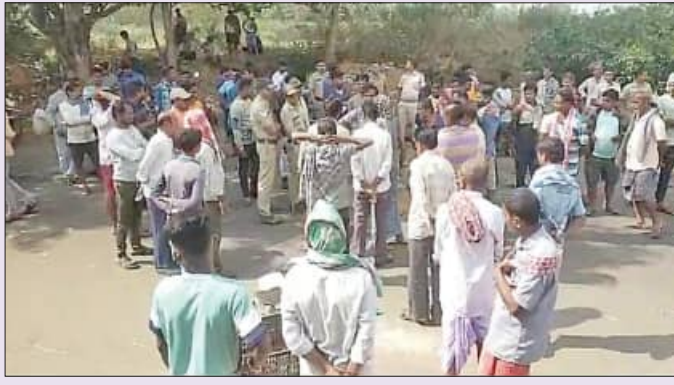
ପାଇଁ ସ୍ଥାନୀୟ ଚାକୁଣ୍ଡା, ଗୁଣ୍ଡିଚାବାଟି, କରବା ସହ ବଡ଼ବଡ଼ ଓ ସୋରଡ଼ାକୁ ସରକାରୀ ଗ୍ରାମବାସୀ ଏହାର ବିରୋଧ କରୁଥିବା ରାଜ୍ୟ ରାଜପଥ

ବର୍ତ୍ତମାନ ତାହାର ପୁନଃ ଉଦ୍ଧାର ପରେ ସମ୍ପୃକ୍ତ ଜାଗାର କିଛି ଅଂଶରେ ଖାରାଗୁଡ଼ା ଗ୍ରାମର ପୁରାଣ ବନ୍ଧ ଗୁରୁକ୍ତ ଜମି ରହିଥିବା ଦର୍ଶାଇ ସେ ସ୍ଥାନୀୟ ପ୍ରଶାସନର ଦ୍ୱାରା ହୋଇଥିଲେ। ତେବେ ସେଠାରୁ ନିରାଶ ହେବା ପରେ ଉଦ୍ଧାରକାରୀ ଆଶ୍ରୟ ନେଇଥିଲେ। ଉଦ୍ଧାରକାରୀ ବିଶ୍ୱାମୀନାର କିଛି ଅଂଶ ଭାଙ୍ଗିବାକୁ ନିର୍ଦ୍ଦେଶ ଦେଇଥିଲେ। ନ୍ୟାୟାଳୟ ଆଦେଶ ଅନୁସାରେ ମଙ୍ଗଳବାର ସ୍ଥାନୀୟ ତହସିଲଦାର, ବିଡ଼ିଓ ଓ ଥାନା ଅଧିକାରୀ ବିଶ୍ୱାମୀନାର ଭାଙ୍ଗିବା ଲାଗି ସଦକ୍ଷେପ ଦେଇଥିଲେ। ତେବେ ଘଟଣା ସମ୍ପର୍କରେ ସୂଚନା