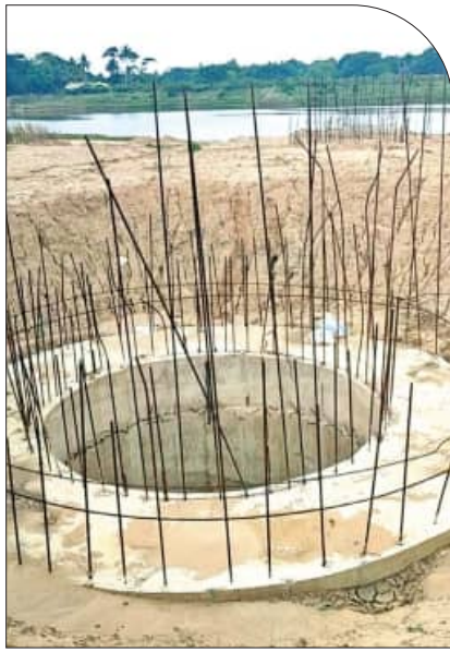
ରହି ପିଲାଙ୍କ ଯୋଡ଼ି ହୋଇପଡ଼ିଲାଣି । ତେବେ ଅଞ୍ଚଳର ସ୍ୱାସ୍ଥ୍ୟ ଦୃଷ୍ଟିରୁ ରାଜ୍ୟ ସରକାର ଏହି ପୋଲ ନିର୍ମାଣ କାର୍ଯ୍ୟ ଶେଷ କରିବାକୁ ସାଧାରଣରେ ଦାବି ହୋଇଛି ।

ଅଛି କି ନାହିଁ ବିଭାଗ ତାହାର ଉତ୍ତର ଦେଉନାହିଁ । ଏହି ସେତୁ କାମ ଶେଷ ହୋଇଥିଲେ ପଟ୍ଟାମୁଣ୍ଡା ଓ ଆଜି ରୁକ୍ମର ତରଫିପାଳ, ପେଟ୍ଟପାଳ, ଅକପୁଆ, ଫିହରା, ଅଶ୍ୱରା, ଅମୃତମୋହା, ବଲୁରିଆ, ନୂଆପଡ଼ା, ବାଟିପଡ଼ା, ସାମଲ, ଫାସିଆ, ପେଟପଡ଼ା ପ୍ରଭୃତି ପଞ୍ଚାୟତର ଲୋକେ ପଟ୍ଟାମୁଣ୍ଡା ସହରକୁ ଯାତାୟତ ସୁବିଧା ପାଇପାରିଆନ୍ତେ । ସେହିପରି ନୀଳକଣ୍ଠପୁର-ଜଗନ୍ନାଥପୁର ସେତୁ ନିର୍ମାଣ ସରିଥିଲେ ପଟ୍ଟାମୁଣ୍ଡା ରୁକ୍ ସଦର ମହକୁମା, ତହସିଲ ଓ ଆନା ସହିତ ସିଧାସଳଖ ଯୋଗାଯୋଗ ହୋଇପାରିବା ସହିତ ୯/୧୦ କିମି ଦୂରତା କମ୍ ହୋଇଆନ୍ତା । କିନ୍ତୁ ଅଧ୍ୟାପକ ଶ୍ରୀ ଭାବେ ପୋଲ ନିର୍ମାଣ କାମ ହାତୁ ଠିକା ଫର୍ମ୍ମା ଛୁ ମାରିଥିବାରୁ ବାହୁଣୀ ବନ୍ଦୀ ଓ ସୋଡ଼ା ହାରା ବାଲି ସବୁ ନିର୍ମାଣାଧୀନ ୮ଟି ପିଲାଙ୍କ ଚତୁର୍ପାଶ୍ୱରେ ଜମା ହୋଇ