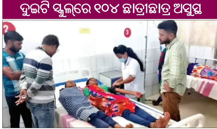
ପରିସ୍ଥିତି ସୃଷ୍ଟି କରିଛି। ଏସବୁ ଅବ୍ୟବସ୍ଥା ଘଟିଯାଇଛି। ଖରାପ ମଧ୍ୟାହ୍ନଭୋଜନ ଖାଇ ଭିତରେ ଆଜି (ଶନିବାର) ରାଜ୍ୟର ଦୁଇ ଦୁଇଟି କନ୍ୟାଙ୍କ ଓ ବଳାଙ୍ଗିର ଜିଲ୍ଲାର ଦୁଇଟି ଧୂଳର ସ୍ଥାନରେ ମଧ୍ୟାହ୍ନଭୋଜନ ଜନିତ ବଡ଼ ଅଘଟଣ ଘଟିଛି। ୧୦୪ଜଣ ଛାତ୍ରଛାତ୍ରୀ ମୃତ୍ୟୁବରଣ କରିଛନ୍ତି।

ମୁରିବାହାଲ/ଦାରିକବାଡ଼ି, ୭ ଡିସେମ୍ବର (ସମ୍ବାଦ): ବିଦ୍ୟାଳୟରେ ଉପସ୍ଥାନ ବୃଦ୍ଧି ସହ ପୁଷ୍ଟି ସାଧନ ଲକ୍ଷ୍ୟରେ ଛାତ୍ରଛାତ୍ରୀମାନଙ୍କ ପାଇଁ ଜାରି ରହିଥିବା ମଧ୍ୟାହ୍ନଭୋଜନ ଯୋଜନା ଏବେ ଦିଗହରା ହୋଇଯାଇଛି। କେଉଁଠି ପାଣି ଅଭାବରୁ ଶିକ୍ଷକମାନେ ଅଜନବାଡ଼ି କେନ୍ଦ୍ରରୁ ଚାଉଳ ଉଧାର ଆଣି ପିଲାମାନଙ୍କୁ ଖାଇବାକୁ ଦେଉଛନ୍ତି ତ କେଉଁଠି ପନିପରିବାର ଆକାଶକୁ ଆଁ ଦରବୁଦ୍ଧି ଖାଦ୍ୟର ମାନକୁ ନିକୁଷ୍ଟ କରିଛି। ପୁଣି କେଉଁଠି ପାଟିକାମାନଙ୍କୁ ପାରିଶ୍ରମିକ ମିଳୁ ନାହିଁ ତ କେଉଁଠି ଗ୍ୟାସ୍ କିମ୍ବା କାଠ ଅଭାବରୁ ରୋଷେଇ ହୋଇପାରୁ ନାହିଁ। ଏହାକୁ ନେଇ ଗତ ୬ ମାସ ହେଲା ରାଜ୍ୟର ବିଭିନ୍ନ ସ୍ଥାନରେ ଅଜନବାଡ଼ି କେନ୍ଦ୍ରଠାରୁ ଆରମ୍ଭ କରି ବିଦ୍ୟାଳୟଗୁଡ଼ିକରେ ଛାତ୍ରଛାତ୍ରୀ ଏବଂ ଅଭିଭାବକଙ୍କ ଅଧିକାଂଶ ଅପ୍ରତିକର