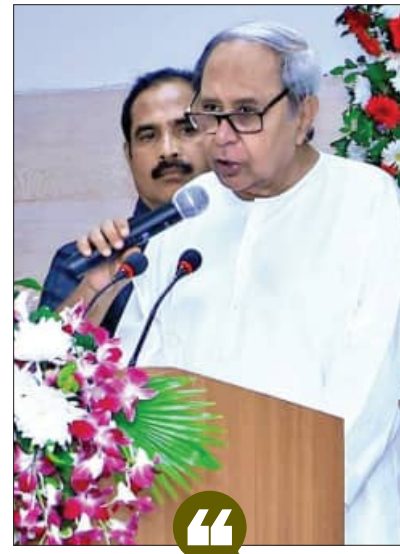
'ଆପଣମାନଙ୍କ ଖୁସିରେ ମୋ ଖୁସି, ଶେଷ ପର୍ଯ୍ୟନ୍ତ ଶ୍ରମିକ ଭାଇଭଉଣୀଙ୍କ କଲ୍ୟାଣ ପାଇଁ କାମ କରିବି'

କାର୍ଯ୍ୟକାରୀତା ବୈଠକରେ ଉଦ୍‌ବୋଧନ ଦେଇ ହେଉଛନ୍ତି ଗୋଟିଏ ରାଷ୍ଟ୍ରର ସବୁଠାରୁ ବଡ଼ ଶକ୍ତି। ସେମାନଙ୍କ ତ୍ୟାଗ ଓ ଶ୍ରମ ହିଁ ଦେଶକୁ ସମୃଦ୍ଧ ନବୀନ କହିଛନ୍ତି, ବିକାଶ ଓ ସମୃଦ୍ଧିର ପ୍ରତୀକ୍ଷିତ ଶ୍ରେଣୀରେ ଆମ ଶ୍ରମିକ ଭାଇଭଉଣୀମାନଙ୍କର ସବୁଠାରୁ ବଡ଼ ଅବଦାନ ରହିଛି। ଆପଣମାନଙ୍କର ଅବଦାନକୁ ମୁଁ ସମ୍ମାନ ଜଣାଉଛି। ମହାନ ଜନନାୟକ ବିଜୁ ବାବୁ ୧୯୯୦ରେ ଶ୍ରମିକମାନଙ୍କର ସର୍ବନିମ୍ନ ମୂଲ୍ୟକୁ ବୃଦ୍ଧି କରି ଇତିହାସ ସୃଷ୍ଟି କରିଥିଲେ। ବିଜୁ ଜନତା ଦଳର ସରକାର ସମୟରେ ଆପଣମାନଙ୍କ କଲ୍ୟାଣ ପାଇଁ ଅନେକ ପଦକ୍ଷେପ ନିଆଯାଇଛି।