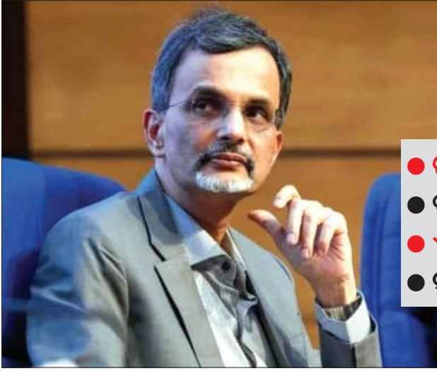
ପ୍ରଥମଥର ପାଇଁ ଗତ ତିନିମାସରେ ଭାରତରେ ଦରମା ହ୍ରାସ ପାଇଥିଲା। ଏହା ଦ୍ୱାରା ଉପଭୋକ୍ତା ବ୍ୟୟ ଏବଂ କର୍ପୋରେଟ ଉଦ୍ୟୋଗ ପାଇଁ ହାନିକାରକ ସାବ୍ୟସ୍ତ ହେବ। ଏହାକୁ ନେଇ ସେ ଅର୍ଥଶାସ୍ତ୍ର ଆଡାମ ସ୍ମିଥଙ୍କ ଲିଖିତ ପୁସ୍ତକର ଉଦାହରଣ