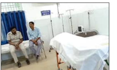
ବିଚାରାଧୀନ କଏଦୀଙ୍କ ମୃତ୍ୟୁ ଘଟିଛି। ମୃତକ ହେଲେ, କୋଇଡ଼ା ଅଞ୍ଚଳର ବ୍ରହ୍ମା ମୁଣ୍ଡା। ଏକ

ବଣାଇଁ, ୧୧/୧୧(ସମିପ): ବଣାଇଁଗଡ଼ ସ୍ୱତନ୍ତ୍ର ଉପ-କାରାଗାରରେ ଆଜି ସକାଳେ ଜଣେ