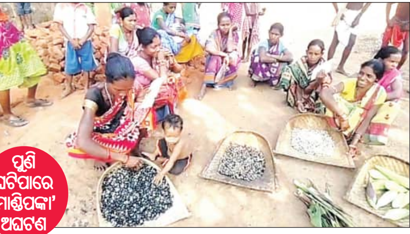
ପୁଣି ଘଟିପାରେ 'ମାଣ୍ଡିପକା' ଅଘଟଣ

ବାଲିଗୁଡ଼ା, ୧୦୧୧୧ (ସମ୍ପାଦକ): ୪ ମାସ ହେଲା ମିଳିନି ରାସନ୍ ଚାଉଳ। ତେଣୁ ଲୋକମାନଙ୍କୁ ପାଇଁ ଖୁସୀ, କରଡ଼ି, ଜଙ୍ଗଲୀ କନ୍ୟା ଓ ମକା ଭଳି ଜଙ୍ଗଲଜାତ ଉଦ୍ୟମ ଏବେ ସେମାନଙ୍କର ଭରସା ପାଇଛି। ମାଣ୍ଡିପକା ପରେ ସେହି କନ୍ୟାମାନଙ୍କୁ ଖାଦ୍ୟଭାବେ ଏମିତି ଆଉ ଏକ ବିକଳ ଚିତ୍ର ପଦାକୁ ଆସିଛି। ହୁମୁଡ଼ିବନ୍ଧ ବୁଦ୍ଧ ଭଣ୍ଡାରଙ୍ଗୀ ପଞ୍ଚାୟତର ଦୁର୍ଗମ ମାଝାଗୁଡ଼ା ଗ୍ରାମର ୧୮ ଆଦିବାସୀ ପରିବାର ସରକାରୀ ପ୍ରଚାରଣାର ଶିକାର ହୋଇ ଏବେ ଏମିତି ଦୁର୍ଦ୍ଦିନରେ ଦିନ କାଟୁଛନ୍ତି। ମିଳିନି ପ୍ରଦାନପ୍ରାପ୍ତ, ମାଝାଗୁଡ଼ାର ଏହି ୧୮ ଆଦିବାସୀ ପରିବାର ଗତ ଜୁଲାଇ ପରଠାରୁ ୪ ମାସ ହେଲା ଚାଉଳ ମିଳିନି। ମନରେଗାରେ ମଧ୍ୟ କାମ ମିଳୁନାହିଁ ବର୍ଷା ଦିନମାନଙ୍କରେ ପାଖ ଗାଁକୁ ଯାଇ ବିଲରେ ମଜୁରି କରି ବହୁ କଷ୍ଟରେ ପରିବାର ପ୍ରତିପୋଷଣ କରୁଥିଲେ। କିନ୍ତୁ ବର୍ତ୍ତମାନ ଆଉ କୌଣସି କାମ ମିଳୁନି। କିଛି ଦିନ ତଳେ ପଞ୍ଚାୟତ ଅଧିକାରୀଙ୍କ ମିଳୁଥିବା ଖବର ପାଇ ସେମାନେ ଯାଇଥିଲେ। କିନ୍ତୁ ସେଠାରୁ ନିରାଶ ହୋଇ ପେଟିବାକୁ ପଡ଼ିଥିଲା ବୋଲି ସେମାନେ କହିଛନ୍ତି। ତେଣୁ ଲୋକମାନଙ୍କୁ ପାଇଁ ଏବେ ସେମାନେ ଜଙ୍ଗଲ ଉପରେ ଭରସା କରୁଛନ୍ତି ବୋଲି କହିଛନ୍ତି। ସେମାନଙ୍କ କହିବା କଥା, ଜଙ୍ଗଲରେ କରଡ଼ି, ଜଙ୍ଗଲୀ କନ୍ୟା ଓ ବାଡ଼ିର ଖୁସୀ ଓ ମକା ସଂଗ୍ରହ କରି ଚାହାକୁ ରାନ୍ଧୁଛନ୍ତି। କିନ୍ତୁ ଏସବୁ ଜିନିଷ ସବୁବେଳେ ମିଳୁନଥିବାରୁ ବେଳେବେଳେ