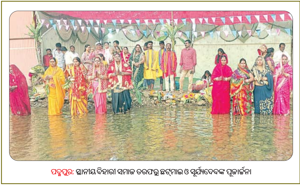
ପଦ୍ମପୁର: ସ୍ଥାନୀୟ ବିହାରୀ ସମାଜ ତରଫରୁ ଛତ୍ରମାଳ ଓ ପୂର୍ଣ୍ଣାଦେବଙ୍କ ପୂଜାର୍ଚ୍ଚନା