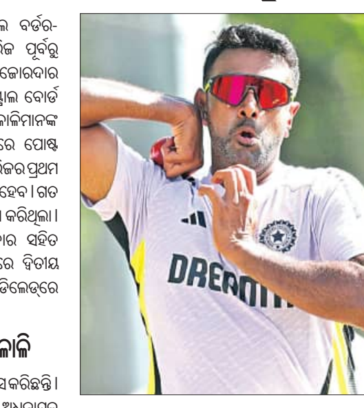
ନେଟ୍ ପ୍ରାକ୍ଟିସ୍ କଲେ ସବୁ ଖେଳାଳି