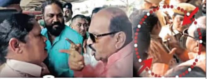
ରାଜ୍ୟ ବିଜେପି ସରକାରଙ୍କ ଆଭିମୁଖ୍ୟକୁ କଡ଼ା ସମାଲୋଚନା ସରକାର ବଦଳିଗଲେ ପୁଲିସ ଯୁନିଟ୍‌ମାନଙ୍କ ରକ୍ଷା ବଦଳେ ନାହିଁ ଆବେଦନକାରୀଙ୍କୁ ଜାମିନ ଦେଲେ ଶୁଣାଣି ପ୍ରଭାବିତ ହୋଇପାରେ ସର୍ବସାଧାରଣରେ ଉଦାହରଣୀୟ ବ୍ୟବହାର ରଖନ୍ତୁ ଜନପ୍ରତିନିଧି