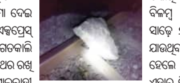
ରାଷ୍ଟ୍ରରେ ଲେଭେଲ କୁସିନ୍‌ କିଛି ଦୂରରେ ରେକର୍ଡ଼ର ଉପରେ ପଥର ରଖି ଦେଇଥିଲେ। ରାୟପୁର ପଟ୍ଟ ପେରୁଥିବା ଏକ ମାଲବାହୀ ଟ୍ରେନ୍‌ର ଲୋକୋ-ପାଇଲଟ୍‌ ଏହା ଦେଖି ତୁରନ୍ତ ନୂଆପଡ଼ା ଷ୍ଟେସନ୍ ମାଷ୍ଟରଙ୍କୁ ଜଣାଇଥିଲେ।

ନୂଆପଡ଼ା, ୧୧/୧୧(ସମିପ): ଜଣେ ମାଲବାହୀ ଟ୍ରେନ୍ ଲୋକା-ପାଇଲଟ୍‌ଙ୍କ ପାଇଁ ନୂଆପଡ଼ା ଜିଲ୍ଲା ସଦର ମହକୁମା ବେଲ ବିଶାଖାପାଟଣାକୁ ଯାତାୟତ କରୁଥିବା ବେଳେ ଭାରତ ଏକ୍ସପ୍ରେସ୍ ଏକ ବଡ଼ ଅଘଟଣାର ଅଘଟଣରୁ ଅଳ୍ପକେ ବର୍ତ୍ତିଯାଇଛି। ଗଡ଼ଜାତି ସଂଘରେ କିଛି ଦୁର୍ଘଟ ରେକର୍ଡ଼ର ଉପରେ ବଡ଼ ପଥର ରଖି ଦେଇଥିଲେ। ସେହି ସମୟରେ ଅତିକ୍ରମ କରୁଥିବା ମାଲବାହୀ ଟ୍ରେନ୍‌ର ଲୋକୋ-ପାଇଲଟ୍‌ଙ୍କ ନଜରରେ ଏହା ପଡ଼ିବାରୁ ସେ ଏ ଘଟଣାରେ ନୂଆପଡ଼ା ଷ୍ଟେସନ୍ ମାଷ୍ଟରଙ୍କୁ ଜଣାଇଥିଲେ। ତେଣୁ ବନ୍ଦେ ଭାରତ ଏକ୍ସପ୍ରେସ୍‌କୁ ନୂଆପଡ଼ା ଷ୍ଟେସନ୍ ନିକଟରେ ଅଟକାଯିବା ସହ ଅନ୍ୟ ଏକ ଧାରଣାରେ ଛଡ଼ା