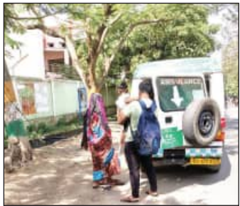
ତଦନ୍ତ ପରେ ନିଆଯିବ କାର୍ଯ୍ୟାନୁଷ୍ଠାନ : ସିଡିଏମ୍