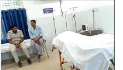
ବିଚାରାଧୀନ କଏଦୀଙ୍କ ମୃତ୍ୟୁ ଘଟିଛି। ମୃତକ ହେଲେ, କୋଇଡ଼ା ଅଞ୍ଚଳର ବ୍ରହ୍ମା ମୁଣ୍ଡା। ଏକ

ବଣାଇଁ, ୧୧/୧୧(ସମିପ): ବଣାଇଁଗଡ଼ ସତର ଉପ-କାରାଗାରରେ ଆଜି ସକାଳେ ଜଣେ