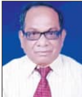
ପ୍ରଦେଶ ଉପଶମକ ସମ୍ପଦା

ବାୟୁ ପ୍ରଦୂଷଣର ସବୁଠାରୁ ବଡ଼ କାରଣ ହେଉଛି କାର୍ବାନ୍ ଉତ୍ସର ବ୍ୟବହାର । ଉଲ୍ଲେଖ ଅନାବଶ୍ୟକ ଯେ ସର୍ବାଧିକ ପ୍ରଦୂଷଣ ସୃଷ୍ଟିକାରୀ ଏହି ଉତ୍ସର ବ୍ୟବହାର ଗାଡ଼ିମୋଟରରେ ସର୍ବାଧିକ । ସାମ୍ପ୍ରତିକ ସମୟରେ ଜନସଂଖ୍ୟା ବୃଦ୍ଧିନୀରେ ମୋଟର ଯାନର ଅନୁପାତ ବୃଦ୍ଧିଗାମୀ । ପ୍ରତିଯୋଗିତାପୂର୍ଣ୍ଣ ଚଳଚ୍ଚିତ୍ର ଜୀବନରେ ମୋଟରଗାଡ଼ି ବ୍ୟବହାର ଏକପ୍ରକାର ଅପରିହାର୍ଯ୍ୟ ହୋଇପଡ଼ିଛି । ଏହି ପୃଷ୍ଠଭୂମିରେ ବ୍ୟକ୍ତି ପିଛା ଗୋଟିଏ ଗାଡ଼ି ବଦଳରେ ଅନେକଙ୍କ ପାଇଁ ଏକ ବା ସାଧାରଣ ପରିବହନ ବ୍ୟବସ୍ଥାର ଅଧିକ ପ୍ରସାର ହେବା ସହିତ ସେଥିପ୍ରତି ଲୋକଙ୍କ ମାନସିକତା ଓ ସଚେତନତା ସୃଷ୍ଟି ହେବା ଆବଶ୍ୟକ । ବିଶେଷକରି ସରକାରୀ ସ୍ତରରେ ଏହି ବ୍ୟବସ୍ଥାକୁ କଢ଼ାକଢ଼ି ଲାଗୁ କରିବା ଦରକାର । ଏହାଛଡ଼ା ବ୍ୟାଟେରି ଚାଳିତ ଇଞ୍ଜିନଗୁଡ଼ି ଗାଡ଼ି ବା ଇ-କେହିକଲର ଅଧିକ ପ୍ରଚଳନ ପ୍ରତି ବୃଦ୍ଧି ଦେବାକୁ ପଡ଼ିବ । ପ୍ରାୟତଃ ବର୍ତ୍ତମାନ ଆଉ ଏକ ଗୁରୁତର ସମସ୍ୟା । ଏହା ଯେତେ କମ୍ ହେବ, ଏପରିକି ଆଦୌ ବ୍ୟବହାର କରା ନ ଯିବ ସେଥିପ୍ରତି ପ୍ରଶାସନ କଢ଼ା ବୃଦ୍ଧି ଦେବା ଆବଶ୍ୟକ । ସର୍ବୋପରି ଏସବୁ କ୍ଷେତ୍ରରେ ଜନସାଧାରଣ ହିଁ ଗୁରୁତ୍ୱପୂର୍ଣ୍ଣ ଭୂମିକା ନିର୍ବାହ କରିପାରିବେ । କାରଣ ସମସ୍ୟା ସେମାନଙ୍କଠାରୁ ଓ ସେମାନଙ୍କ ଦ୍ୱାରା ସୃଷ୍ଟି ହେଉଥିବା ବେଳେ ଏହାର ପରାଧର ମଧ୍ୟ ସେମାନଙ୍କୁ ହିଁ ଭୋଗିବାକୁ ପଡ଼ୁଛି ।